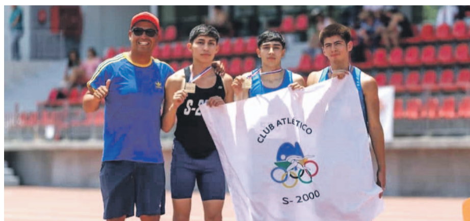
El Club Atlético S2000 de Ovalle, está llevando adelante un excelente trabajo en la disciplina del atletismo.