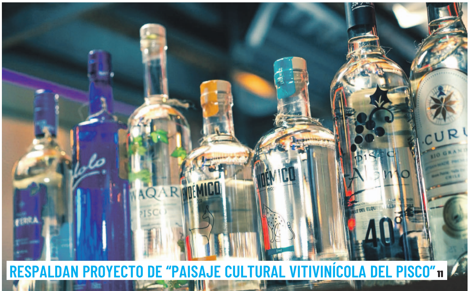
RESPALDAN PROYECTO DE "PAISAJE CULTURAL VITIVINÍCOLA DEL PISCO" 11

DENUNCIAN A LOCALES ILEGALES EN BARRIO INGLÉS 8