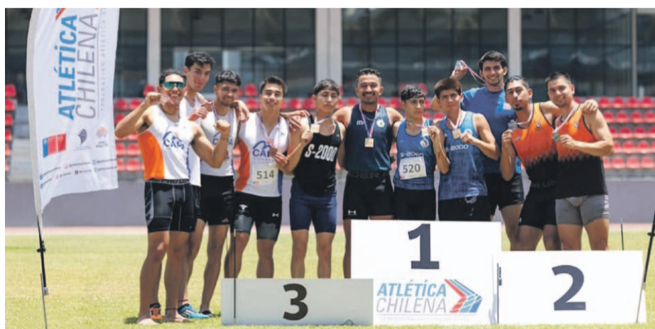
Respecto de este logro, en el directorio de la asociación consideran que cierran de manera brillante la temporada 2024.