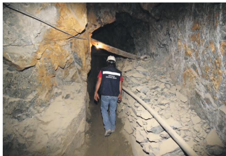
Gracias a estos recursos se tendrá Asistencia Técnica y Legal, orientada a apoyar la regularización de actividades de los pequeños mineros.