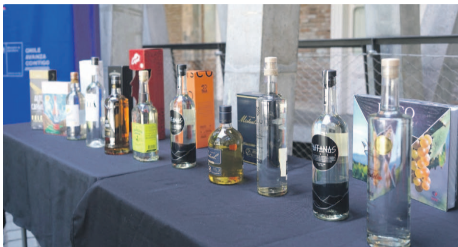
Los productores esperan que se impulse a la brevedad una política de Estado para la promoción y defensa de la denominación de origen del Pisco en Chile.