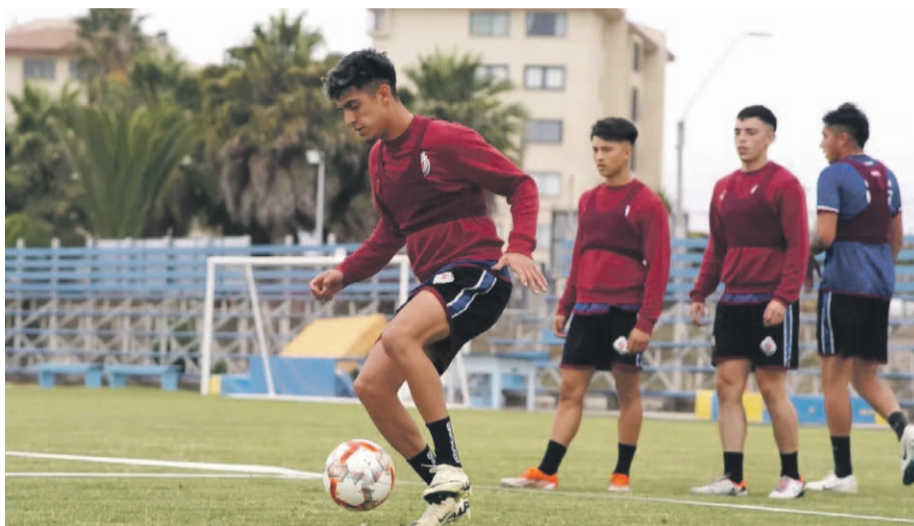
CD LA SERENA