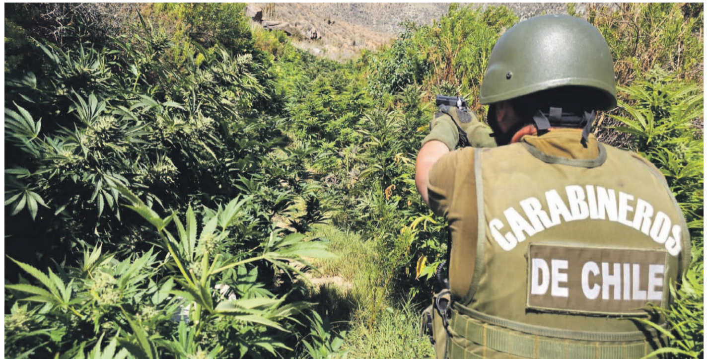
Los funcionarios de carabineros han realizado más de 145 operativos antidrogas en las provincias de Limarí y Choapa.

Y es que al 16 de diciembre, los carabineros especializados ya habían logrado intervenir el proceso de crecimiento de 96.839 plantas de cannabis, lo que se suma al decomiso de 1.992.383 kilos de marihuana procesada y casi 30 kilos de cocaína y pasta base respectivamente. Además, y apoyados con distintos recursos logísticos, el OS7 Limarí ya ha desarrollado más de 145 operativos antidrogas en ambas provincias, en un despliegue que representa un impacto directo al crimen organizado y a los grupos vinculados al tráfico de drogas, porque en lo que va de trabajo, hasta ahora el OS7 no solo ha logrado decomisos históricos de marihuana —dentro de los cuales se