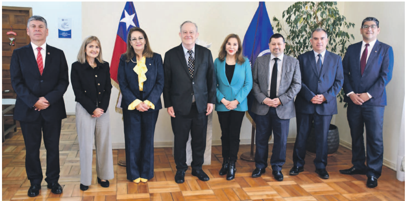
Representantes de la Universidad de La Serena como de la Fundación Emprépolis, destacaron los alcances de este convenio que generará espacios de cooperación que beneficien tanto a estudiantes como a emprendedores.

Este convenio tiene como objetivo generar espacios de cooperación que beneficien tanto a estudiantes como a emprendedores, a través de prácticas profesionales, desarrollo de tesis, pasantías y proyectos de interés mutuo, con un especial énfasis en el ámbito del emprendimiento y la innovación.