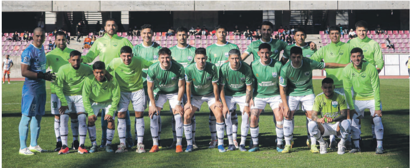
En el Ciclón y en otros seis clubes de la Segunda División apuestan por rebajar a 23 la edad de los jugadores que participen en dicha categoría.

Desde el club, sostienen que de esa manera se “potencia a jugadores jóvenes”. Sin embargo, las bases que entregaron a la ANFP para su modificación, serán definidas este jueves en el encuentro de los timoneles de los clubes de Primera División y Primera B.