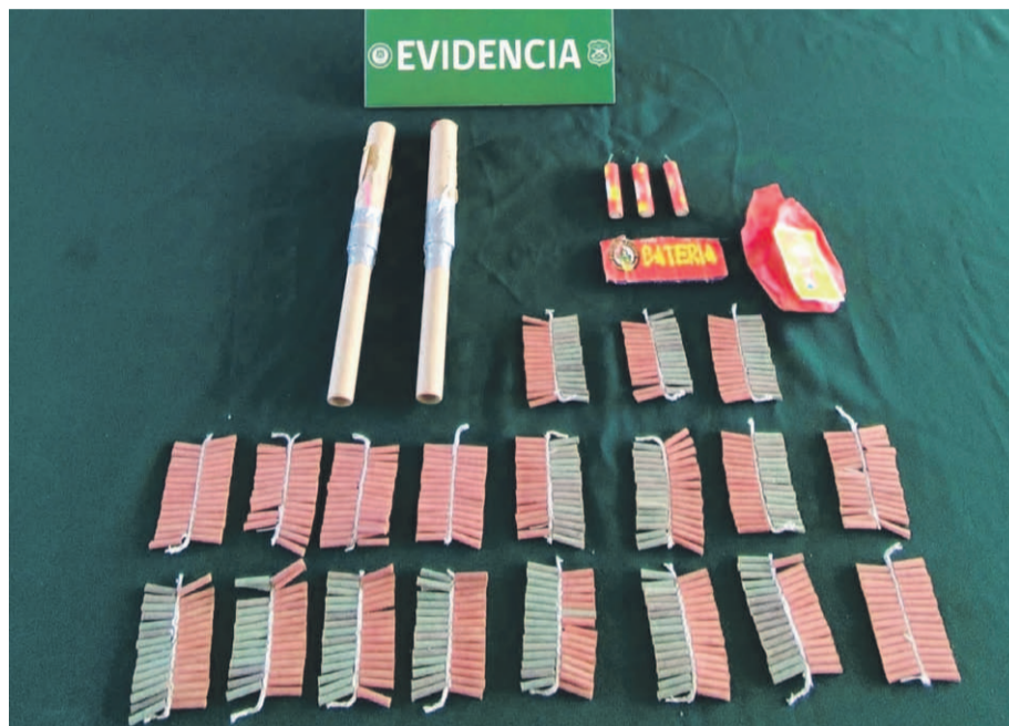
La venta de fuegos artificiales se encuentra totalmente prohibida y puede ser denunciada por cualquier ciudadano. Las querellas van directamente a los Juzgados de Garantía.