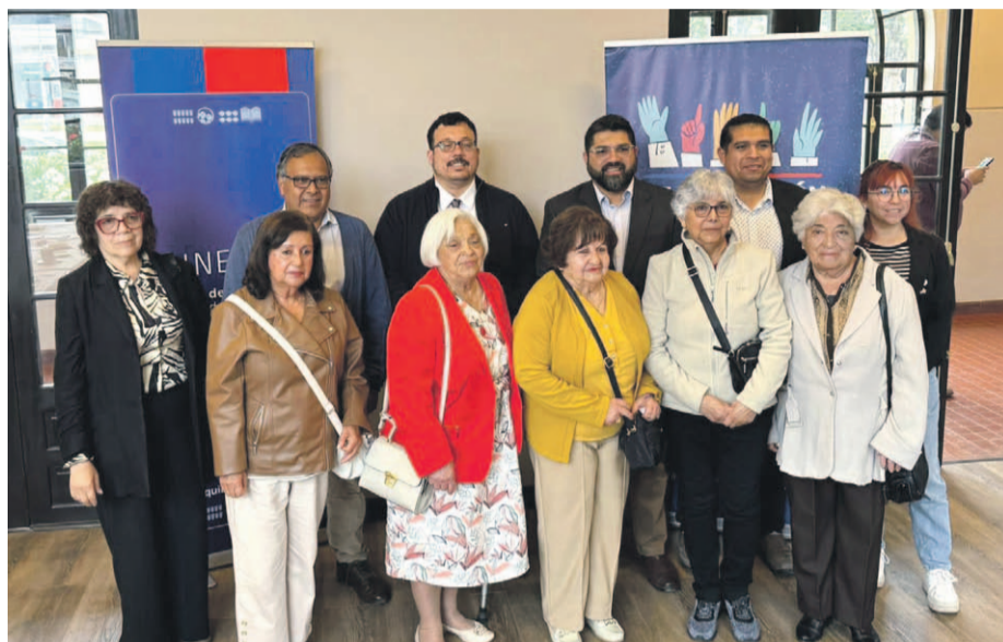
El proyecto de reparación de la deuda histórica será votado en el Congreso en enero de 2025.