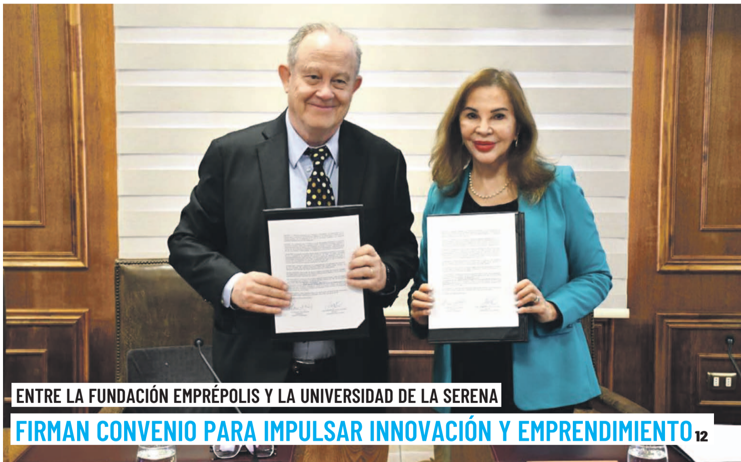
ENTRE LA FUNDACIÓN EMPRÉPOLIS Y LA UNIVERSIDAD DE LA SERENA

Si bien, desde el año 2022 no se registran personas quemadas en la región, en los últimos días Carabineros ha realizado dos operativos en la zona en los que se han incautado este tipo de artículos, lo que revela la existencia de un mercado ilegal que urge fiscalizar. 6