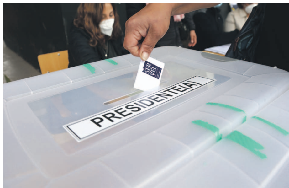
Los ciudadanos estarán nuevamente convocados a las urnas el próximo 6 de julio de 2025, para las elecciones primarias presidenciales y parlamentarias.

reelecto consejero regional de la DC, aseguró que el partido nunca debió perder el centro político. "Creo que estamos en una situación límite. La directiva nacional tiene que ser lo más lúcida, interpretar no solamente a la gente del partido, sino que al hombre común y corriente que no desea extremos ni excesos, sino que desea una sociedad más justa, igualitaria, progresista, en unidad".