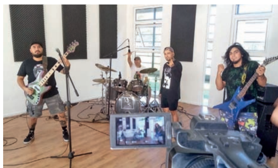
En Monte Patria Las Cumbres de la Música reunirá a diferentes exponentes.

La Ilustre Municipalidad de Ovalle lanzó la convocatoria “Música en tu paso”, invitando a músicos solistas o dúos a ser parte de estas sesiones, quienes hasta el 19 de enero podrán postular ingresando en www.ovallecultura.cl .