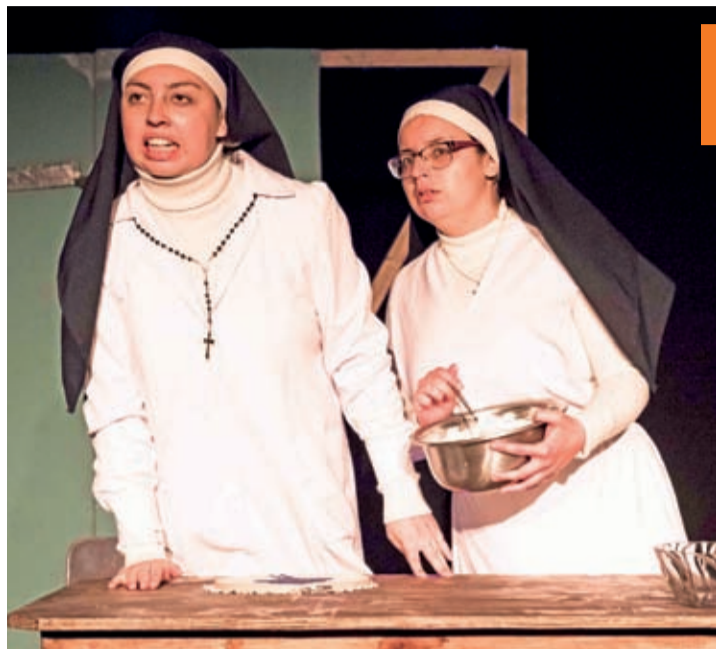
Este fin de semana se presenta "Siervas o Prisioneras del Buen Pastor" en la Casona La Gaviota, de La Serena.

Resistir, esa fue la consigna, mantener a las audiencias, el desafío. La difusión online, la herramienta básica para seguir vigente.