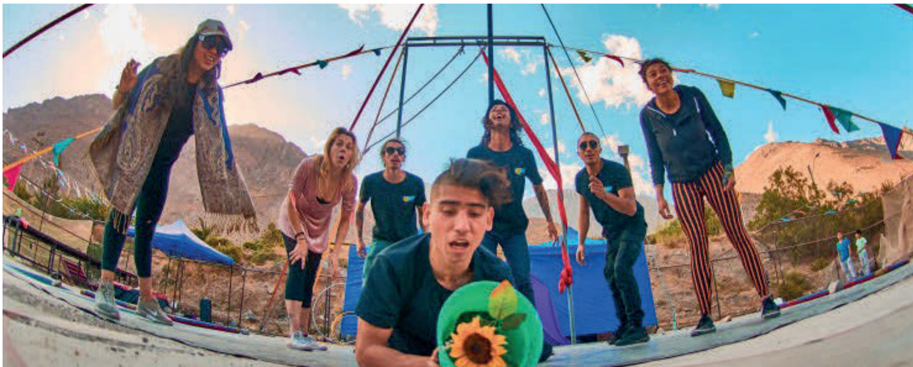
El elenco de la compañía del Circo La Cuarta Estación se encuentra en etapa de preproducción para grabación de su obra Infinito .