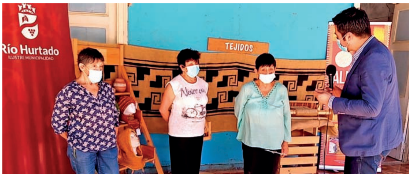
Emprendedores de Río Hurtado presentan sus productos vía Facebook en la Feria Costumbrista virtual.

En Monte Patria, la cultura no solamente estará presente en el verano, sino que el calendario se extenderá hasta junio de 2021, destacando iniciativas de investigación documental, poesía, arte visual, circo contemporáneo y música. Mediante diversos proyectos financiados por el Ministerio de las Culturas, las Artes y el Patrimonio y co-financiado por el municipio de Monte Patria, la Unidad de Cultura/Centro Cultural Huayquilonko ofrece una cartelera cultural amplia y variada mediante la hibridación digital y presencial con aforo reducido.