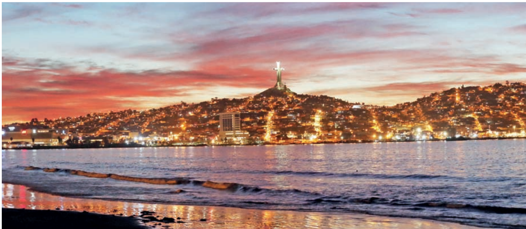
El pasado jueves 14 fue la inauguración del "1er Boulevard Cultural Coquimbo 2021" en La Herradura.