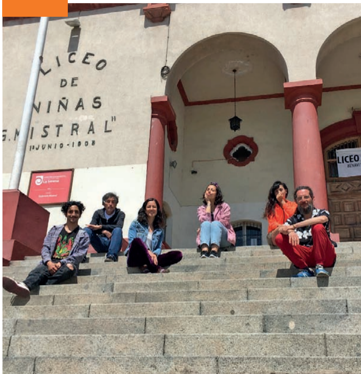
El Laboratorio Escénico de Movimiento Descascarade se presentará en el frontis del Liceo de Niñas Gabriela Mistral de La Serena.

24 DE ENERO a las 19:30 horas será la función, cuyo aforo permitido es de 50 personas.