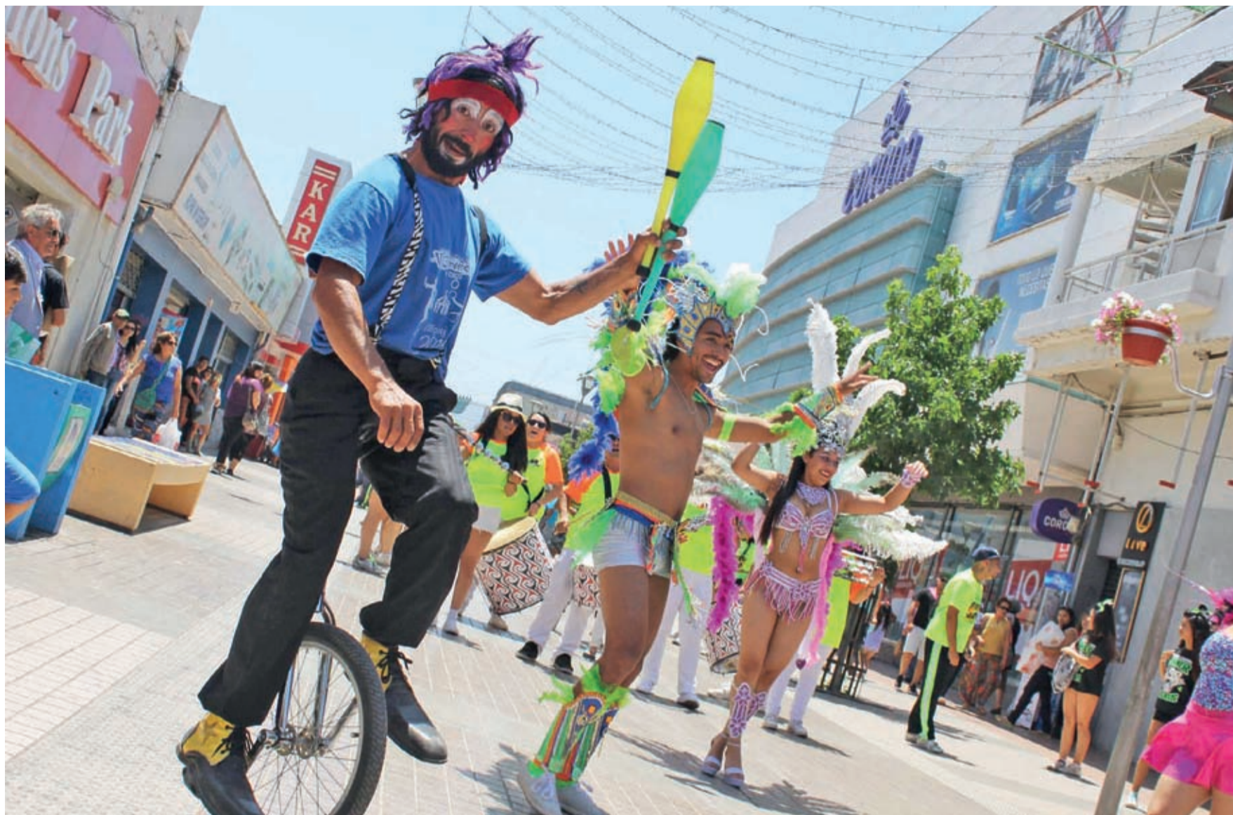
En Ovalle se desarrollará de manera presencial el "Carnaval Sobre Ruedas" entre el 19 y el 22 de enero.