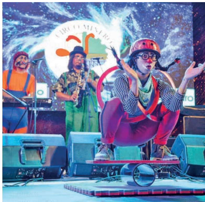
Los shows serán grabados previamente por la organización de la seremi de las Culturas.

Cabe recordar que el mundo artístico ha sido uno de los más afectados por las consecuencias de la pandemia, quienes venían resentidos desde la paralización que generó el estallido social. Hoy buscan reinventarse y así poder reactivar su fuente laboral.