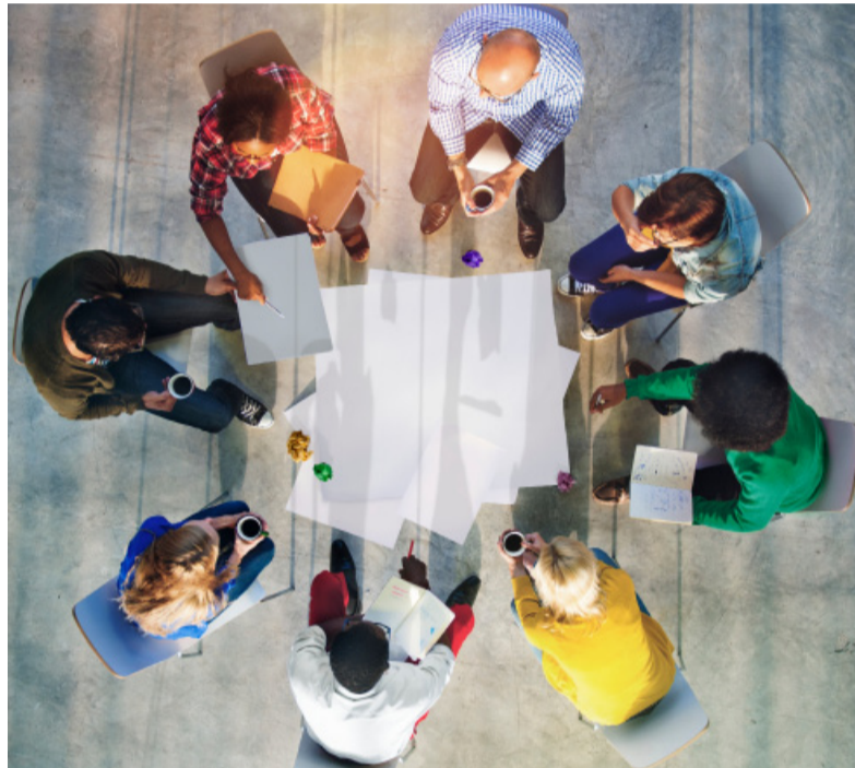
Reunión de trabajo en equipo.