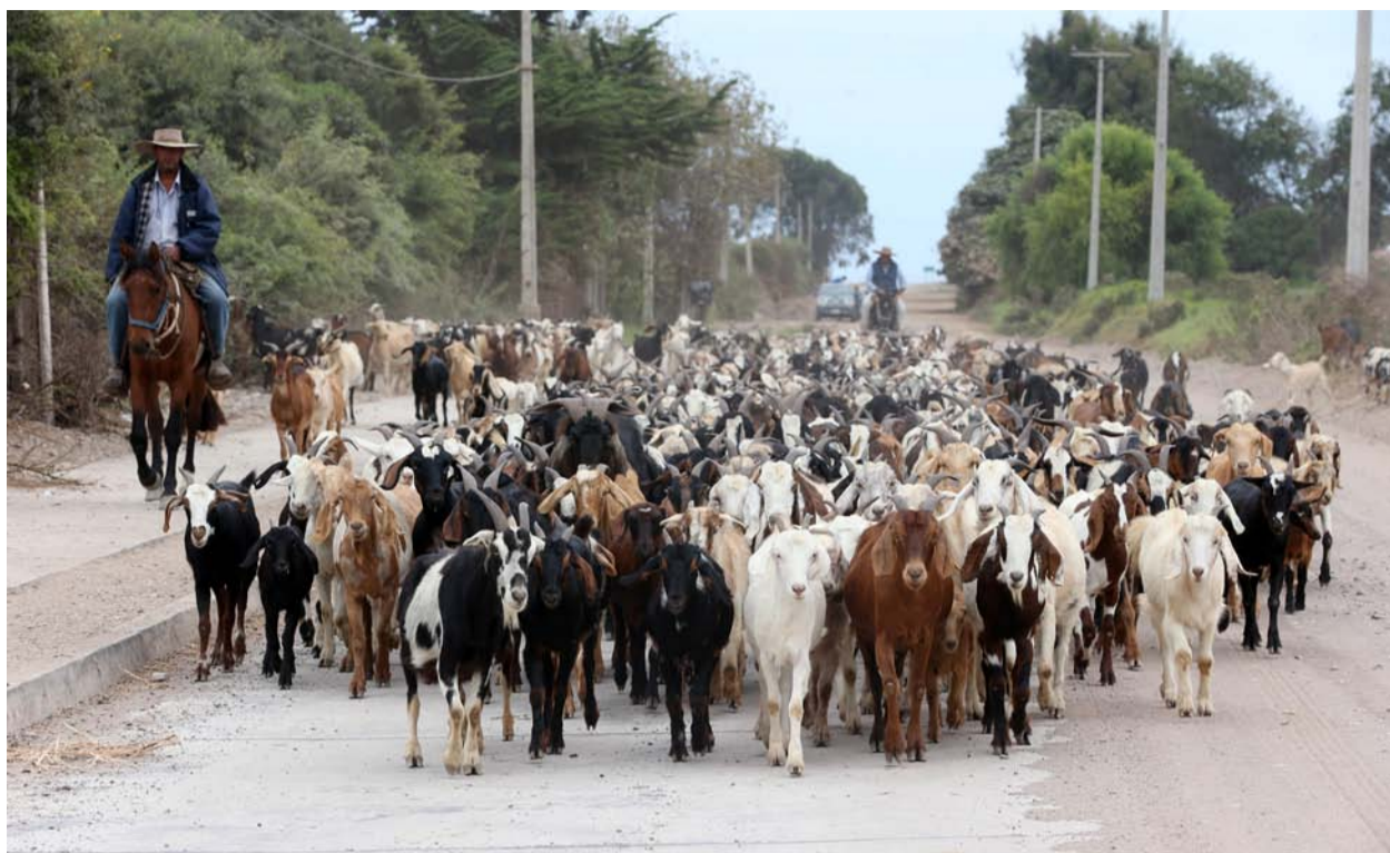
La Provincia de San Juan decidió no autorizar las veranadas por tercera temporada consecutiva.