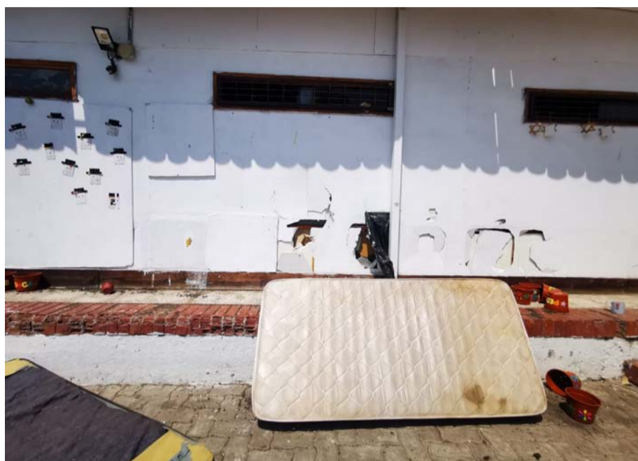
Registro de las deficiencias denunciadas por ex trabajadores de "Renacer". LAUTARO CARMONA

Por lo anterior, El Día tomó contacto con los organismos del Estado a cargo de la supervisión de estos centros, confirmando la versión del denunciante anónimo la noche de ayer.