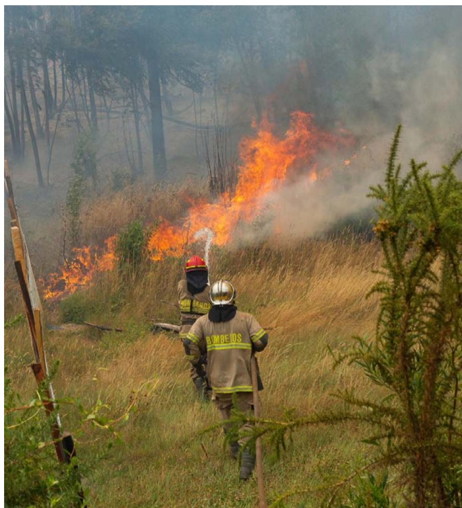
Durante las últimas 2 semanas, más de 7.000 personas han resultado damnificadas durante la emergencia.

Los datos entregados por la jefa de Interior, según detalló, se basan en evaluaciones realizadas por la Corporación Nacional Forestal (Conaf), que a la fecha ha investigado 600 siniestros en 2023.