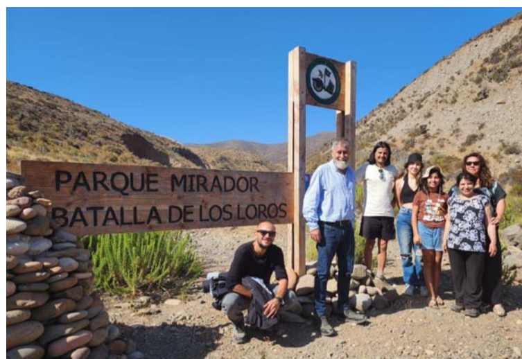
Una de las iniciativas fue adjudicada a la organización Parque Mirador Batalla de Los Loros.