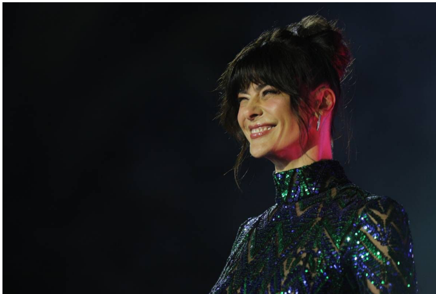
Anoche se llevó a cabo la "Noche cero", la gala del Festival de Viña del Mar 2023. Los animadores fueron Tonka Tomicic y Eduardo Fuentes.

La organización del festival tampoco lo ha tenido fácil este año, ya que diversas bajas de su cartel obligaron a buscar a nuevas figuras a última hora: el 7 de febrero se retiró el grupo mexicano Maná, por problemas de salud de su cantante y, una semana después, renunció el humorista que acompañaba a los mexicanos, Yerko