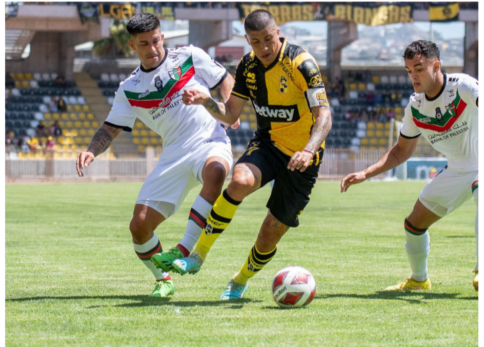
Los piratas se la jugarán por mantener su invicto sin derrotas de local.

“Queremos aumentar los minutos con el equipo ordenado, empezar a acumular