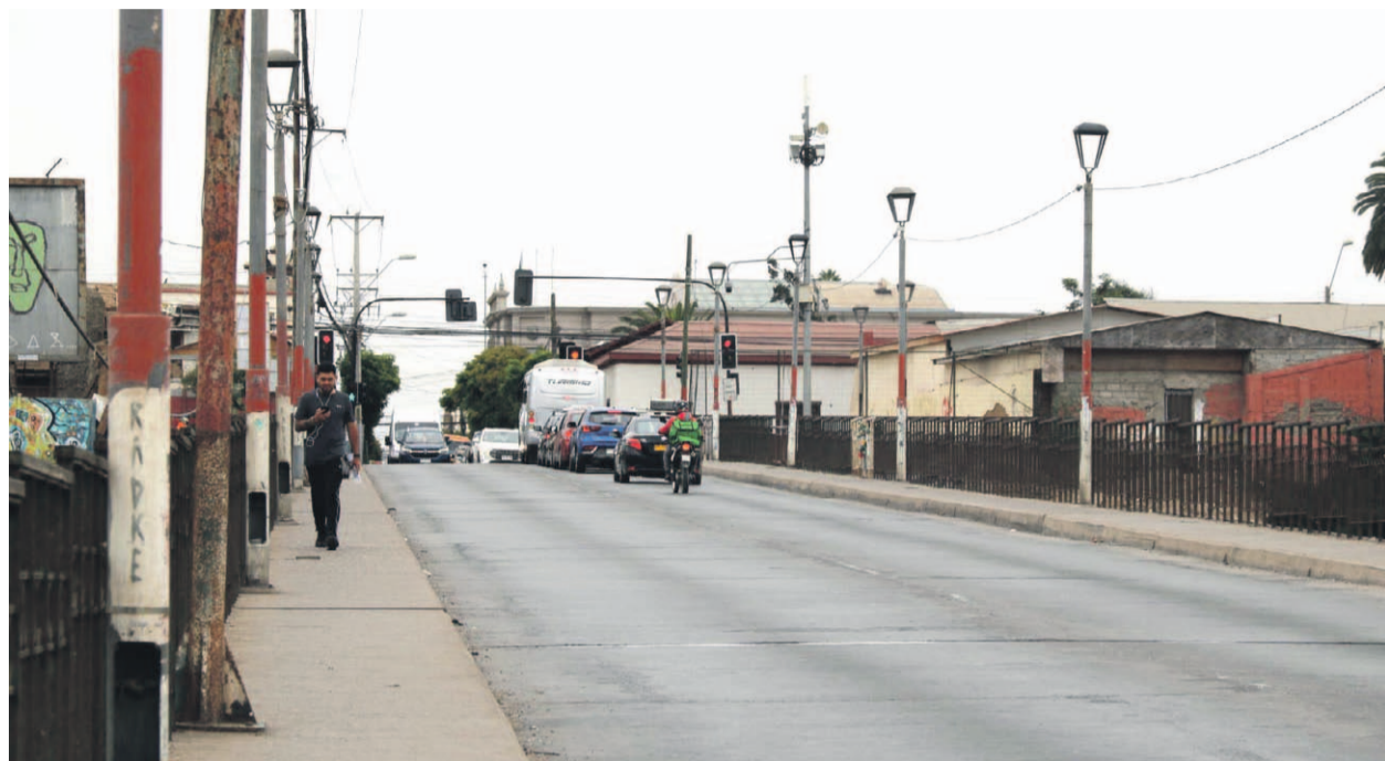
El puente Libertador de Las Compañías se ha transformado en un punto crítico para la seguridad en La Serena.

En los últimos años, el puente Libertador que une a Las Compañías con el centro de La Serena, se ha transformado en un escenario de tragedias evitables, razón por la cual algunos expertos proponen el uso de cercas no escalables y otras medidas preventivas.