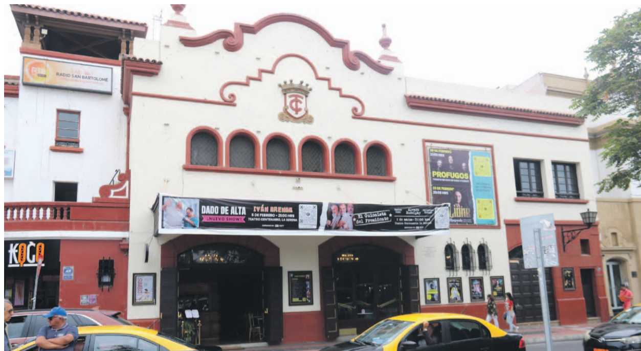
El teatro Centenario se encuentra en el medio de querellas y demandas entre quienes lo administran y quienes lo tienen subarrendado. ÓSCAR ROSALES

El subarrendatario del recinto reconoció que fue demandado por no pago de arriendo, pero descartó que se vaya a clausurar el espacio por lo pronto y explicó que ha habido incumplimientos de parte de su arrendador por lo que discontinuó los pagos. No obstante, en la demanda interpuesta se solicita la clausura del lugar por una serie de faltas al contrato.