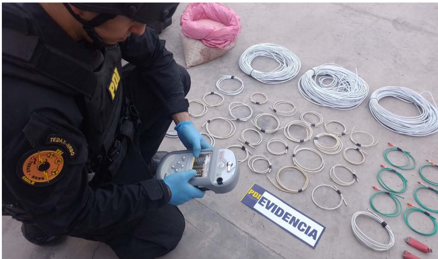
La "Operación Beirut" fue denominada así, por ser el mismo material que en la gigantesca explosión que afectó el puerto de la capital del Líbano.

La "Operación Beirut" fue denominada así, por la gigantesca explosión que afectó el puerto de la capital del Líbano, el 4 de agosto del año 2020, cuando se activaron 2.750 toneladas de Nitrato de Amonio (ANFO) almacenados sin medidas de seguridad, y corresponde a la misma sustancia química que incautaron los detectives en las viviendas de Punta Colorada. La explosión en Beirut dejó más de 200 muertos, 7 mil heridos, desplazó a 300 mil personas y los efectos de dicha emergencia se sintieron en un radio de 20 kms.