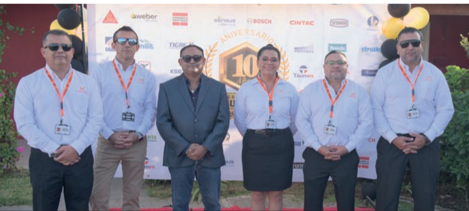
Equipo de Ventas de Comercial Mundaca.