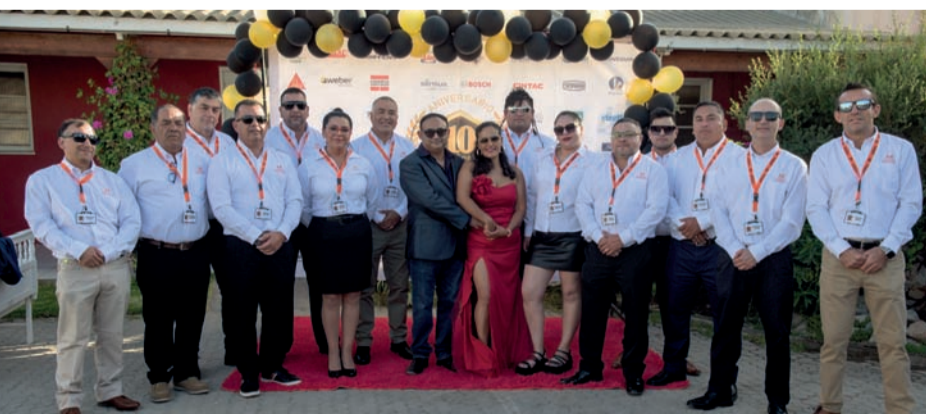
Colaboradores de Comercial Mundaca, durante la celebración del décimo aniversario de la empresa.