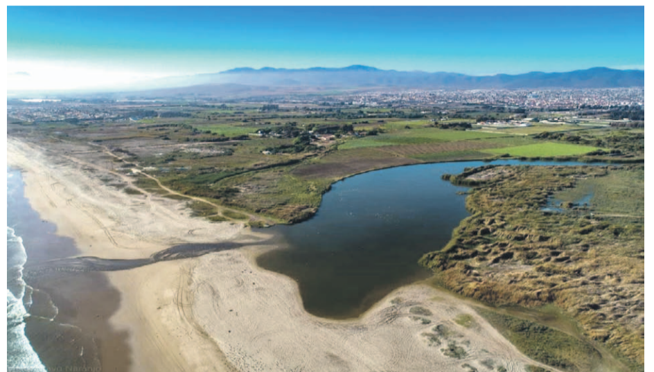
La desembocadura del río Elqui había obtenido la calidad de humedal urbano durante el año 2022, tras gestiones del Ministerio del Medio Ambiente.