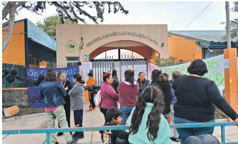
Los padres y apoderados del Colegio David León Tapia han reclamado por las malas condiciones del colegio, por lo que piden mejoras reales.

Según algunos apoderados que han protestado por las malas condiciones del alcantarillado del establecimiento, se decidió dejar en libertad de acción a los padres para que éstos decidan si envían a sus hijos al establecimiento, mientras se solucionan los problemas que aquejan a este recinto escolar.