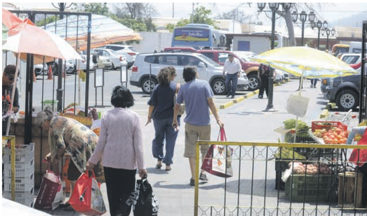
La nueva ley obliga a los consumidores a llevar sus propias bolsas reutilizables o a usar cajas para transportar los productos, práctica que para algunos ha resultado bastante incómoda.