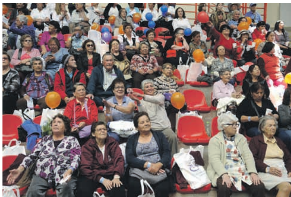
Durante el 2018, se entregaron recursos a 201 clubes del Adulto Mayor en la Región de Coquimbo que postularon a diferentes proyectos.

Cabe destacar que estos recursos se entregan directamente a los representantes de los clubes y son ellos quienes deben ejecutarlos. Para evitar situaciones como la ocurrida con la agencia de turismo denunciada, Elgueta aseguró que desde