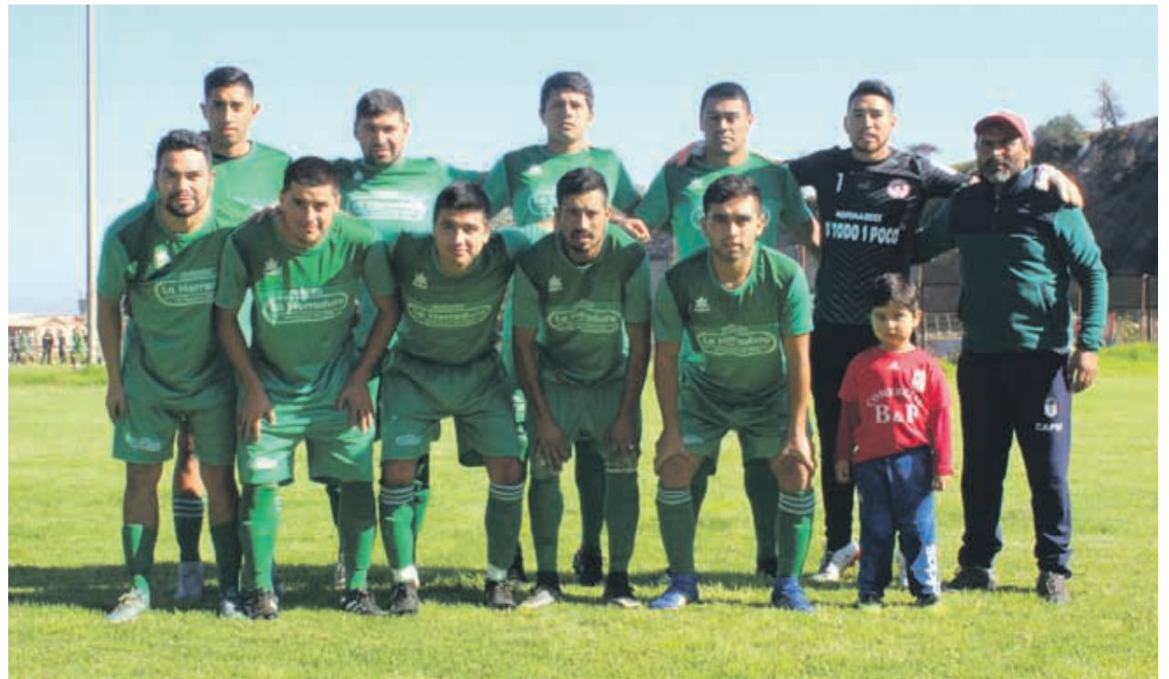
Los Copihues iniciaron su defensa de la corona con un empate en la Asociación Serena Centro.

Una tras otra eran las llegadas de los verdes. Pero si