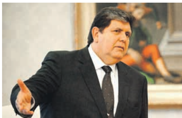
Otra imagen del malogrado exmandatario peruano.