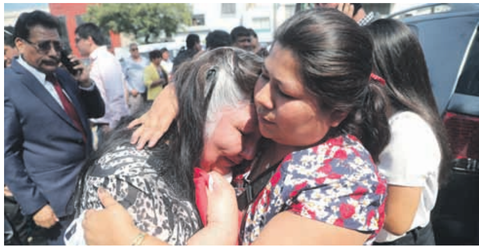
Grupos de militantes apristas llegaron hasta las afueras del hospital donde dieron rienda suelta a las emociones que les causó la dramática partida de García.