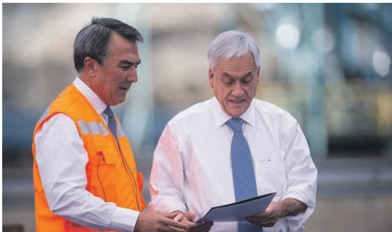
El primer mandatario y el ejecutivo de Antofagasta Minerals cumplieron con el hito que da el vamos a esta iniciativa.

El representante de la compañía destacó que esta es la mayor inversión realizada por la minera después de su puesta en marcha hace 20 años, lo que permitirá aumentar la capacidad de molienda para enfrentar la mayor dureza de los minerales.