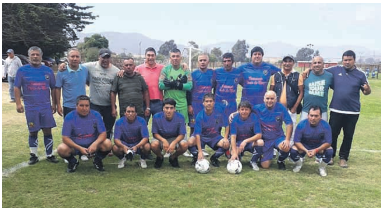
Sporting Bolívar sumó su cuarto triunfo en fila y es líder exclusivo de la categoría Sub 43 en la Liga Santa Inés.