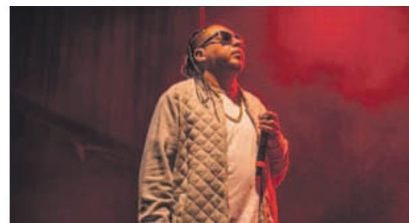
Uno de los grupos será Shamanes Crew. Las entradas costarán hasta el viernes 10 mil pesos y en la puerta a 15 mil.

Para mayores antecedentes en facebook e instagram en "Manso Mambo Bodeguero" de La Serena. 1202