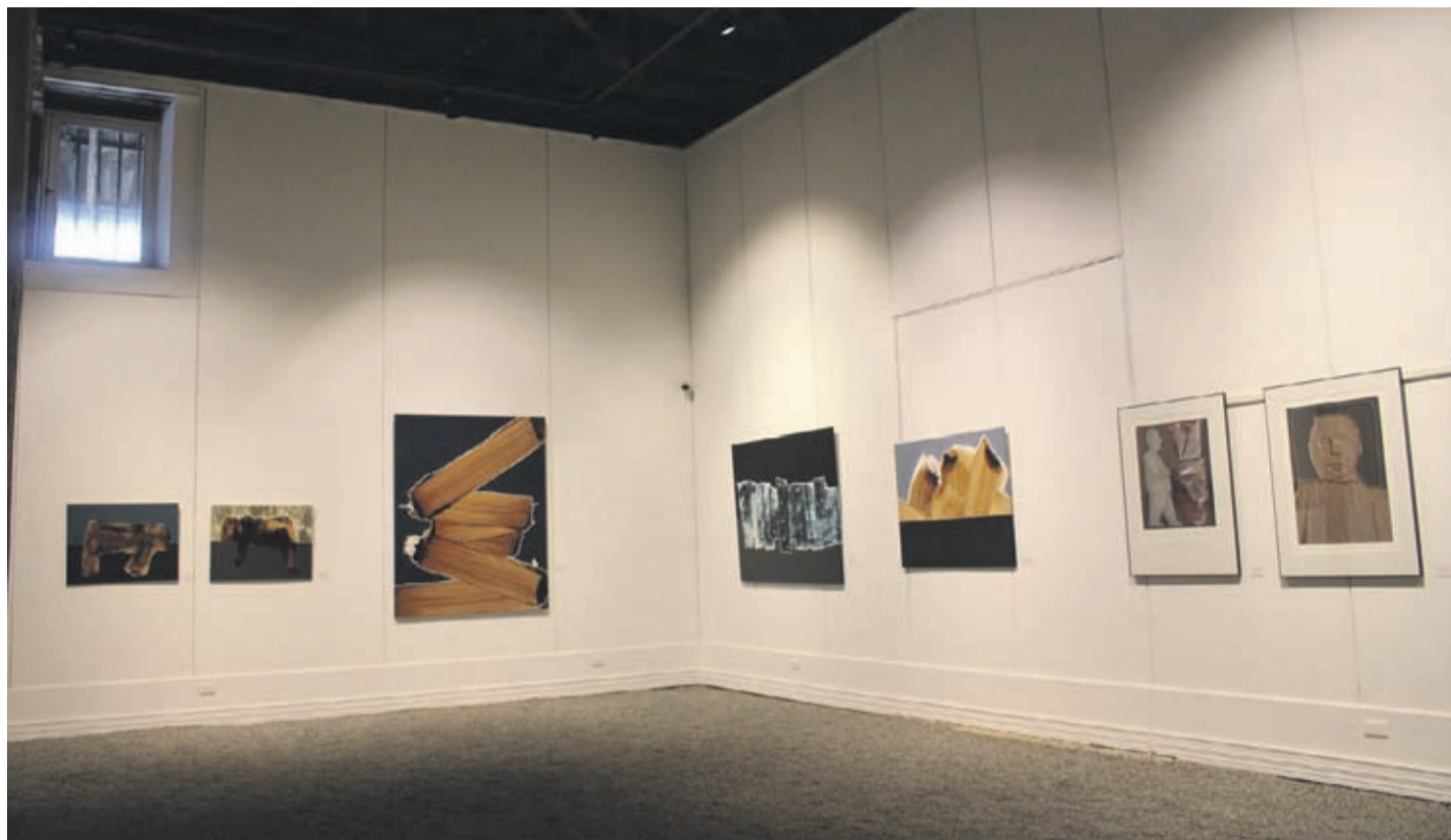
FACEBOOK BODEGÓN CULTURAL DE LOS VILOS

“En ella destacan connotados artistas de larga trayectoria a nivel nacional e internacional, incluyendo también, obras de artistas locales. Todos ellos