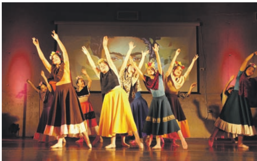
FACEBOOK BODEGÓN CULTURAL DE LOS VILOS

Para seguir las obras del Bodegón Cultural se pueden seguir en las redes sociales como bodegonculturaldelosvilos en Facebook e Instagram.