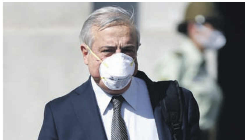
El ministro de Salud, Jaime Mañalich, preocupado por evolución del Covid-19.

En algunas como Punta Arenas hay un alto número de hospitalizaciones, mientras que en Concepción se detectó un brote. El ministro de Salud reconoció que se ha registrado problemas a la hora de internar a contagiados.