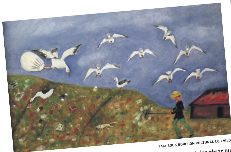
FACEBOOK BODEGÓN CULTURAL LOS VILOS

La Escuela de Danza Bodegón, en esta oportunidad “Amor, amor de mis amores” que forma parte de la obra KAHLO-LARA, trabajo original realizado el año 2016.