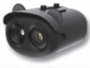
CÁMARA DETECCIÓN DE TEMPERATURA

SERVITEC SALUDA A CIDERE EN SU 44º ANIVERSARIO Y DESTACA SU GRAN APOORTE AL DESARROLLO REGIONAL.