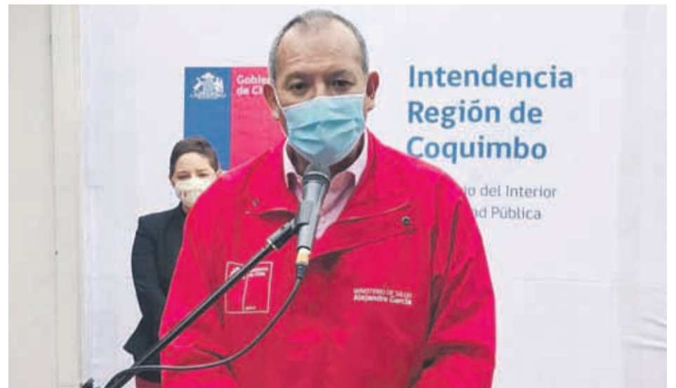
Seremi de Salud, Alejandro García, en punto de prensa por balance diario del avance de la pandemia del Covid-19 en la Región de Coquimbo.

El seremi de Salud, Alejandro García, complementó ejemplificando que si en una población donde antes habían 2 casos por semana, se registran 50 en una, marcada por distintos brotes, relacionados entre sí, pero con una “dispersión geográfica”