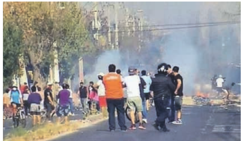
Vecinos se enfrentaron con Carabineros tras las protestas por la falta de alimentos en la comuna, ubicada al sur de Santiago.

Los vecinos manifestaron a la televisión que la manifestación no es contra la medida de confinamiento, sino “contra el hambre” y la “ausencia de un Estado que no se preocupa de su pueblo”.