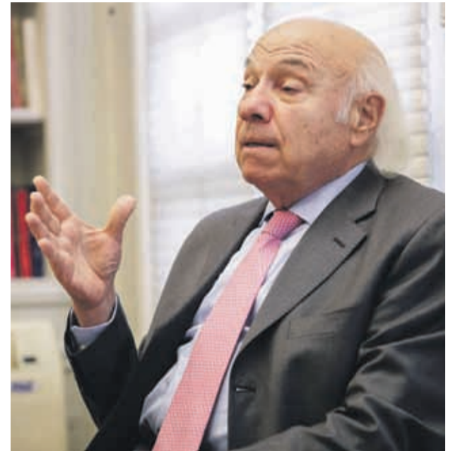
Vittorio Corbo visitará la región este miércoles 19 de junio, en el marco de la Asamblea Anual de Cidere.

Lo cierto, precisó Corbo, es que la región de Coquimbo volvió a crecer en 2018 luego de dos años de caídas en la actividad. Sin embargo, es la segunda región que menos creció durante el año pasado. “Sin duda esto se debe a la preponderancia que tiene para la Región de Coquimbo la actividad minera, la cual