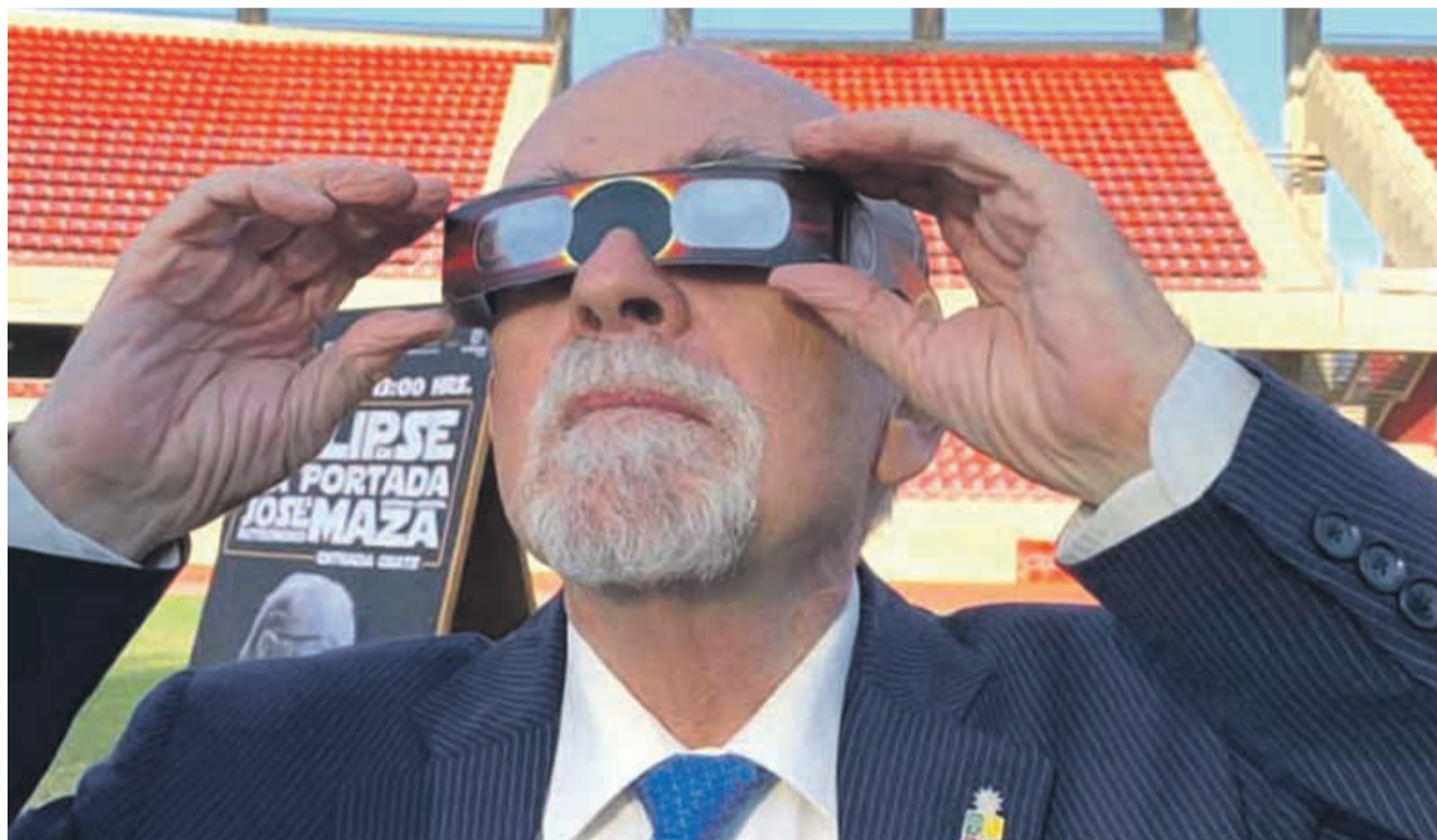
La actividad tendrá lugar en el auditorio del Centro Empresarial y Negocios de Coquimbo este jueves 20, a las 19:00 horas.

"(...) Las personas tendrán que tomar un viaje de al menos nueve