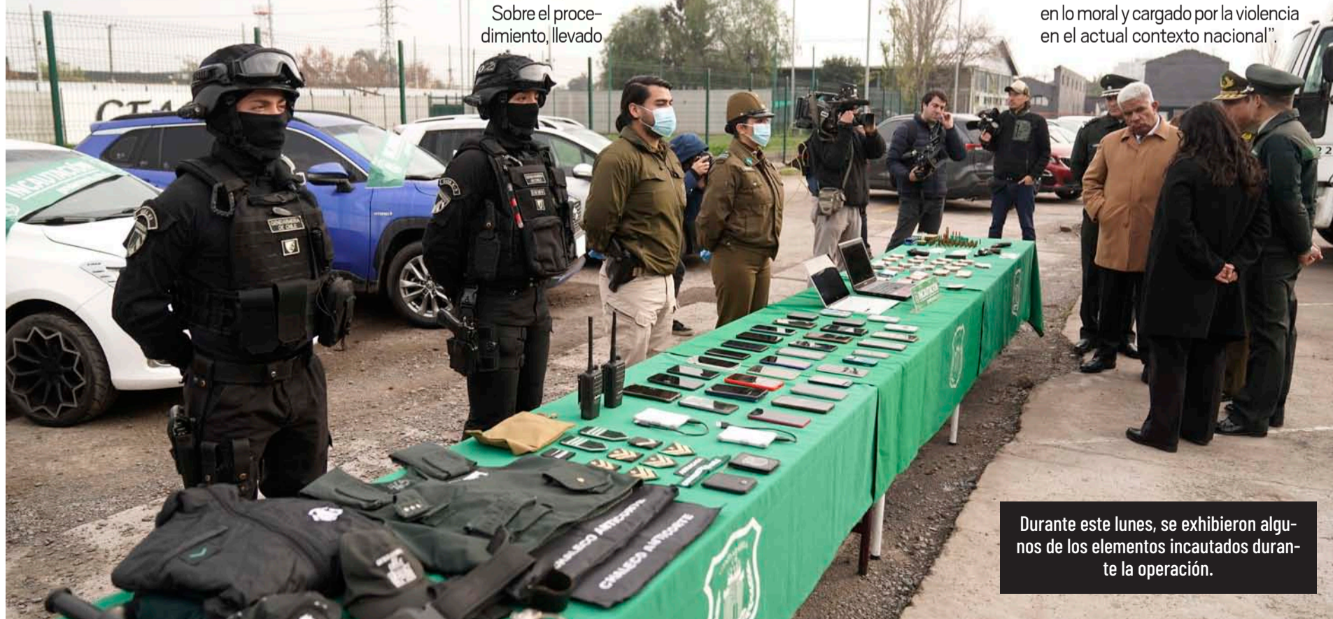
Durante este lunes, se exhibieron algunos de los elementos incautados durante la operación.

Asimismo, afirmó que "debemos ser justos con que la mayor parte de los funcionarios y funcionarias que integran las filas de Gendarmería son personas honestas, abnegadas, que se desempeñan la mayor parte del tiempo en condiciones adversas, de inferioridad numérica y dentro de ambientes altamente corrosivos en lo moral y cargado por la violencia en el actual contexto nacional".