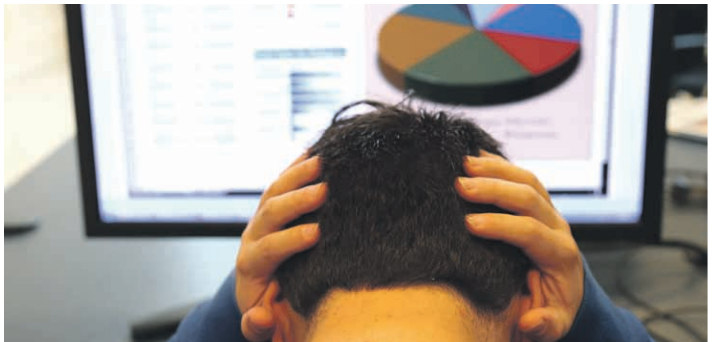
Un explosivo aumento de personas que se declaran en quiebra experimentó la Región de Coquimbo en el primer semestre de 2019. LAUTARO CARMONA

En 2018, las personas que se acogieron a la Ley de Insolvencia y Reemprendimiento en la Región de Coquimbo sumaban 68, cifra que este año aumentó a 127. Expertos entregan tips a las personas para evitar caer en morosidad y no tener que liquidar sus bienes.