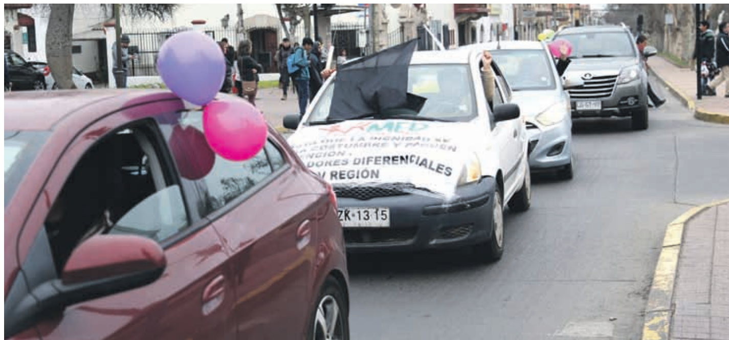
En La Serena se realizó una caravana de vehículos desde la Plaza Tenri hasta el sector Cuatro Esquinas, como una manera de seguir visibilizando el movimiento.

La posición de los docentes en la región es la de acatar lo que se establece en las consultas nacionales.