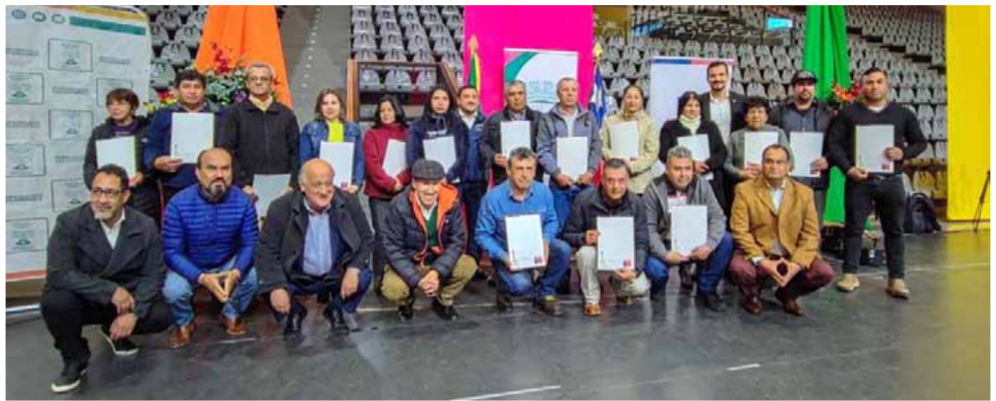
Agradecidos se mostraron los distintos vecinos y vecinas que recibieron sus respectivos títulos de propiedad de parte de las autoridades.