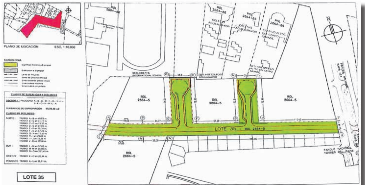
Detalle del Lote 35 que se expropiará a la Agrícola Cuatro Amigos, cuyos dueños están involucrados en el caso del "Papaya Gate".

Parte de las propiedades ubicadas en el sector oriente de La Serena, específicamente en San Ramón, serán incorporadas al proyecto de mejoramiento de Avenida Cuatro Esquinas. Respecto a su valor, éste fue determinado por un equipo de tasadores que consideró su ubicación, características, densidad y afectaciones.