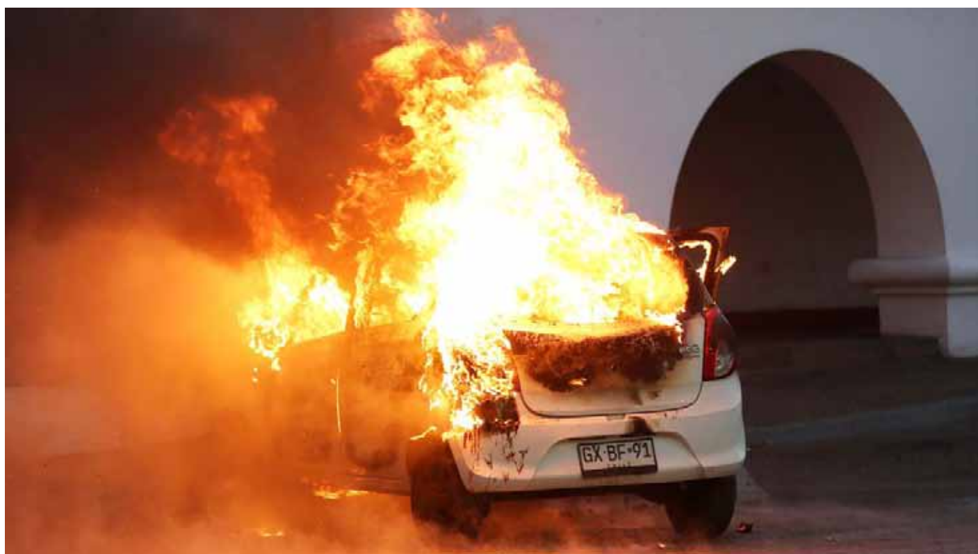
Autoridades y comerciantes esperan que no ocurran hechos violentos en las comunas de la Región de Coquimbo.