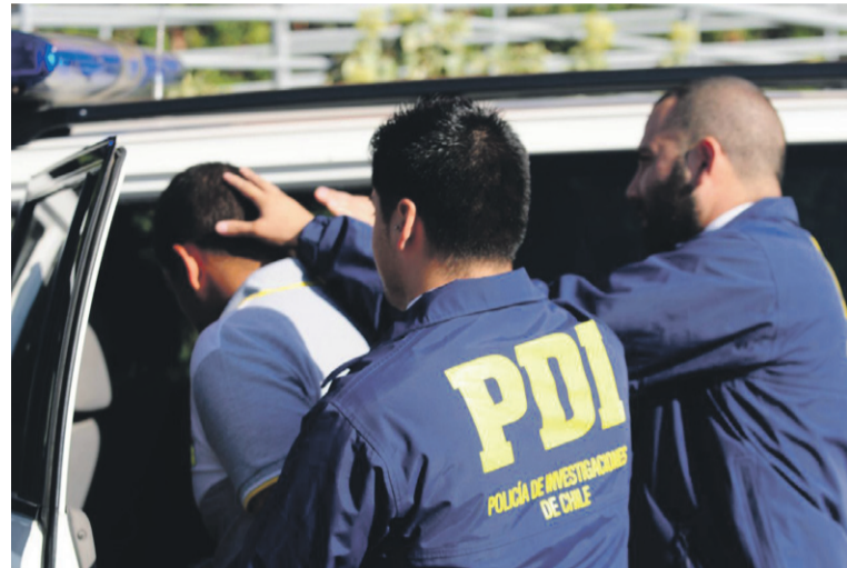
El prófugo logró ser detenido por la PDI en La Serena.