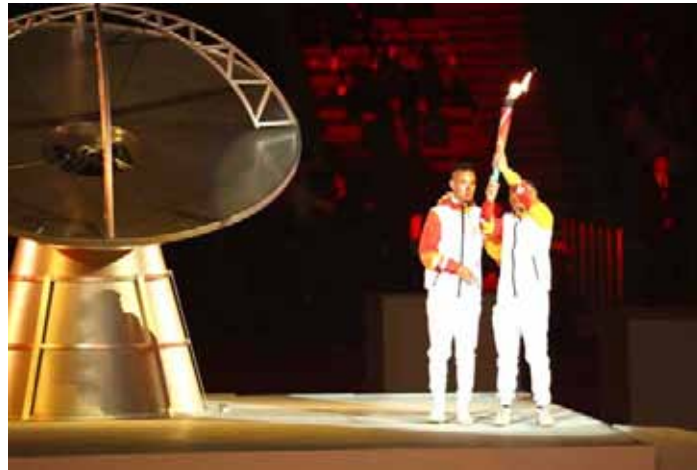
El tres veces campeón paralímpico, Cristian Valenzuela, encendió el pebetero y le dio el vamos oficial a los Juegos Parapanamericanos.

Con un deslumbrante diseño escénico se inauguró la cita deportiva que sumergió a los espectadores en una experiencia visual gracias a una escenografía vanguardista que fusionó modernidad y estética.