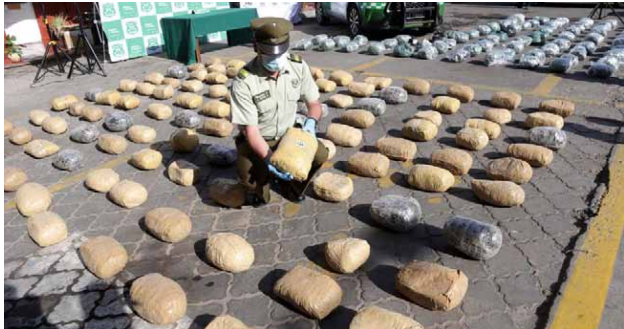
Carabineros exhibió ante la prensa los 189 kilos de marihuana procesada que fueron decomisadas en la provincia del Choapa, en un control vehicular nocturno.

Consultado por diario El Día si la carga de droga venía oculta en los vehículos o se transportaba como una carga normal, el General Muñoz explicó que “en un station wagon venían en su interior los 78 kilos (de marihuana), mientras que el otro