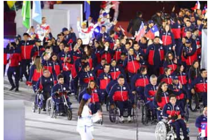
El desfile de la delegación chilena en el Estadio Nacional marcó el momento de mayor emotividad en la noche santiaguina.