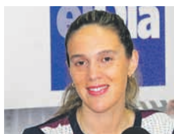
DANIELA NORAMBUENA EXGOBERNADORA DE ELQUI

“Creo que hay que adecuarse a los tiempos y a los contextos, es importante definir el rol de la mujer en la elaboración de la nueva constitución y que sea equitativo con el de los hombres”.