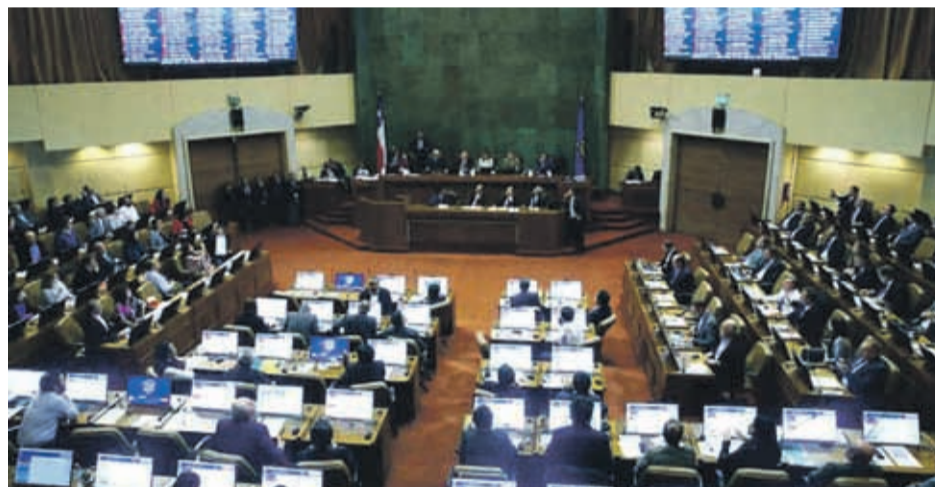
CÁMARA DE DIPUTADOS

Ayer la Cámara de Diputados discutió las normas transitorias sin alcanzar el quórum requerido. Chile Vamos se alineó para votar en contra pese al compromiso de algunas de sus parlamentarias con la oposición. Sin embargo, al proyecto de reforma constitucional, que habilita el plebiscito de abril del próximo año, se le dio luz verde y pasó al Senado.