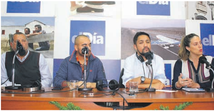
Los participantes del foro coincidieron en que sean cual sean los resultados del plebiscito de abril, los respetaran.

las marchas, si bien existía lumpen y delincuentes, también habrían infiltrados que provocarían los desórdenes. “Eso lo hemos tenido históricamente en nuestras manifestaciones, porque qué pasa cuando se está quemando un hotel, y no hay ningún carabiniero a la vista cuando la prefectura está a cinco cuadras, eso es raro”, manifestó.