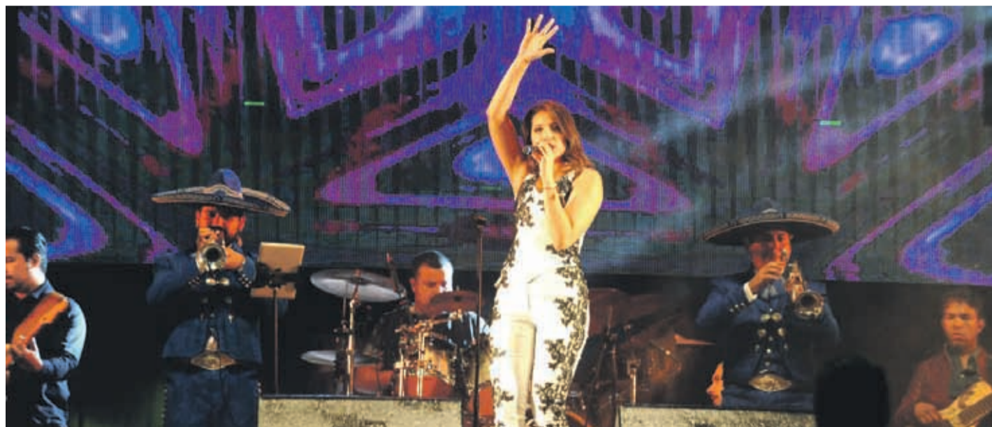
La cantante nacional María José Quintanilla en la edición 2018 del Festival de La Serena.