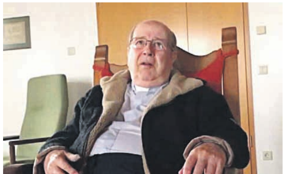
La última imagen que se tiene del ex arzobispo de La Serena, cuando fue encontrado por un equipo de prensa en Alemania, hace un año.