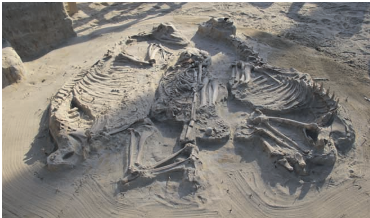
Fotografía de la excavación, esqueleto de músico Ánimas con flauta y banda de oro.