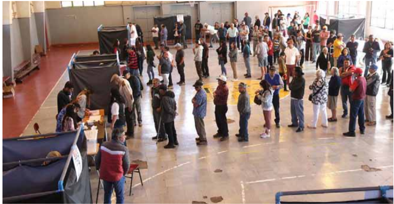
El mayor flujo de votantes se registró durante la mañana en La Serena y Coquimbo.

Así también para el diputado Daniel Manouchehri (PS) estos resultados