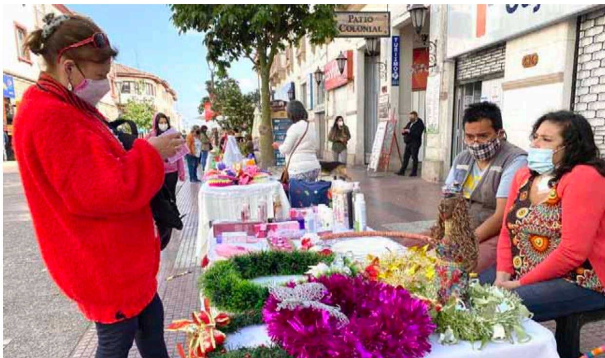
El encuentro comercial navideño se realizará en calle O'Higgins.

Después de que el alcalde Roberto Jacob accediera a la solicitud de los comerciantes ambulantes, diversas fueron las autoridades y líderes gremiales que se opusieron a su decisión. En esta línea, desde la Cámara de Comercio señalaron que la determinación solo traerá perjuicios, además de fomentar "conductas incivilizadas".