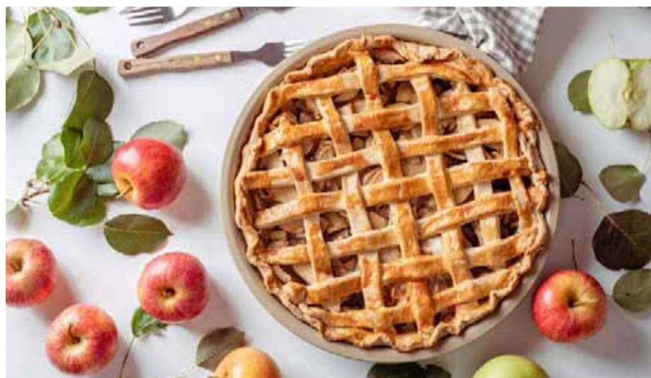
Imagen del famoso “Apple Pie”, tarta de manzana al estilo estadounidense.

Durante estas fiestas, las celebraciones suelen tener lugar en la mesa y, por tanto, la gastronomía es una parte fundamental para los festejos... Sobre todo, si el broche lo pone alguno de los dulces navideños más típicos de distintos rincones del mundo.