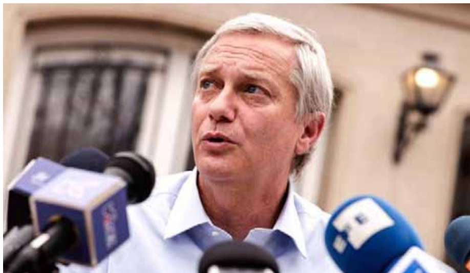
El líder republicano, José Antonio Kast, reconoció el fracaso de su partido en convencer a la ciudadanía que su propuesta de Carta Magna era mejor que la actual.

Expertos sostienen que el escenario político experimentará un cambio y que se debería prestar atención a la ciudadanía, la cual tiene claro su deseo de alcanzar acuerdos para abordar los grandes problemas que enfrenta, en lugar de inclinarse hacia alguno de los extremos como se hizo en los últimos procesos constitucionales.