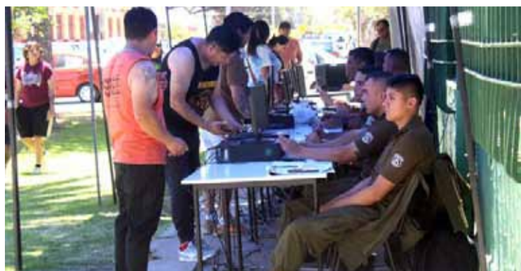
Personas en los módulos de la Tercera Comisaría de Ovalle, excusándose de no votar en el plebiscito constitucional de salida.

hacer más expedita la espera. También se debe a que mucha gente ha regularizado su situación electoral con respecto a las últimas elecciones, en donde hubo una situación de muchas más aglomeraciones. La gente antes no estaba muy familiarizada con la comisaría virtual, que es algo que disminuye bastante los tiempos de las constancias, ahora se ha generado esa cultura, la ciudadanía ya sabe qué hacer y cómo hacerlo", indicó.