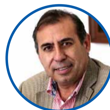
Sergio Gahona SENADOR

“El proceso constitucional va a entrar en un congelador hasta que tengamos otra coyuntura social y política. No hay ningún piso para avanzar hoy día en un tercer proceso constituyente en este gobierno”