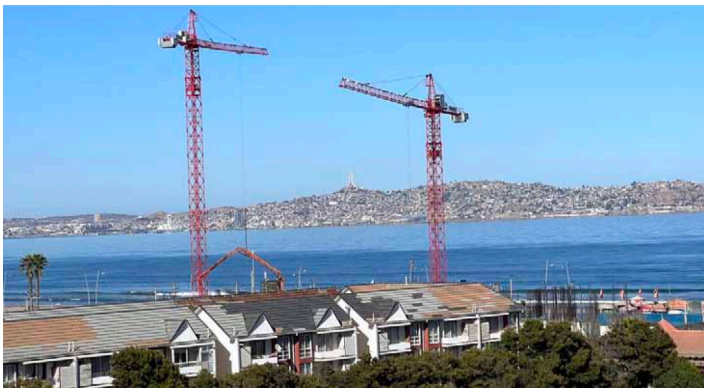
La discusión constitucional afectó fuertemente la confianza en el mercado nacional.

Líderes de los principales sectores concordaron en que el proceso de elaboración de una propuesta de carta fundamental, que se ha extendido prácticamente por cuatro años, significó una pérdida de tiempo, pero, sobre todo, incertidumbre para las pequeñas y medianas empresas, además de incerteza jurídica para la inversión extranjera.