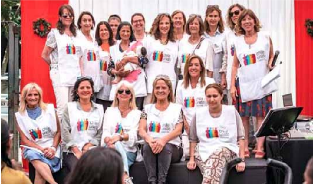
Grupo de Voluntarias del Programa de Acompañamiento, representantes de las más de 80 voluntarias presentes a lo largo del país.