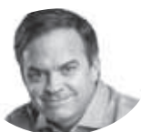
MATÍAS WALKER SENADOR

Por fin estamos cerca de concretar una reforma previsional que permita a futuros pensionados, y también hoy a quienes ya jubilaron, tener un monto de dinero mayor para vivir. Este acuerdo no nació de la noche a la mañana y es deber recordar que se convocó a una mesa de conversaciones hace más de dos años, que se creó una mesa técnica con expertos