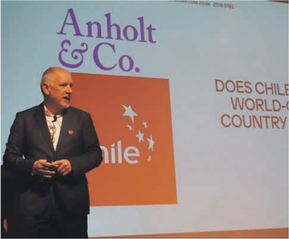
“Chile ha mostrado al mundo cómo funciona la construcción de una marca país” destacó Govers

2024, donde dio un salto respecto a la medición de 2023, pasando del lugar 41 al 38. “El NBI es una medición de 50 países y su desempeño en cuanto a reconocimiento de nombre y reputación. Chile tiene margen de mejora, pero también está dentro de los 10 países con más rápido crecimiento en su reputación”, señaló el experto en place branding. Según Govers, es importante considerar que el posicionamiento de marca es un esfuerzo de largo aliento: “La Fundación Imagen de Chile ha existido durante 15 años y está entre las pocas entidades con un historial tan sólido y claramente exitoso. Construir una marca país