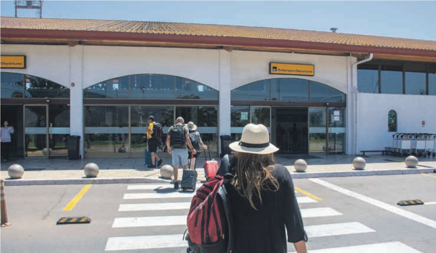
Distintos gremios, autoridades y turistas solicitan que vuelvan a instaurarse los vuelos interregionales en la zona norte.