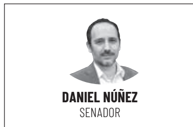
DANIEL NÚÑEZ SENADOR

La pequeña minería es un sector clave en la Región de Coquimbo, no solo por su impacto económico, sino también por su carácter más sustentable frente a los grandes proyectos mineros que muchas veces implican contaminación y uso indiscriminado del agua. Además, en tiempos de sequía, esta actividad representa una alternativa fundamental para quienes buscan reconvertirse y subsistir, tal como lo hicieron sus ancestros, combi-