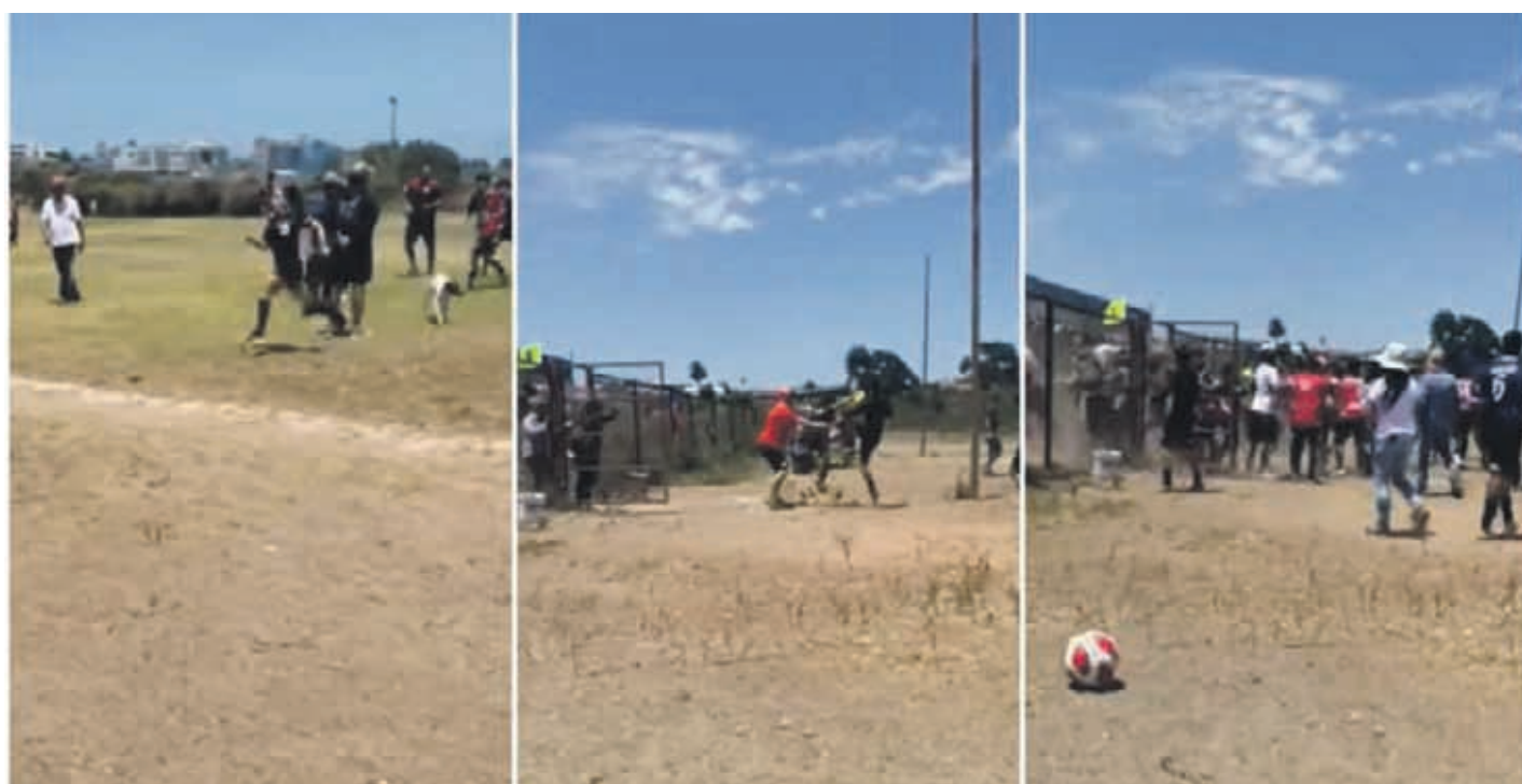
Las capturas de imágenes de un video que ha recorrido el mundo, mostrando la cobarde persecución y agresión que sufrió la árbitra en el partido de fútbol infantil.

Según el testimonio de los presentes, que repudiaron categóricamente