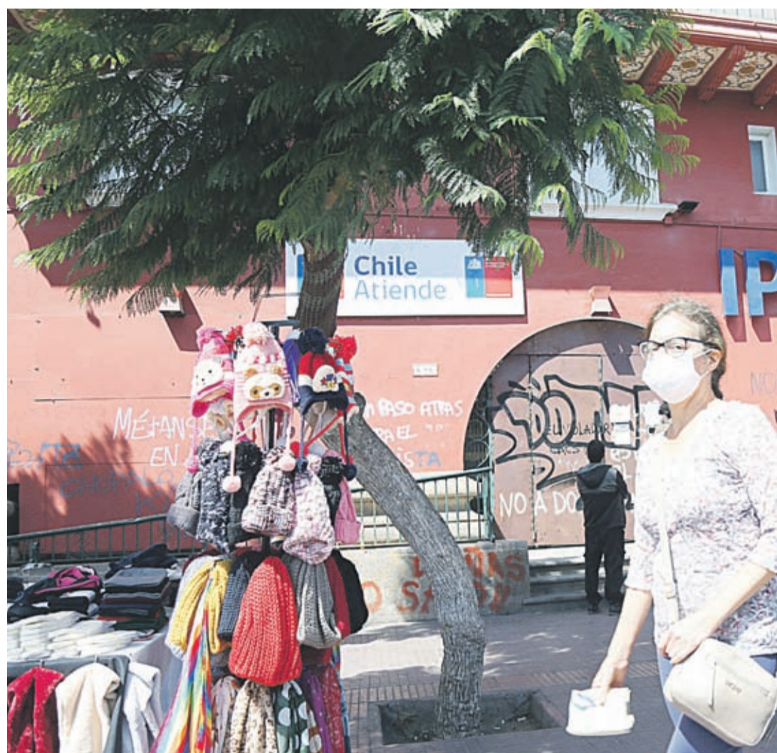
Las dos personas confirmadas con Covid-19 en la región son funcionarias del Instituto de Previsión Social de La Serena, según protocolos todos los trabajadores del IPS deberían quedar en aislamiento. Desde el Minsal señalaron que estaban realizando la investigación y seguimiento epidemiológico.

Respecto a la sugerencia que entregó la profesional de que en la región se adquiriera un test para analizar las muestras indicó que “entiendo que no lo van a adquirir, pero se están haciendo gestiones para que pueda realizarse el examen en el laboratorio de la universidad, aunque si ello