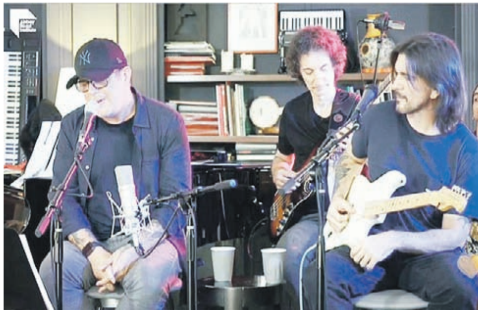
El 15 de marzo Alejandro Sanz y Juanes interpretaron "Burbujas de amor" de Juan Luis Guerra en un inédito show por YouTube.

Asimismo, desde el Teatro Melico Salazar de Costa Rica, Jorge Drexler brindó un show por redes sociales para miles de personas. El músico compuso una canción sobre el coronavirus que se volvió rápidamente viral, que comienza diciendo "ya volverán los abrazos,