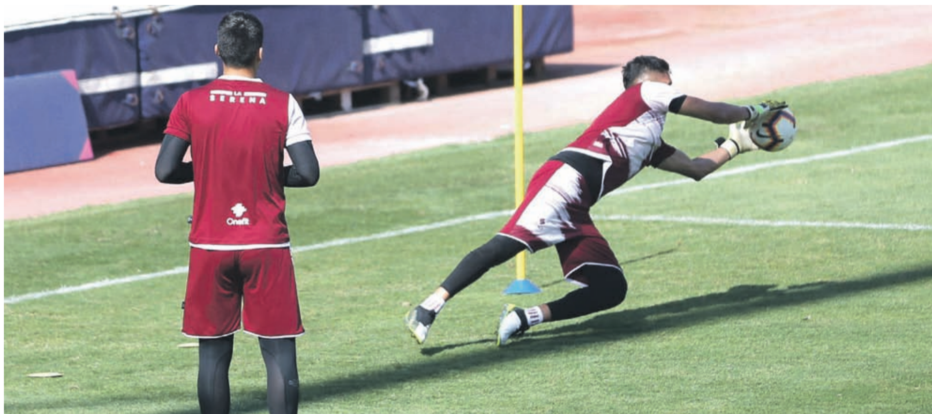
CD La Serena disputó el encuentro con Everton en Viña del Mar y el lunes inició el sistema de entrenamiento dirigido. La plantilla se dirigió a sus hogares.