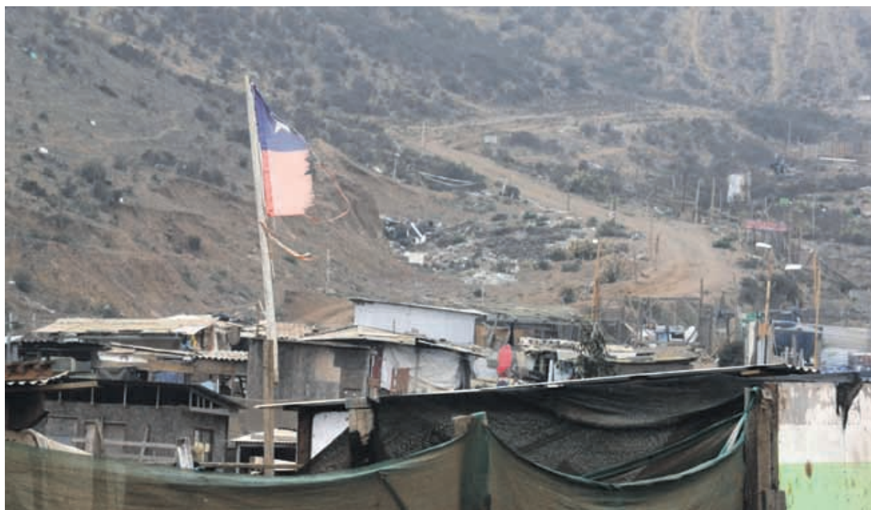
La bandera chilena rota parece simbolizar la precariedad en la que viven algunas de las familias.