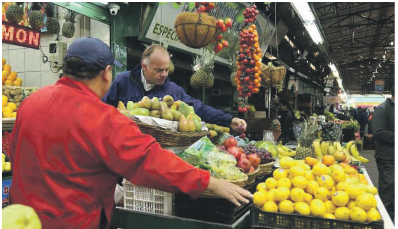
Permite consultar los precios de más de 50 productos agrícolas que se venden en los mercados mayoristas.

Se trata de “¿A cuánto?”, tecnología que es una alternativa para cotizar e informarse de los precios de frutas y verduras a lo