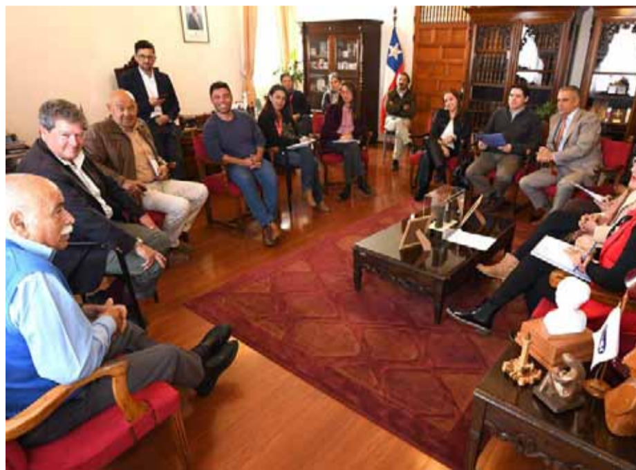
Los representantes de los colegios del sector de San Ramón se reunieron con las autoridades del municipio de La Serena para plantear sus problemáticas.

Durante una reunión entre los representantes de los establecimientos educacionales ubicados en el lugar y el municipio de La Serena, se acordó ésta y otras medidas para mitigar el colapso vehicular en el sector, como barreras New Jersey, instalación de vallas peatonales y presencia de inspectores municipales.