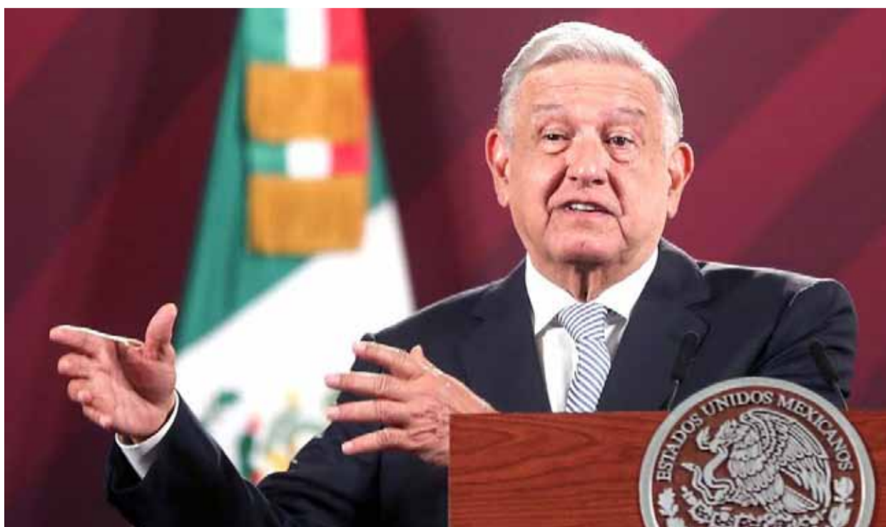
El Presidente Andrés Manuel López Obrador afirmó que Estados Unidos también debiera atender a las causas que están generando el consumo de drogas al interior de ese país.

Por ello, dijo, "no hay nada más que estar viendo lo que sucede en