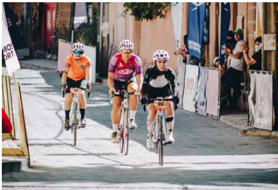
Se esperan cerca de 250 pedaleros para la prueba de este domingo en la Ruta 41.

Pero sin duda que esta tercera versión, no deja de llamar la atención, por el hecho de llevar el ciclismo ruta, a localidad tan apartadas de los centros