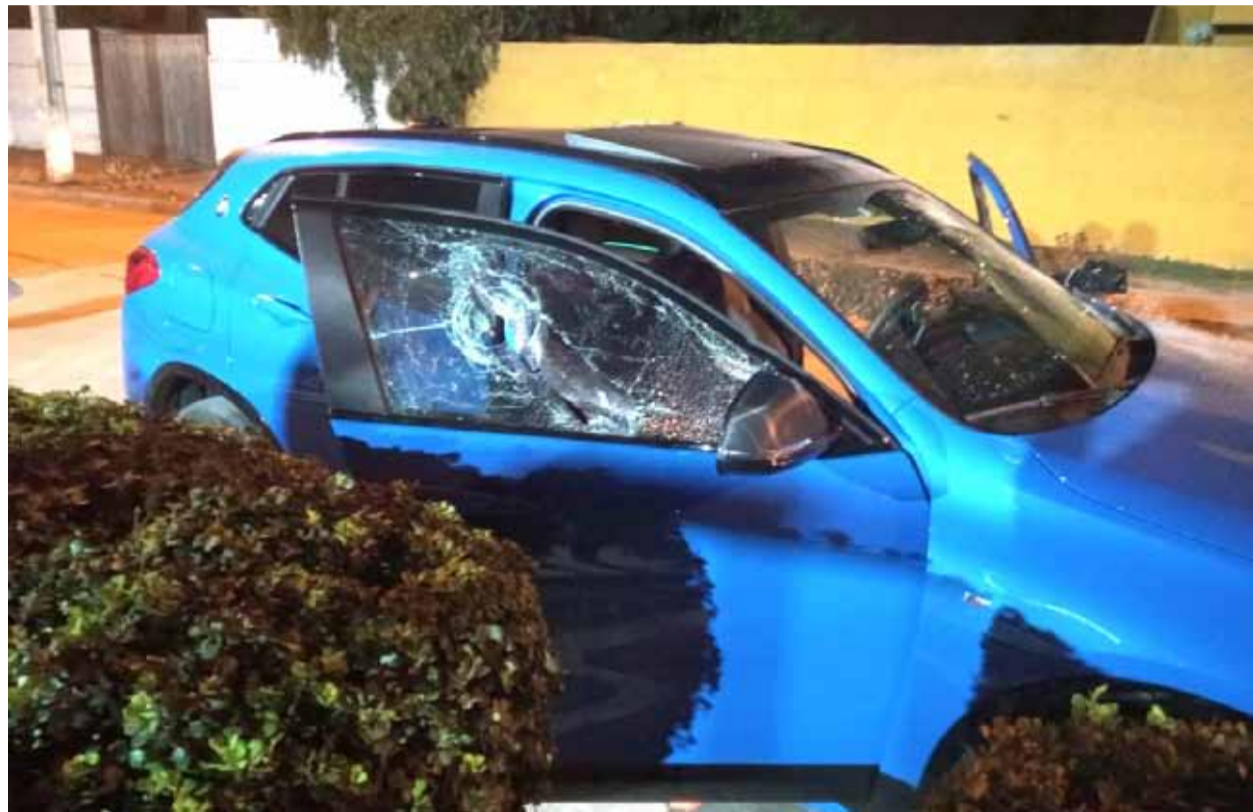
Registro aportado por testigos que grafican las condiciones en que terminó el vehículo de la víctima.

“Sentí un ruido de choque, me asomo y veo un auto atrás que chocó al