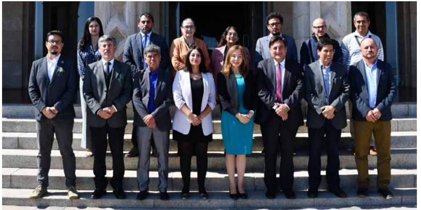
Autoridades políticas, de la Municipalidad de Canela, y de la propia universidad, valoraron la firma del convenio por constituir una oportunidad de impulsar proyectos y actividades entre ambas instituciones.