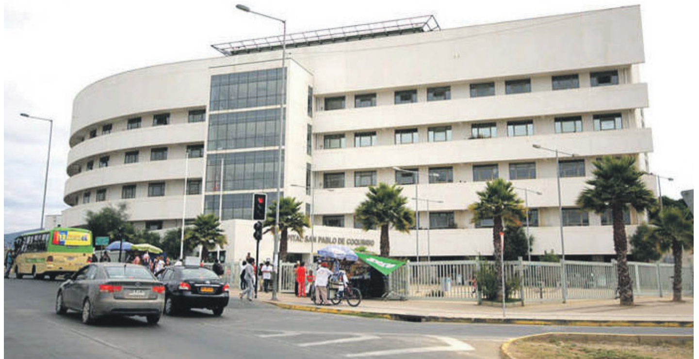
La información circuló durante la semana pasada entre algunos de los trabajadores del hospital, quienes temen un eventual colapso del centro asistencial dentro de los próximos días. EL DÍA

Según los datos manejados, incluso ha existido un aumento de hasta un 20,3% de consultas de especialidades integrales en comparación al año pasado, es decir que todas las inter-