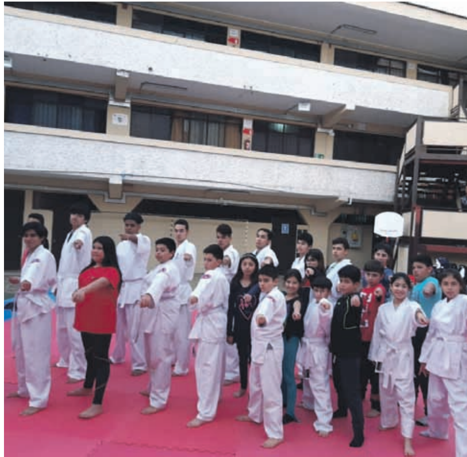
Los jóvenes que forman parte de la academia y el dojo O'Higgins, en el tradicional recinto educacional del puerto.

De la mañana se da inicio con la ceremonia de inauguración, donde con autoridades confirmadas darán el vamos al torneo.