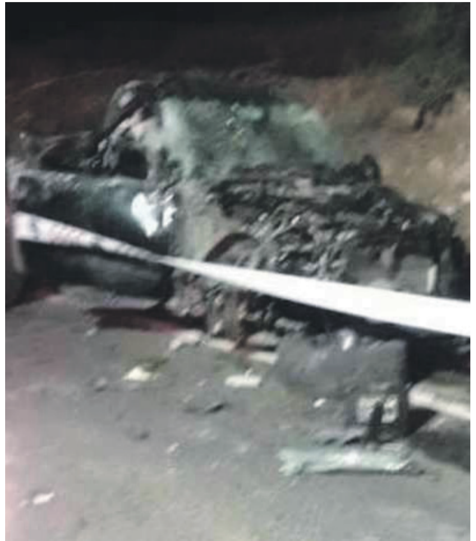
Al lugar llegó personal de bomberos, Samu y la Sección de Investigación de Accidentes del Tránsito (SIAT)

Al lugar llegó personal de bomberos, Samu y la Sección de Investigación de Accidentes del Tránsito (SIAT), quien deberá esclarecer las causas del lamentable hecho.