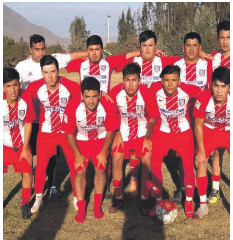
Gabriela Mistral buscará volver a gritar campeón en categoría Honor.