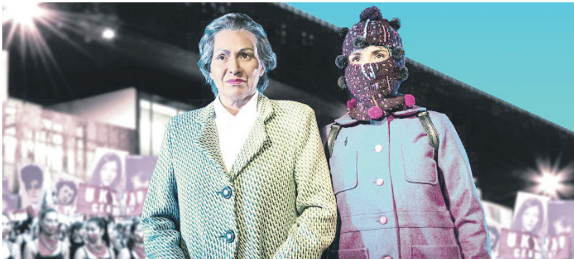
El objetivo de la ficción es explorar las facetas, contradicciones y profundidades de la Premio Nobel.