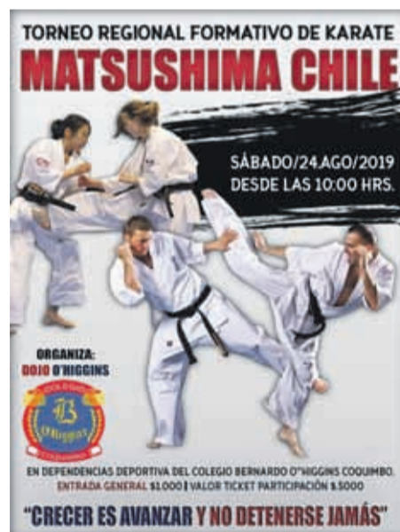
El afiche oficial de la competencia, a llevarse a cabo este próximo sábado.