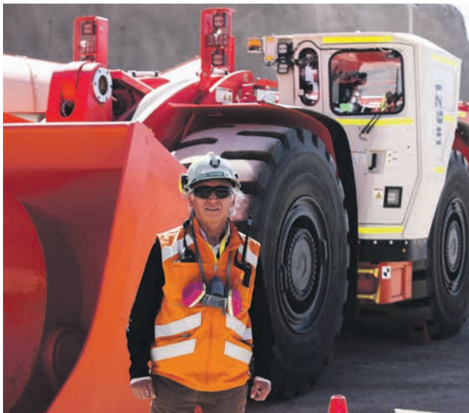
Una imagen de la nueva mina subterránea de Chuquicamata.

La excesiva dependencia del cobre es peligrosa para las finanzas chilenas -el metal cotiza en los mercados internacionales- y las autoridades insisten desde hace años en la necesidad de diversificar la matriz productiva, pero no resulta fácil despojarse de la