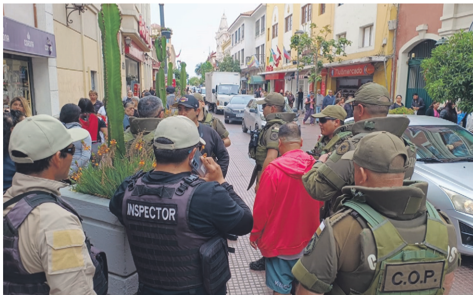
La acción conjunta de carabineros y los inspectores municipales permitió frustrar el comercio ilegal en el centro serenense.

La intervención conjunta llevada a cabo por los inspectores municipales y funcionarios de la Tercera Comisaría COP de la policía uniformada permitió, durante este miércoles, decomisar mercadería ilícita a un grupo de vendedores ilegales a quienes también se les cursó una serie de infracciones.