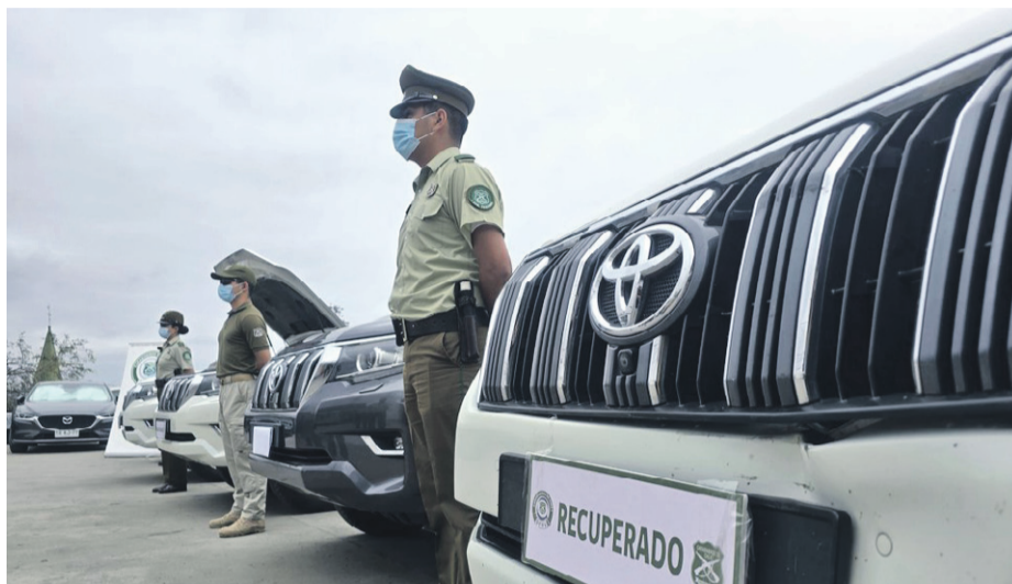
La acción de Carabineros permitió detener in fraganti a los delincuentes y recuperar los vehículos robados.

con el objetivo de cruzar y venderlos en Bolivia”, indicó el teniente coronel José Ramírez, de la Prefectura de Carabineros Coquimbo.