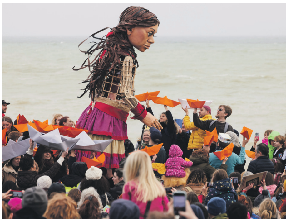
La actividad es presentada por Teatro a Mil junto a Teck Carmen de Andacollo, con la colaboración de la municipalidad.

del mundo. Incluso ha sido recibida por el Papa, y en cada territorio le dan una bienvenida de diferentes maneras, desde música, baile, conversar, sentarse a tomar té, en fin, y aquí se está haciendo un trabajo artístico", detalló.