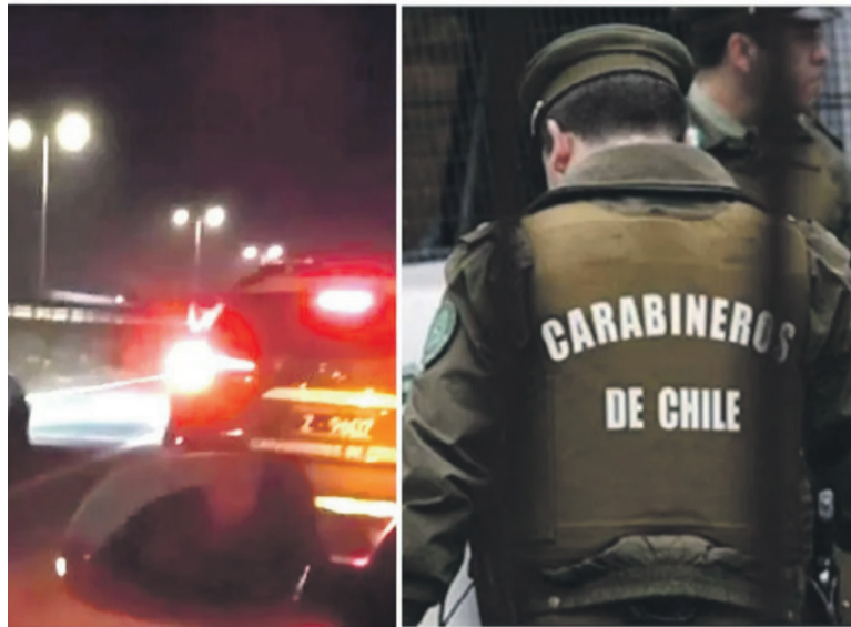
Fue a inicios de noviembre cuando se hizo viral un video en donde aparece una patrulla de Carabineros participando en una carrera clandestina.

La Fiscalía imputó cargos a dos exuniformados quienes habrían participado en una carrera ilegal en la vía pública y cuyo video se hizo viral a principios del mes de noviembre.