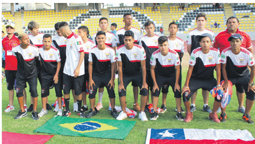
BENFICA-Sao Paulo. BRASIL.