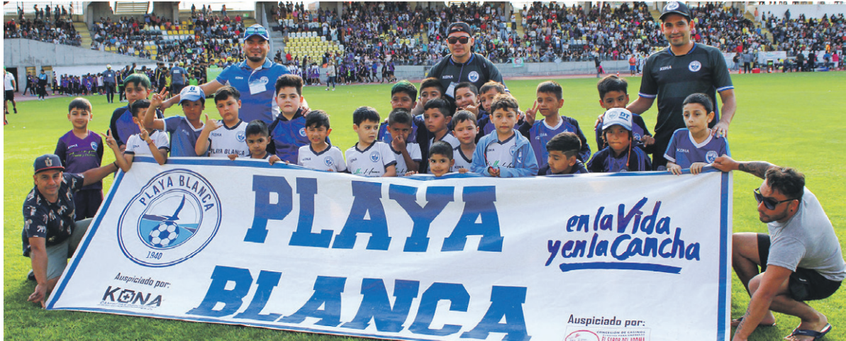
PLAYA BLANCA de ANTOFAGASTA.