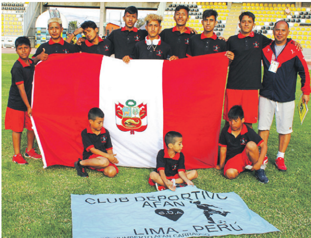
Club Deportivo AFAN - Lima- PERU.