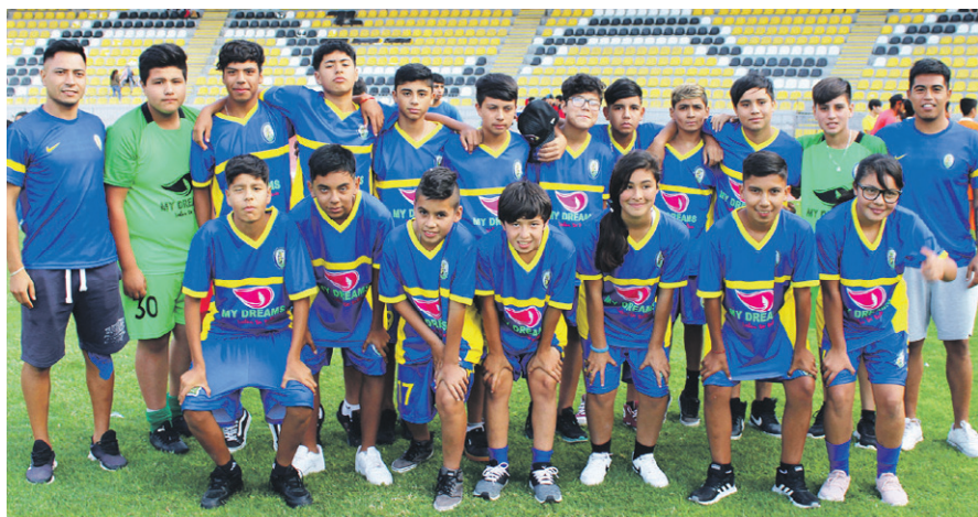
Escuela MUNICIPAL de OVALLE.