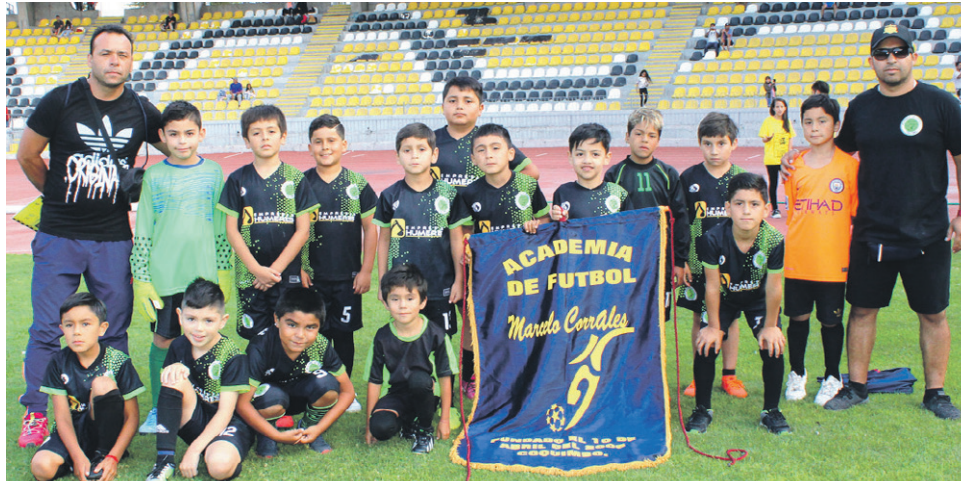
Escuela de Fútbol MARCELO CORRALES-COQUIMBO.