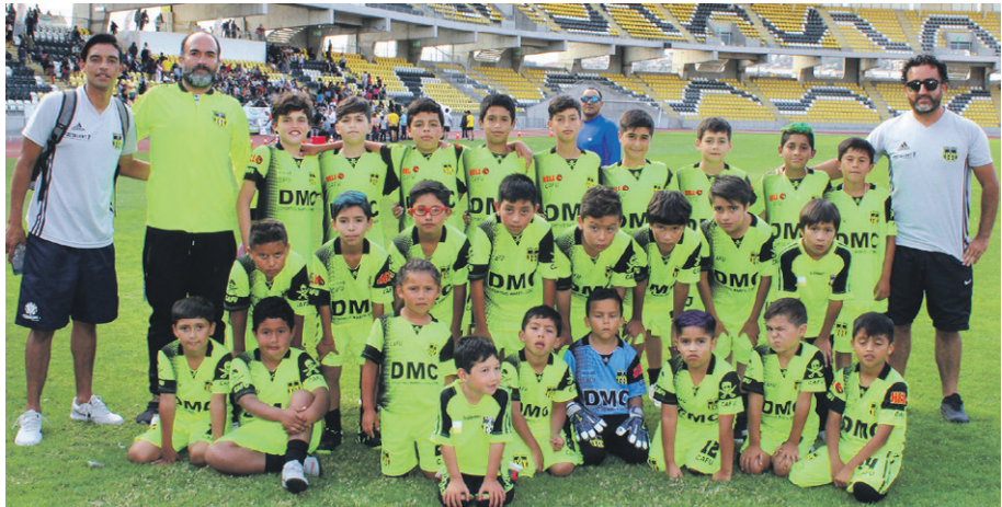
Escuela de Fútbol DEPORTIVO MARFIL -Coquimbo.