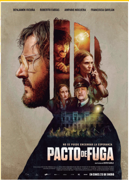
138 min. / +14 / Thriller

Tenemos una invitación doble reservada para ti.