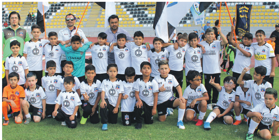
Escuela de Fútbol COLO COLO de COQUIMBO.