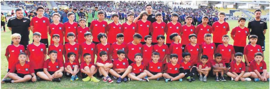
Escuela de Fútbol HUACHIPATO de PUERTO MONTT.