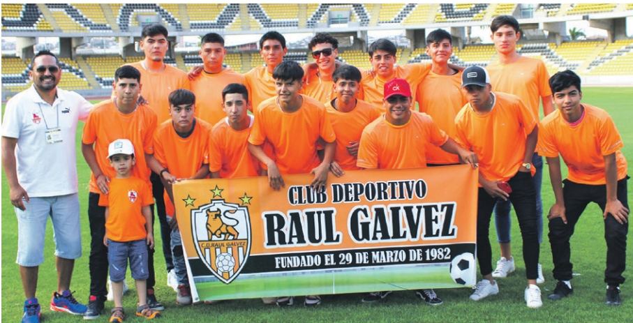
Deportivo RAÚL GALVEZ de Tierras Blancas.