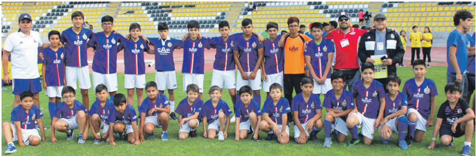
Escuela de Fútbol CAP MINERIA -La Serena.