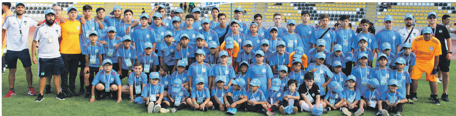
Escuela de Fútbol O'HIGGINS de GRANEROS.