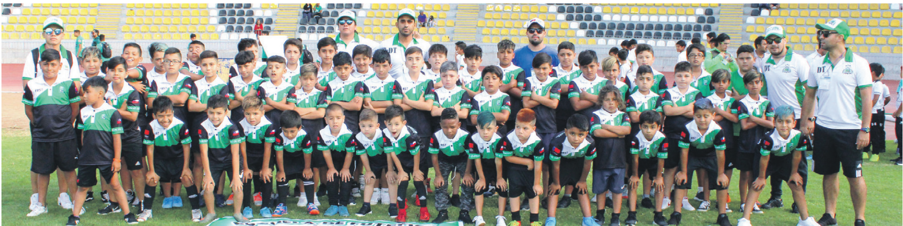
Escuela SUEÑO de GUERRERO de ANTOFAGASTA.