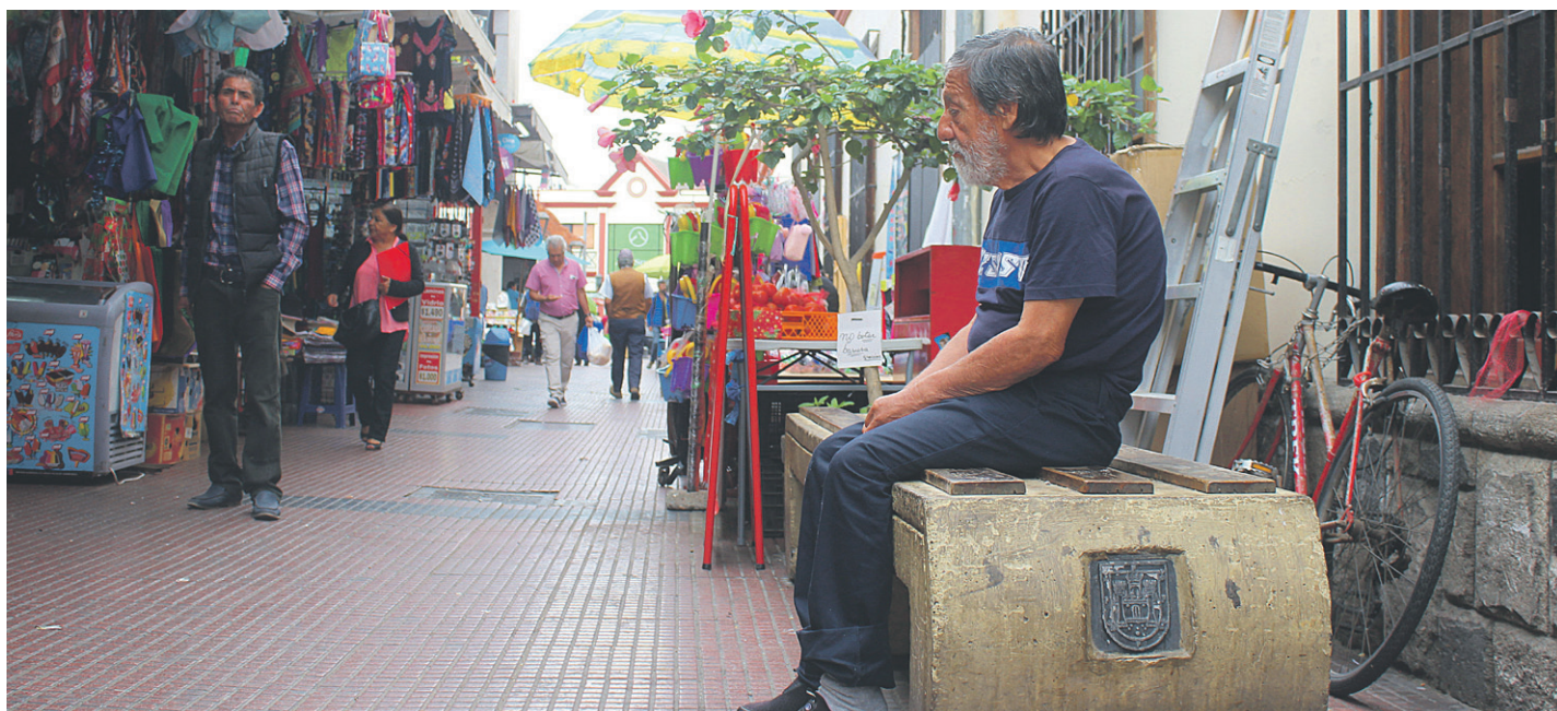
Pasa la mayor parte del tiempo sentado, esperando algo, no sabe muy bien qué. Sus “madrinas” de La Recova lo llaman tres veces al día para darle de comer.