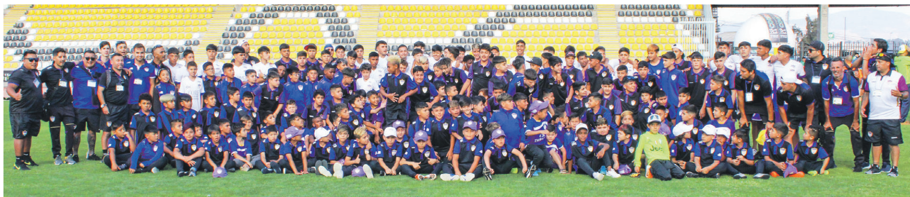
Escuela de Fútbol IMPACTO de ANTOFAGASTA.