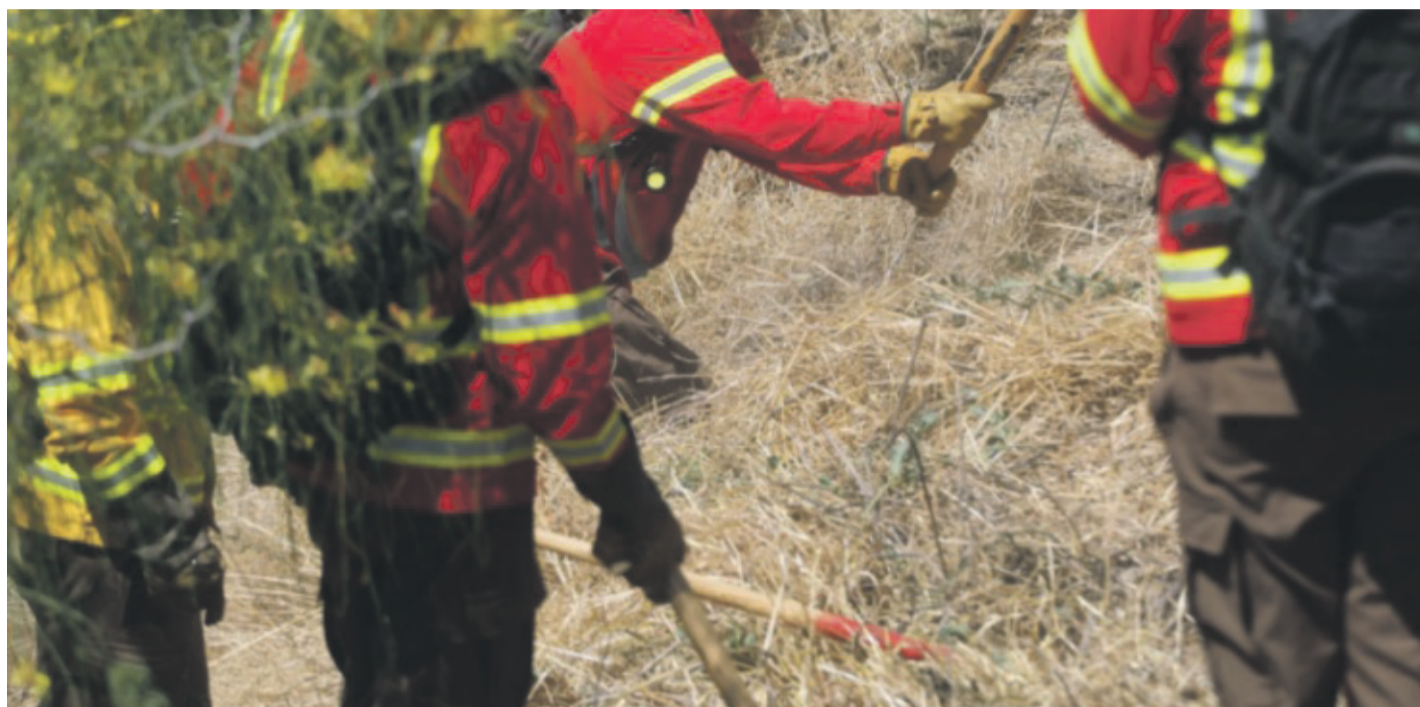
Los fallecidos son miembros de las brigadas de la empresa privada CMPC que combatían un incendio en la comuna de Los Sauces ubicada en la provincia de Malleco.

En concreto, el Servicio Nacional de Prevención y Respuesta ante Desastres