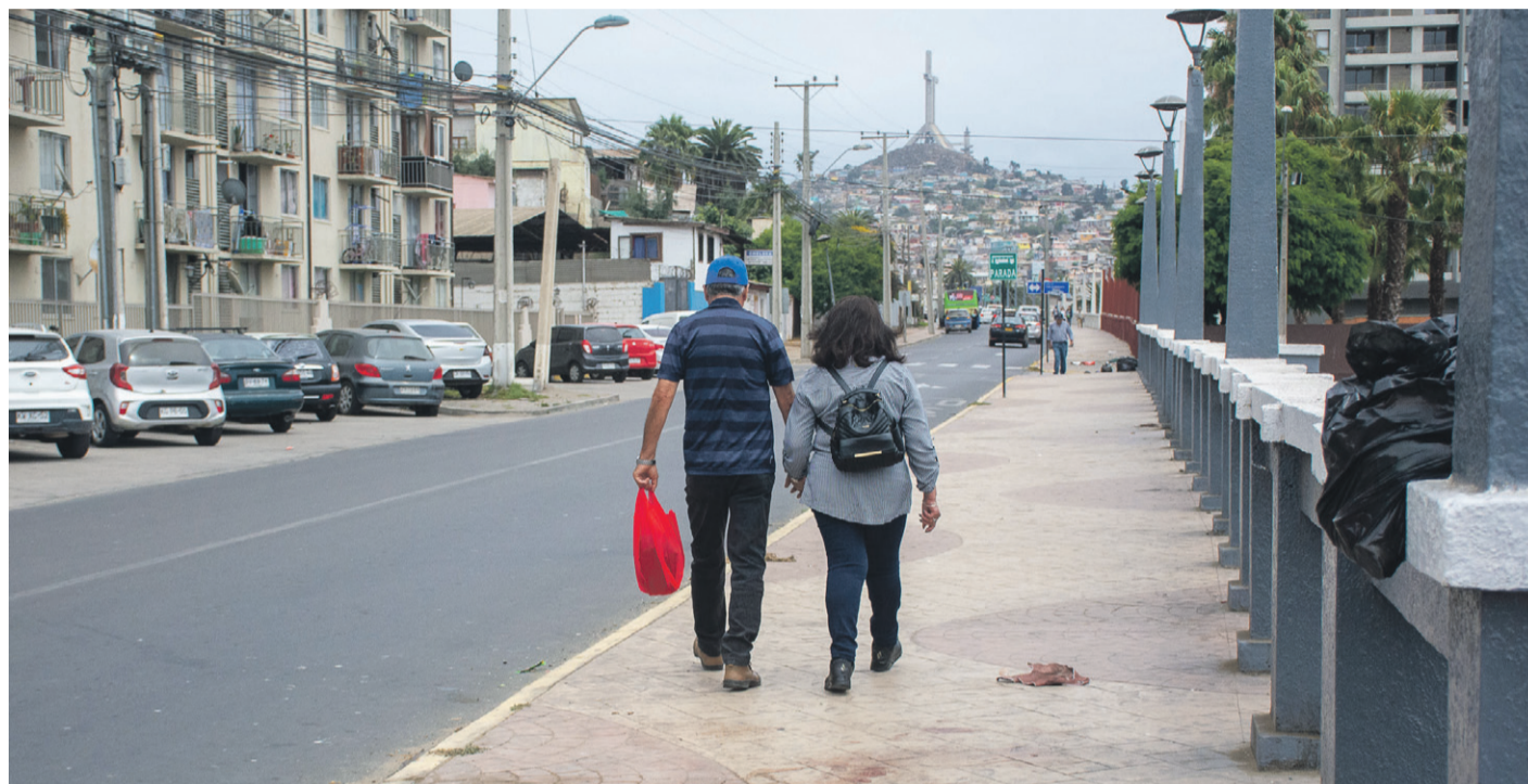
En la calle Juan Antonio Ríos de Coquimbo, ocurrió el primer homicidio del año 2025 en la región.