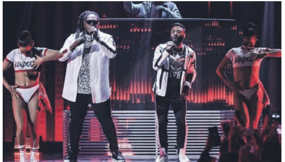
La idea de traer a estos grandes artistas es colocar con ellos el broche de oro al verano

¿CUÁNDO? Sábado 23 de febrero ¿DÓNDE? Espacio Peñuelas ¿HORA? Desde las 21:00 horas. SHOW EN VIVO: Zion & Lennox / Tommy Boysen DJ SET: Mauro Boss & Matías Vega STAGE ELECTRÓNICO: Elio Riso / Cris Ocaña / Fabián Argomedo PREVENTAS • Early Bird: $15.000 • Preventa General: $18.000 • Preventa VIP: $30.000 Compra tus entradas en www.passline.cl