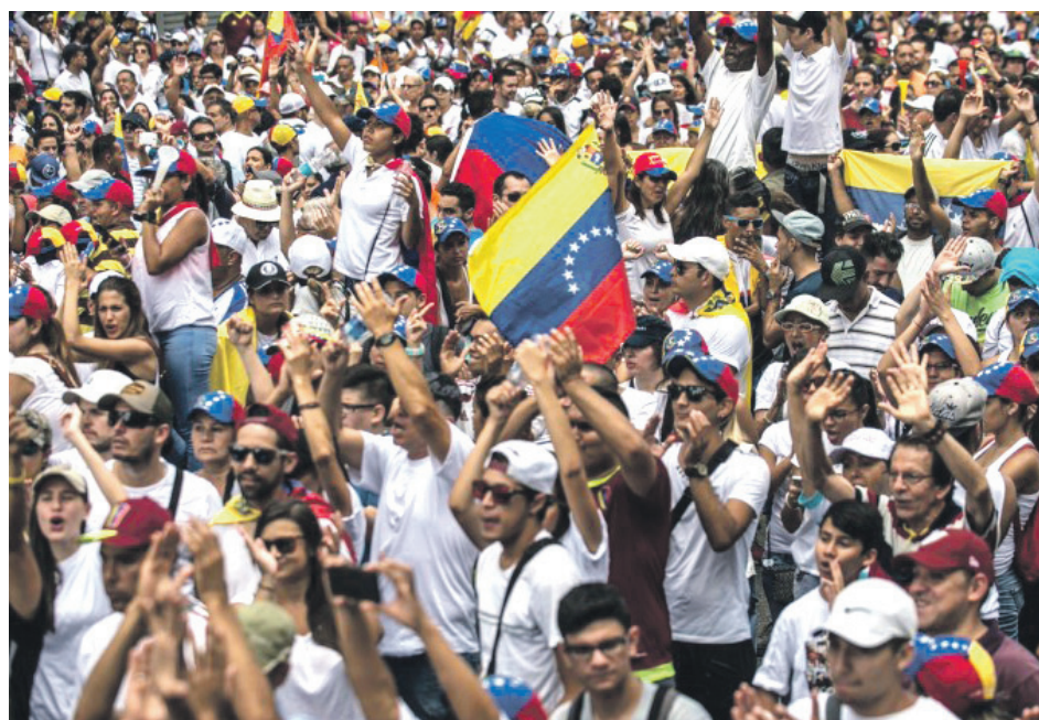
La comunidad venezolana alzó su voz y entregó un claro mensaje al Gobierno de Chile.

Asimismo, pidieron a Piñera que "se lleve a cabo una investigación exhaustiva" conforme a la legislación chilena "sobre la posible presencia de capital del Estado venezolano en cuentas bancarias en territorio chileno".