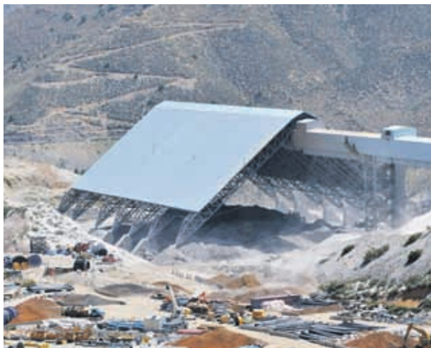
En el crecimiento del sector minero influyó una mayor producción de cobre explicada por una mejor ley del mineral, y en menor medida por la producción de hierro.

cio, restaurantes y hoteles, trimestre del año anterior, registró crecimiento en su actividad respecto al mismo trimestre, explicado por un mayor dinamismo en comercio,