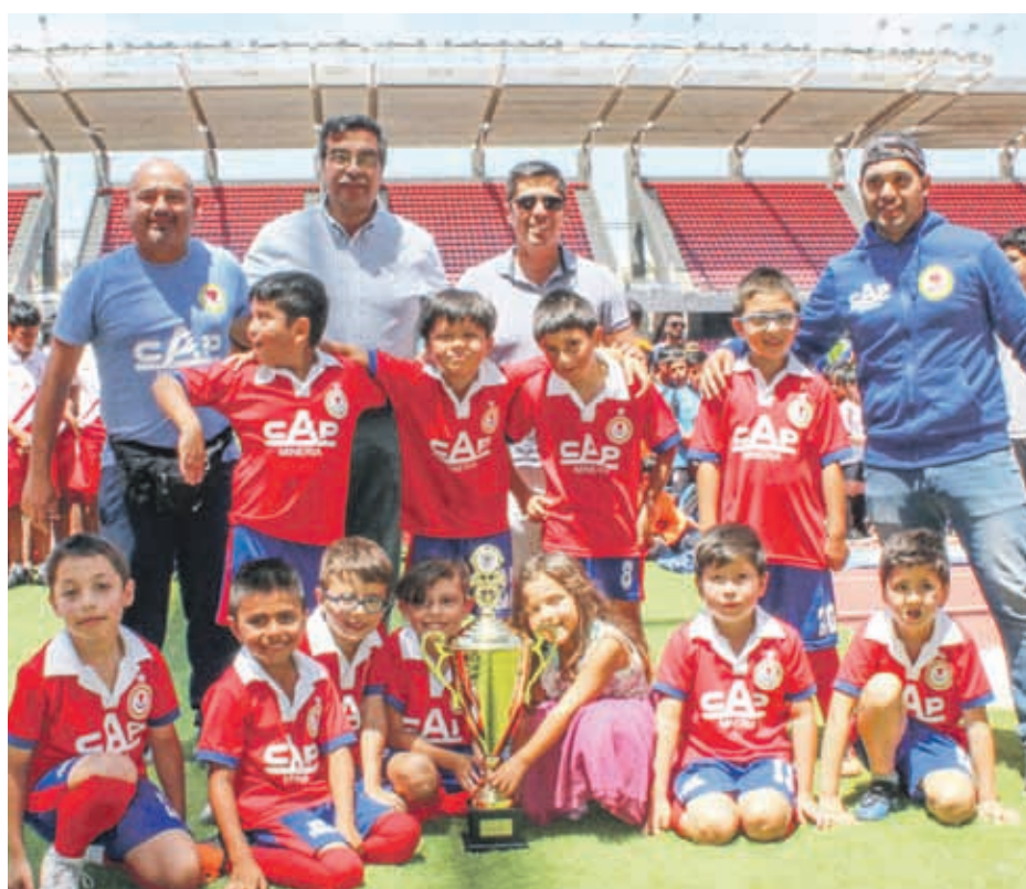
TERCER LUGAR - Categoría 2011, Escuela de Fútbol CAP MINERIA, en 29 versión campeonato CUP SERENA 2019

La mayoría de los jóvenes deportistas que integran escuelas, academias y/o clubes deportivos, en ramas de fútbol, luego de un pasado año 2018 de intensas jornadas por puntos en los fines de semana y entrenamientos por las tardes de la semana; más tarde someterse a trabajos de preparación para los torneos internacionales que se programan y realizan en la zona en los meses de verano, merecen un necesario y merecido descanso, de relajamiento, recuperación de fuerzas para retornar en las primeras semanas de marzo a la preparación de pre-temporada que los capacite para resistir la competencia anual que se inicia los primeros días de Abril. Otros, vienen regresando de localidades y países a los cuales concurrieron a eventos internacionales.