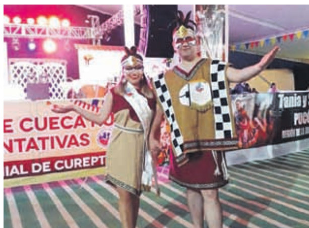
Con sus trajes de la cultura diaguita la pareja quedó en segundo lugar en danzas representativas

que duró este campeonato, el público pudo disfrutar de la competencia con representantes de sus respectivas