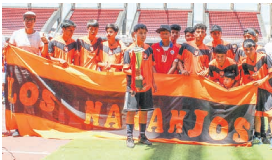
LOS NARANJOS - Coquimbo, logró el tercer lugar en LA SERENA CUP 2019, Categoría 2003