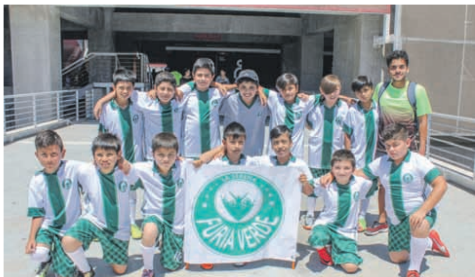
Emergente Escuela de Fútbol, FURIA VERDE, mostró su trabajo, debutando en torneos internacionales en La Serena