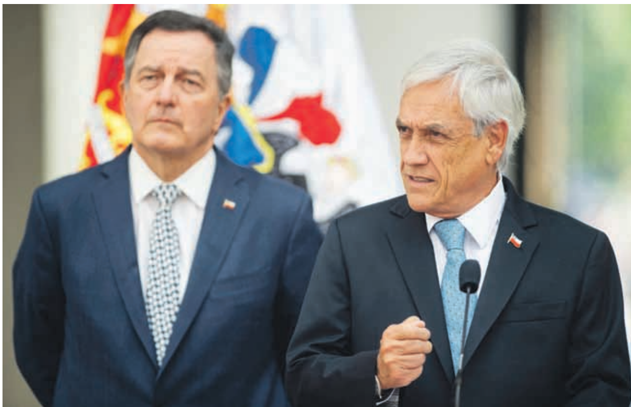
El mandatario se dirigirá este viernes a la ciudad colombiana de Cúcuta, ubicada en la frontera de Venezuela, donde entregará ayuda humanitaria junto al mandatario cafetero, Iván Duque.

“Queremos mostrar fuerte y claro el apoyo de casi toda América Latina y también el apoyo de grandes países como lo son los europeos, Estados Unidos, Canadá, a una solución