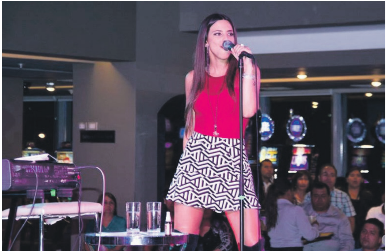
La ex participante del programa de televisión Rojo tiene a su haber un triple disco de oro y doble disco de platino en ventas por su primer álbum: "Daniela Castillo".

cantante Daniela Castillo. Estos espectáculos serán a partir de las 23:00 horas y podrán ser disfrutados, gratuitamente, por todo el público que esté al interior de la sala de juegos del casino. La cita del viernes tendrá lo mejor de la música nacional, con canciones que marcaron hitos en diferentes épocas de la escena chilena. Se trata de aquellos hits, principalmente de los años 80 y 90, que hicieron historia rotando una y otra vez en las radios FM, y que muchos adultos jóvenes disfrutaron en formato de cassette o disco compacto. Todo continuará el sábado