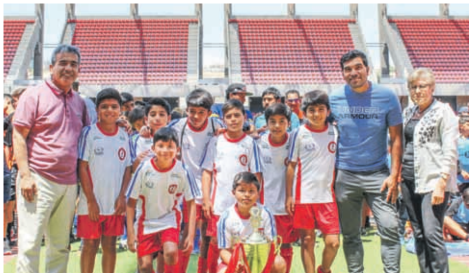
Academia SANTA INÉS, Categoría 2008, Terceros en torneo CUP LA SERENA 2019