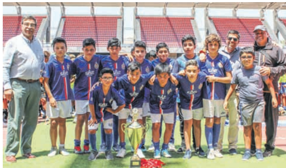
Categoría 2007, Escuela de Fútbol CAP MINERÍA, Tercer lugar, torneo CUP LA SERENA 2019