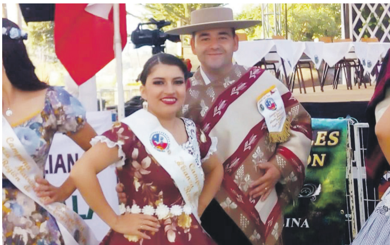
El funcionario de Carabineros y su esposa se quedaron con el primer lugar en la categoría Alianza Matrimonial

TRES NOCHES DE FIESTA Durante las tres noches