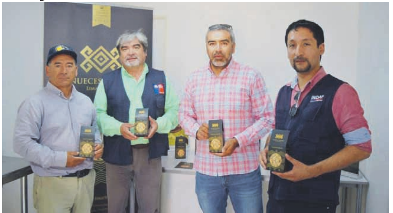
La principal variedad que comercializan es Serr, seguida de la Chandler, ambas bajo estándares de calidad premium.

Como una manera de resaltar las características de