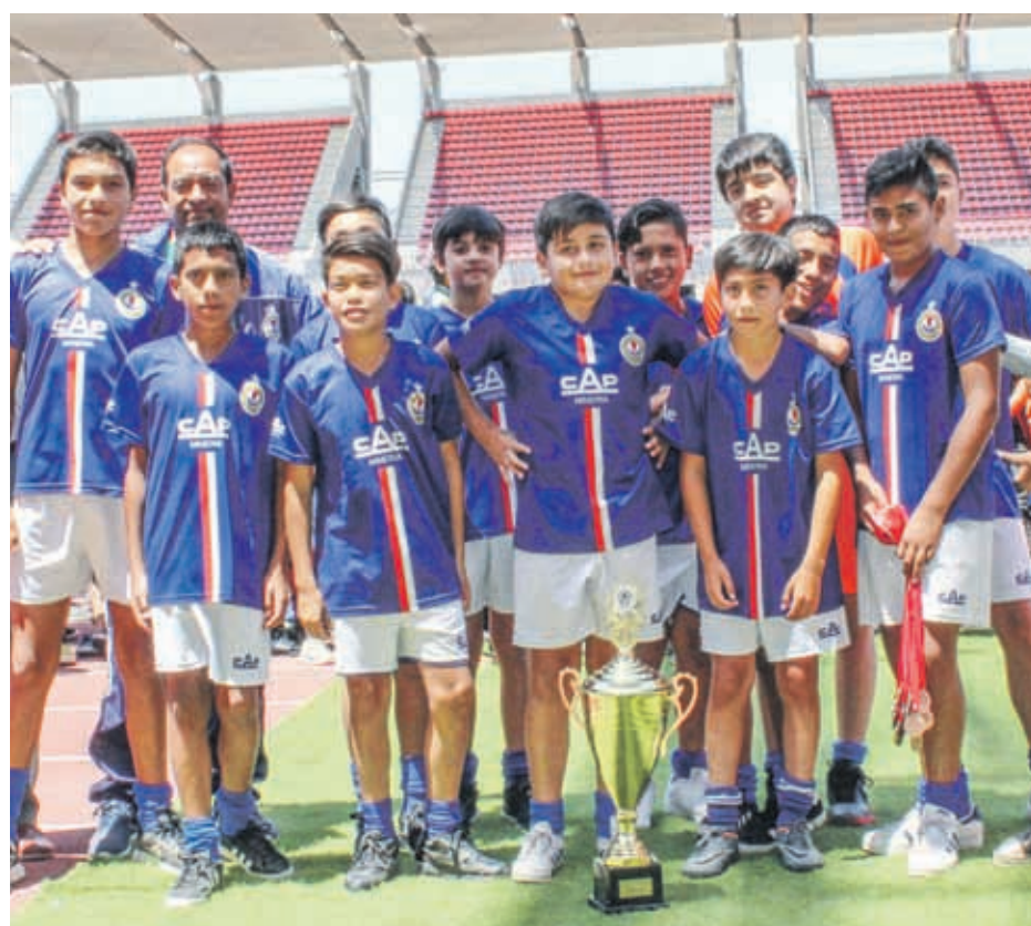
TERCER LUGAR-- Categoría 2006, Escuela de Fútbol CAP MINERIA, en CUP LA SERENA 2019