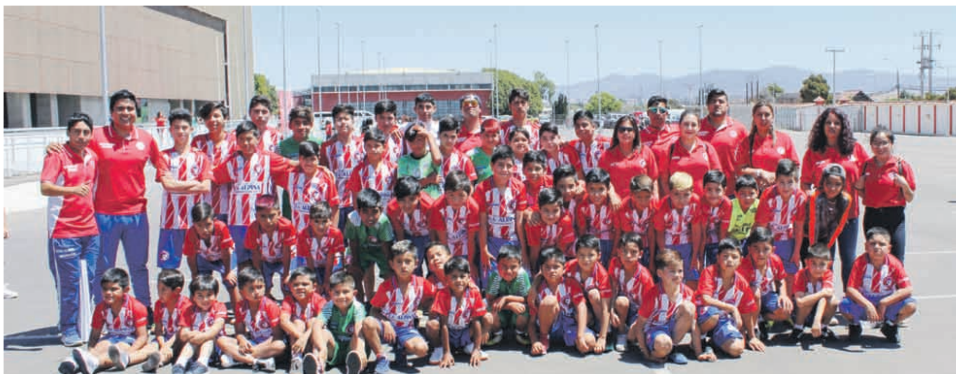
Escuela de Fútbol LAS COMPAÑÍAS, consolidándose en torneos anuales en Las Cías y en Torneo Internacionales