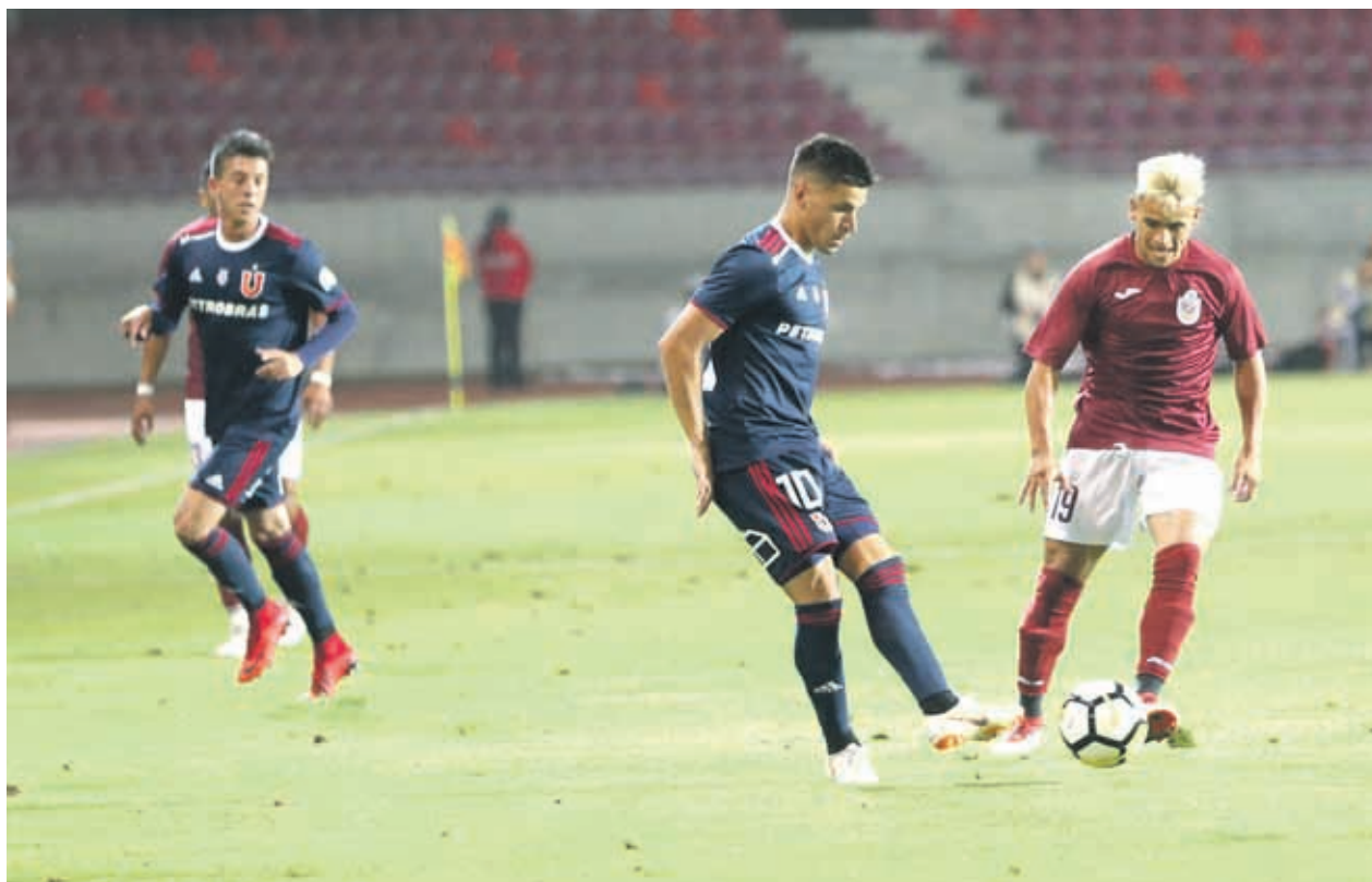
El argentino Bayk es diferente y eso quiere el técnico que lo ponga a disposición del equipo.

Cualquier análisis o crítica ácida como sucede en especial en las redes sociales con algunos jugadores, parece desproporcionada en estos momentos, aunque es una clara señal que el peso que llevarán sobre sus hombros los futbolistas, no será menor. La hinchada reclama el éxito y no quieren excusas.