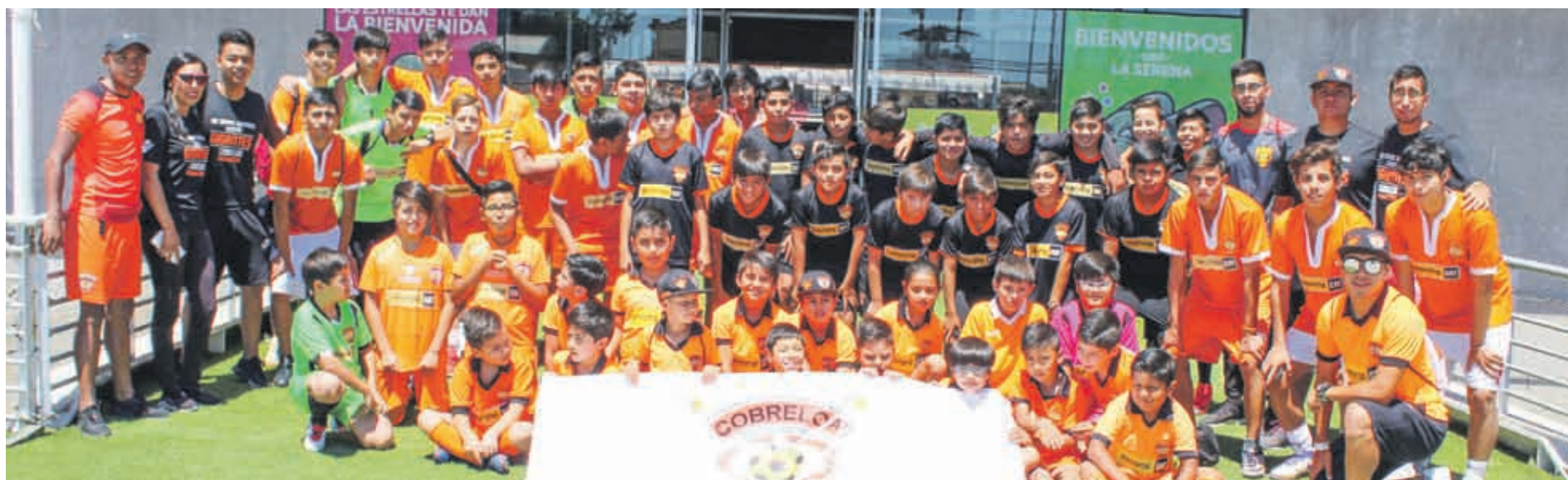
Escuela de Fútbol COBRELOA - Filial La Serena, mostró su consolidación en los pasados torneos internacionales desarrollados en La Serena