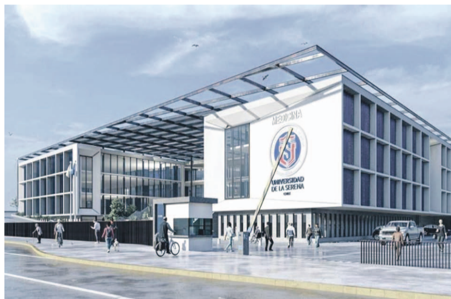
El BID ha dispuesto un préstamo de 90 millones de dólares a la Subdere para financiar proyectos en cinco regiones del país que están construyendo su estructura metropolitana.

Coquimbo: "Buscamos avanzar en modelos de gobernanza que permitan atraer inversión pública y privada para fortalecer el desarrollo territorial. Hemos priorizado la mejora de la Avenida Francisco de Aguirre y la construcción de la Escuela de Medicina de la Universidad de La Serena, pero también abordamos la necesidad de un centro de tratamiento integral de residuos, el fortalecimiento del borde costero y la recuperación de rutas de evacuación".