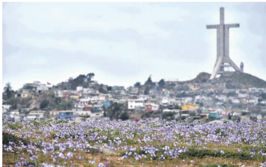
Coquimbo es una de las comunas que presenta mejor calidad del aire en el país.

De acuerdo a la Norma primaria de calidad del aire para MP2,5, se considera como una excedencia cuando el promedio de la concentración anual