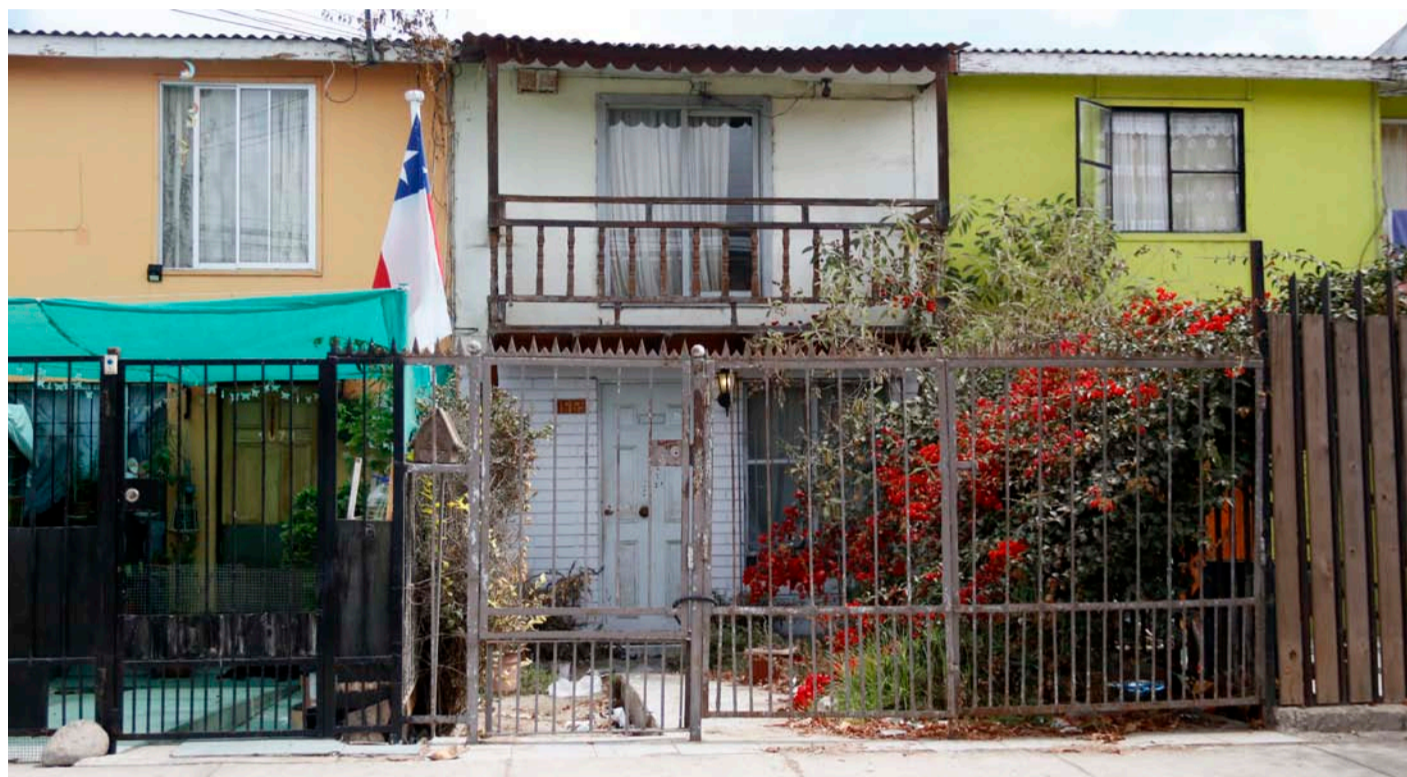
El hombre de 64 años fue encontrado muerto, al interior de su vivienda en Avenida Alessandri en Coquimbo.