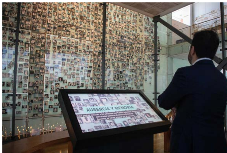
En la imagen el presidente de Cataluña recorre el Museo de la Memoria y los DD.HH.

“Estamos recuperando la presencia exterior de Cataluña después de unos años en los que, también por las presiones del Gobierno español, nos ha sido súper difícil hacer acción exterior, pero hoy más que nunca Cataluña está presente como un agente que decide por sí mismo en la escena internacional”, subrayó.