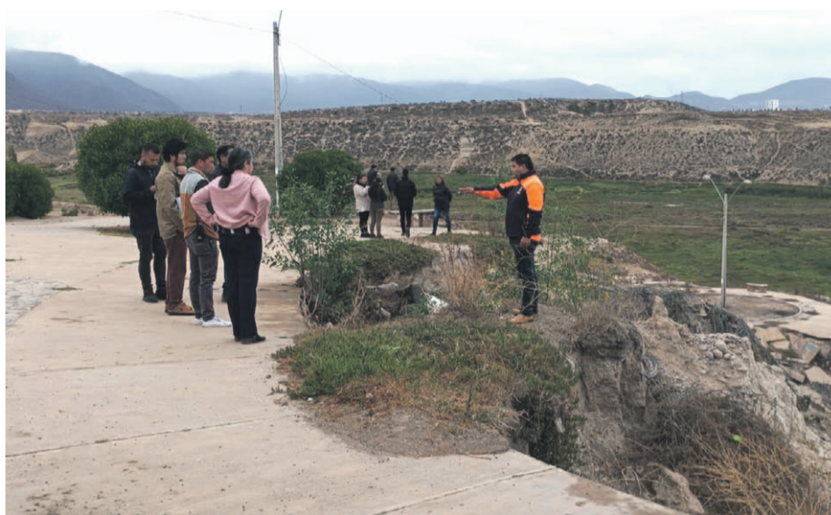
Desde el municipio de Coquimbo se comprometieron a una intervención mayor con maquinaria pesada, buscando entregar una mejor seguridad hacia la comunidad.

Presentes en terreno, los equipos municipales comenzarán a intervenir esta zona, con retiro de mobiliario urbano y estabilización del suelo con maquinaria pesada. Esto, mientras se trabaja en medidas de mediano plazo, con la construcción de un canal y a largo plazo con la reconstrucción del sumidero de aguas lluvias.