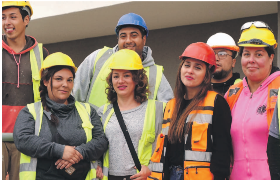
La instancia convocó a más de 80 colaboradores de las obras EcoTown y Ecobarrio de la empresa socia Inmobiliaria Ecovista, quienes compartieron una simbólica jornada.

Orgullo, compromiso, esfuerzo y dedicación fueron solo algunos de los atributos que se destacaron en el hito de conmemoración del Día del Trabajador y Trabajadora de la Construcción, realizado por el gremio constructor, reconocimiento que se llevó a cabo en nuestra región y a lo largo de todo el país.