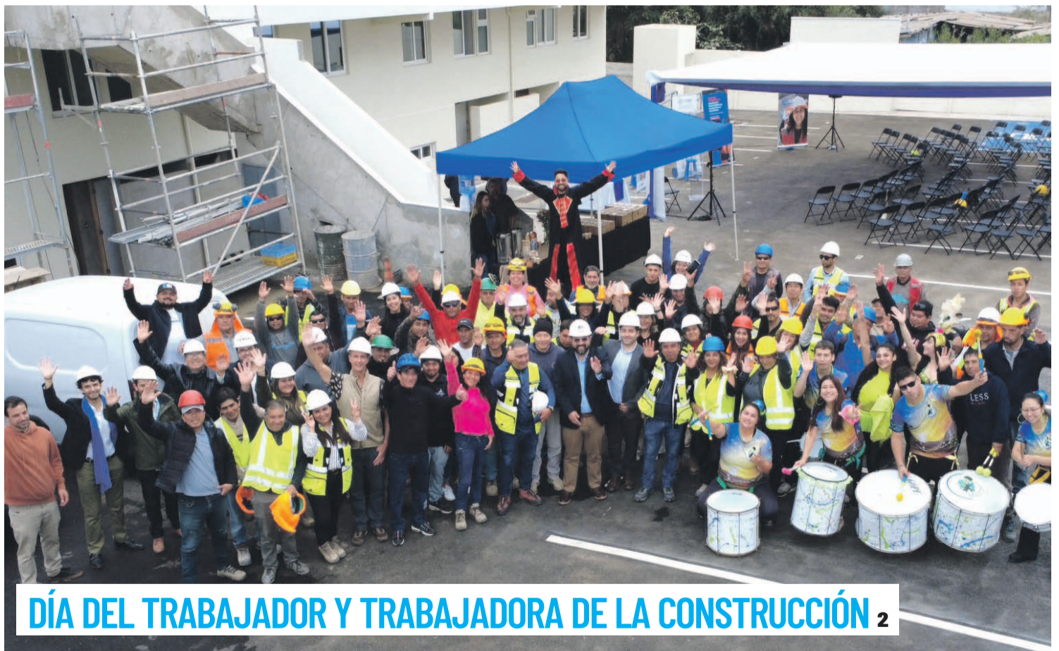
DÍA DEL TRABAJADOR Y TRABAJADORA DE LA CONSTRUCCIÓN 2

PDI DETIENE A UN SUJETO POR FEMICIDIO FRUSTRADO 2