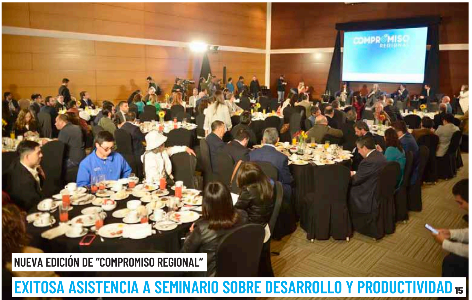
NUEVA EDICIÓN DE "COMPROMISO REGIONAL"

EXITOSA ASISTENCIA A SEMINARIO SOBRE DESARROLLO Y PRODUCTIVIDAD 15