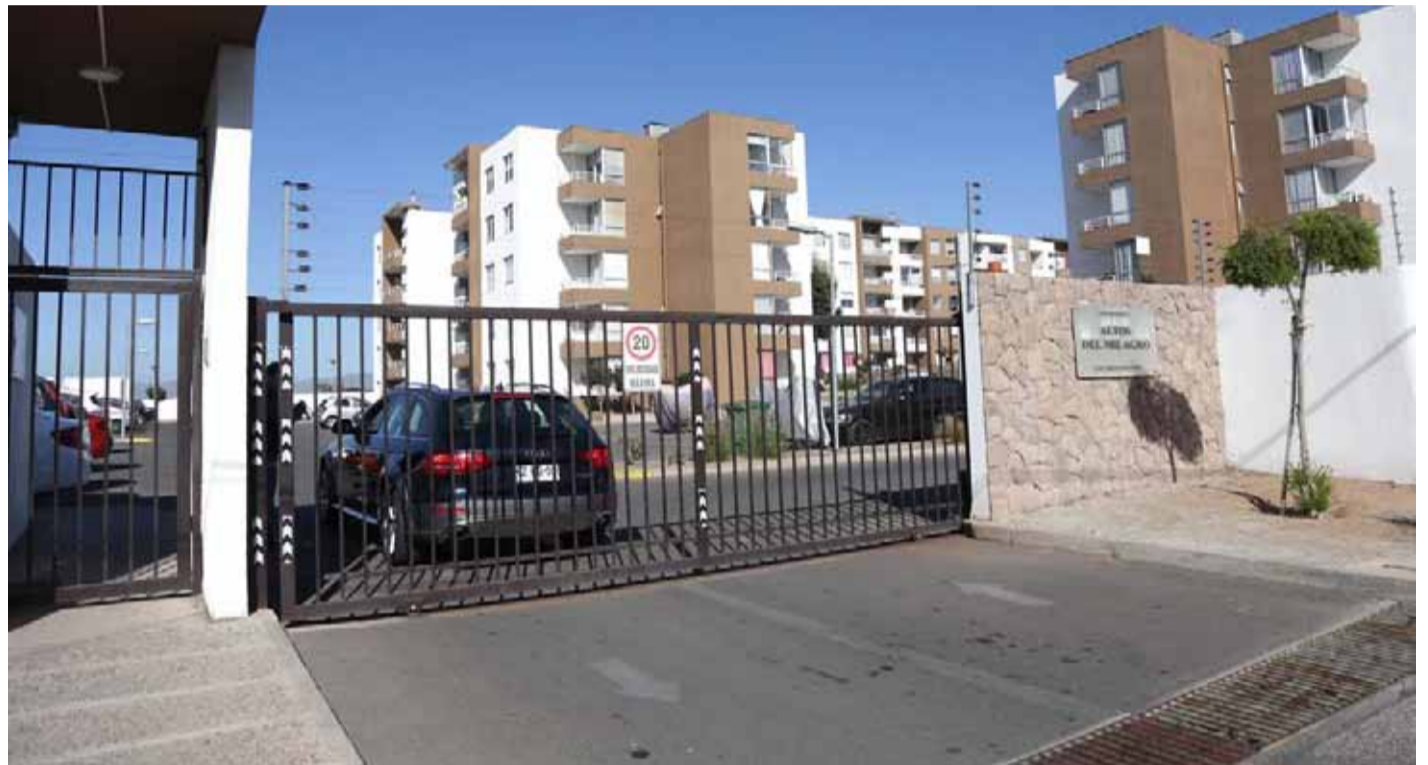
Los hechos se registraron la noche del martes en el condominio Altos del Milagro de La Serena.

En los videos de la cámara de la garita de seguridad, se puede ver cómo, mientras el vehículo de uno de los residentes entraba por el portón, la aparente adulta mayor pasa media curvada y caminando con dificultad con su muleta, pero con paso seguro, dirigiéndose a una de las torres. Pero no fue a la entrada de la misma, sino que dio la vuelta en su trayecto a un lado donde sólo hay balcones, lo que