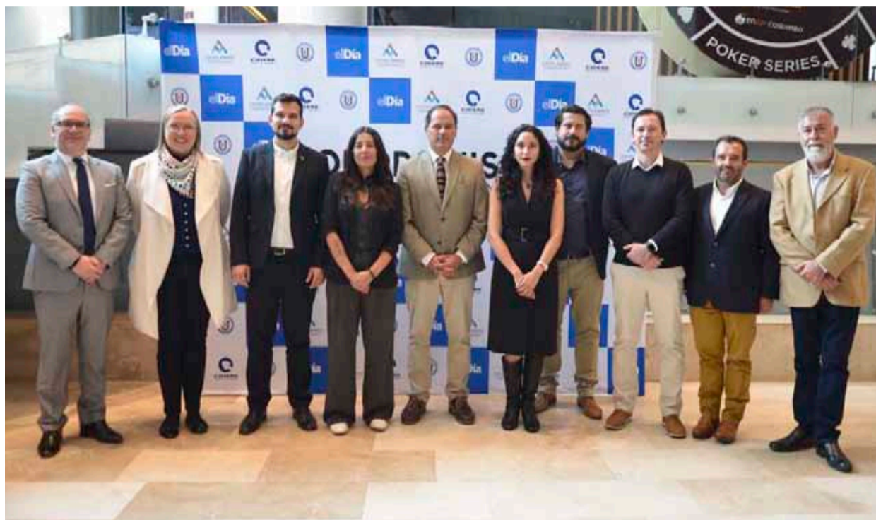
La actividad contó con gran convocatoria desde el ámbito público y privado.