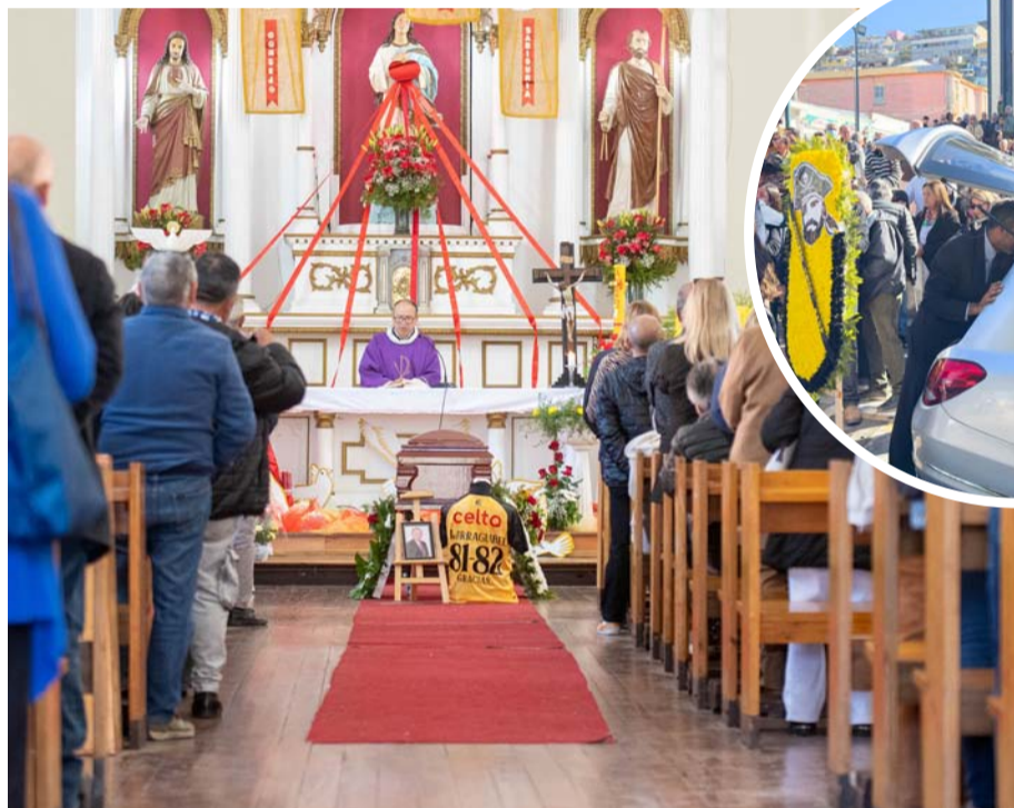
Multitudinaria despedida ayer en la Iglesia San Pedro de Coquimbo.

El sábado 18 de mayo, falleció este destacado vecino porteño producto de una deficiencia cardíaca. Reconocido por la comunidad y todos quienes lo conocieron por sus valores, su calidad humana y su trabajo incansable por el deporte local.