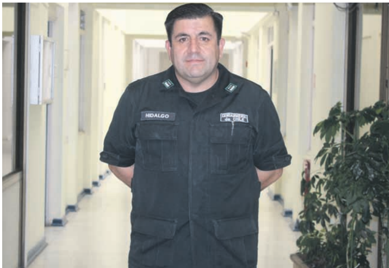
El coronel Hidalgo admite que han sido días difíciles luego de la muerte del funcionario.