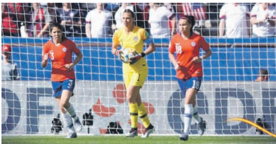
La selección nacional va en busca de su primer triunfo en un Mundial. Desde las 15:00 horas ante Tailandia.

De acuerdo a los resultados que se han dado, el equipo que dirige José Letelier podría avanzar con un triunfo, sin importar el marcador, o bien, por una diferencia de más tres o más goles, dependiendo de un duelo que también jugarán hoy, por la llave E, 12:00 horas, los equipos de Camerún y Nueva Zelanda, que tampoco suman unidades y que desde la vereda nacional, debiesen igualar.