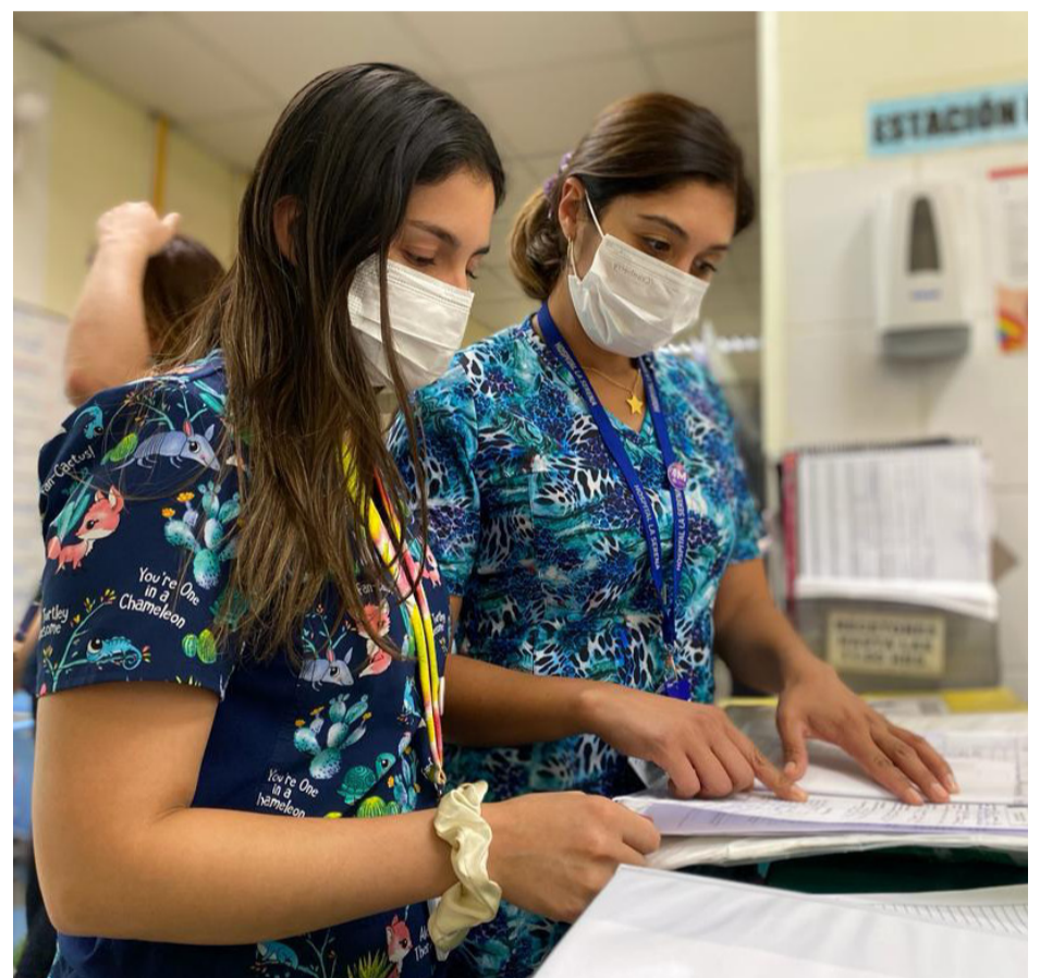
Los profesionales explican en qué caso acudir a urgencias de los recintos de salud.