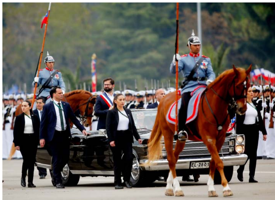
El presidente de la república, Gabriel Boric Font (c), hace su ingreso a la elipse del Parque O'Higgins para participar en la parada militar.

En la oposición llamaron al jefe de Estado a entregar señales a "todos los chilenos", y no solo a su "nicho". Desde el oficialismo confían en que su alocución contendrá -nuevamente- su compromiso por el respeto a los derechos humanos, recordando la conmemoración de los 50 años del golpe militar en Chile.