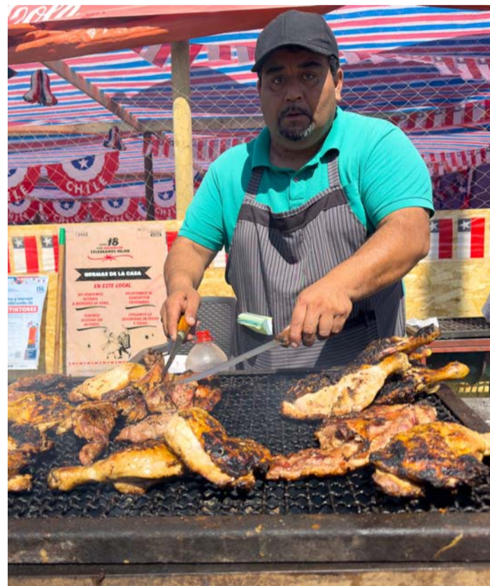
Los vendedores destacan la gran afluencia de público y esperan con ansias el tradicional remate.