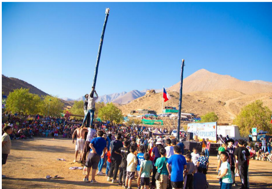
El tradicional palo encebado, el emboque, el tirar la cuerda, carreras en saco, además de domaduras y carreras a la chilena, dieron vida durante estos cuatro días de celebración.

Tal como lo sostuvo el alcalde de Vicuña, este miércoles 20 de septiembre, la Pampilla de San Isidro estará abierta de forma gratuita para la comunidad, pero no habrán juegos populares ni tampoco shows en el escenario.