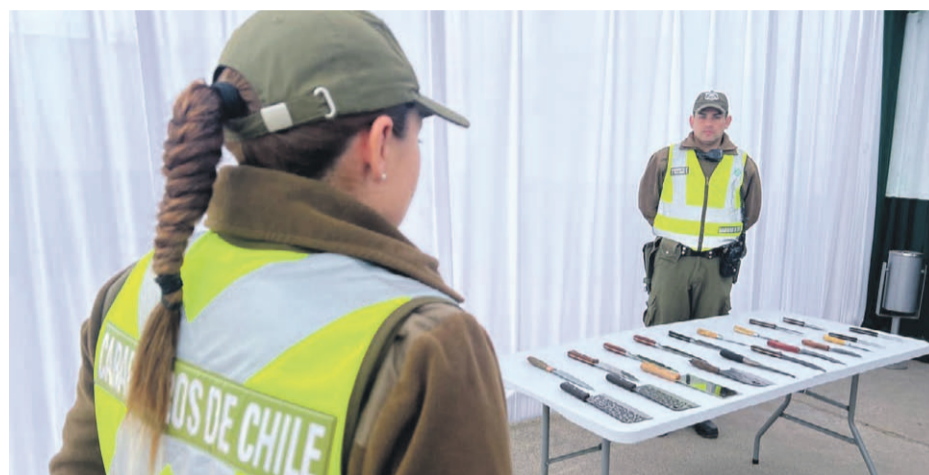
20 cuchillos que eran vendidos de manera informal lograron ser incautados por personal de Carabineros en La Pampilla.

“Estamos hablando de un trabajo íntegramente preventivo, donde a través de los múltiples controles y decomisos se ha logrado evitar la generación de espacios propicios para la comisión de delitos. En tres días, ya son 19 detenidos por infracción a la ley de drogas, tres por orden vigente, dos por hurto, uno por amenazas, uno por conducir en estado de ebriedad y uno por robo por