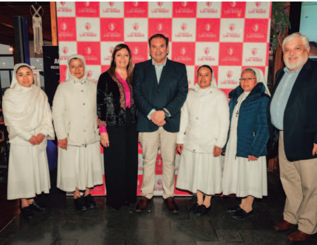
Hermanas del Sagrado corazón de Jesús y los pobres.