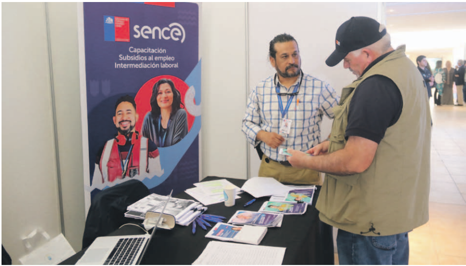
La feria laboral “Conecta tu Futuro”, busca ser un nexo entre empresas, OTEC, consultoras y personas en busca mejores oportunidades, todo con entrada liberada.

La Universidad Central Región de Coquimbo y Diario El Día darán el vamos a una nueva versión de la Feria Laboral “Conecta tu Futuro”, un espacio de encuentro entre empresas, instituciones y personas en búsqueda de trabajo o desarrollo profesional. La instancia comenzará hoy, a las 10 de la mañana.