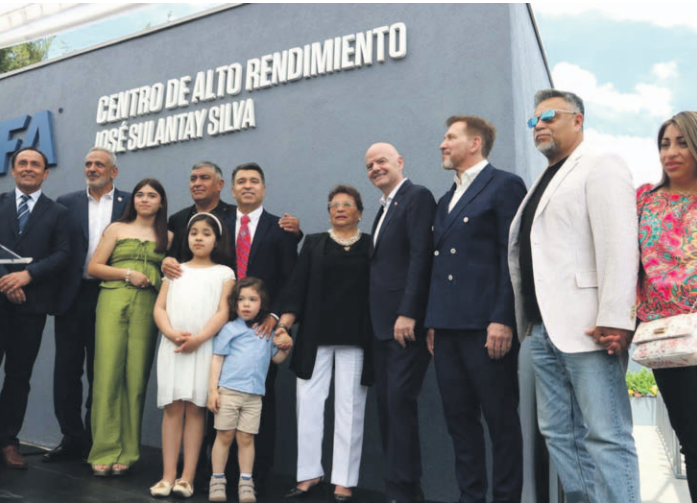
La ceremonia culminó con el descubrimiento del monumento y la placa conmemorativa que bautiza el recinto como “Centro de Alto Rendimiento José Sulantay Silva”, en memoria de quien fuera símbolo de esfuerzo, disciplina y formación de talentos en Chile. FEDERACION DE CHILE

una de ellas de pasto sintético con estándar FIFA, tribunas e iluminación de última generación, además de un gimnasio de 300 metros cuadrados, ocho camarines, salas médicas, utilería, oficinas técnicas y todas las instalaciones necesarias para el desarrollo de las selecciones menores masculinas y femeninas del país. Uno de los momentos más emocionantes fue el discurso de su hijo, el diputado Marco Antonio Sulantay, quien señaló que “es motivo de una alegría inmensa y un orgullo indescriptible que se haya decidido honrar con su