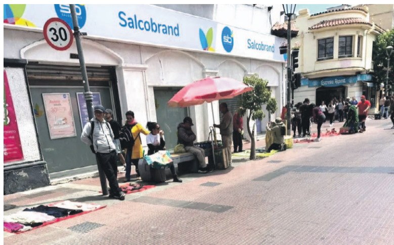
Durante la mañana de este martes, un grupo de vendedores ilegales nuevamente se tomaron las calles a vista y paciencia de la ciudadanía.

La situación ha generado malestar entre comerciantes establecidos y transeúntes, quienes denuncian la falta de control. Incluso un reportero ciudadano de Diario El Día manifestó su descontento a través de redes sociales. "Ojalá que las autoridades competentes se coloquen las pilas", expresó.