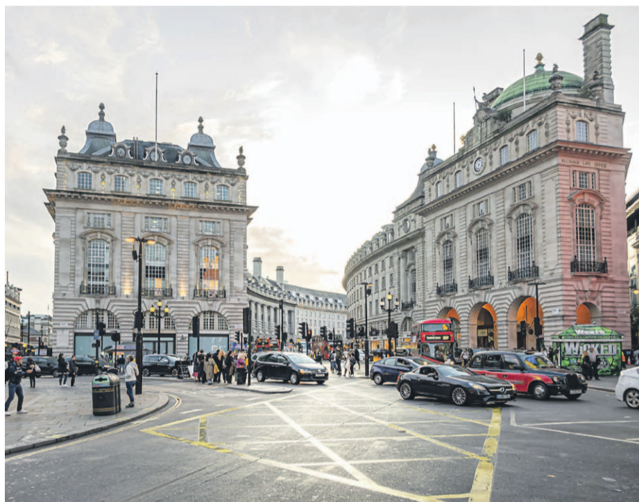
Imagen de la famosa intersección de Piccadilly Circus, en Londres.

Tras el anuncio de la serie de Harry Potter para la TV, los especialistas han identificado los lugares londinenses de rodaje de sus películas que son más populares en Instagram y ahora pueden visitarse para sentirse inmerso en la magia y el encanto de las aventuras del joven mago, a la espera de su llegada al formato televisivo.