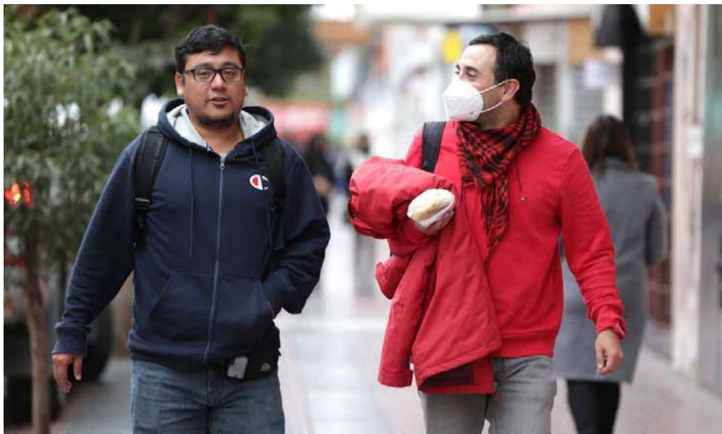
¿Se volverán a observar las mascarillas en las calles? Lo cierto, es que la circulación del patógeno continúa incrementándose. LAUTARO CARMONA