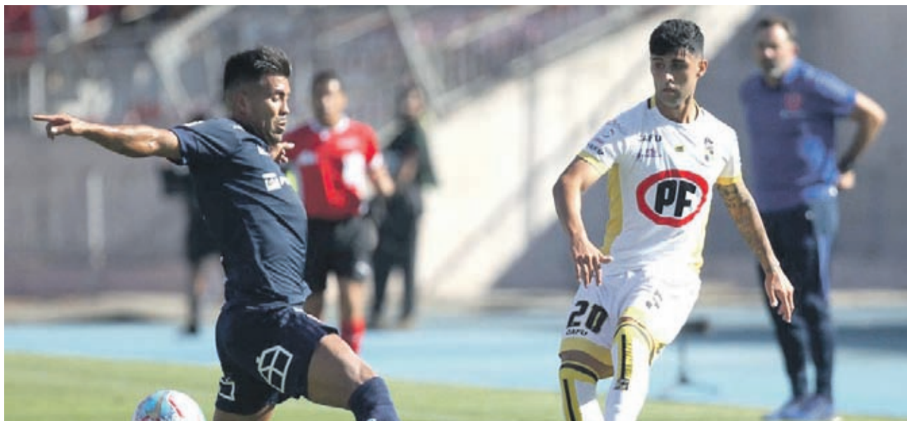
La actividad profesional ha sido duramente golpeada desde octubre pasado. Hay clubes que apenas han jugado cuatro partidos en calidad de local en siete meses, entre ellos el elenco aurinegro.

debíamos mantenernos en las casas, que el retorno del fútbol sería tarde. La comisión retorno del campeonato estaba viendo si en realidad se podía volver en julio o en agosto, que son como las fechas oficiales hasta ahora. Esa es la fecha, para allá apuntaban todas estas reuniones sostenidas en teleconferencias con los otros presidentes y en la ANFP”, recalca.