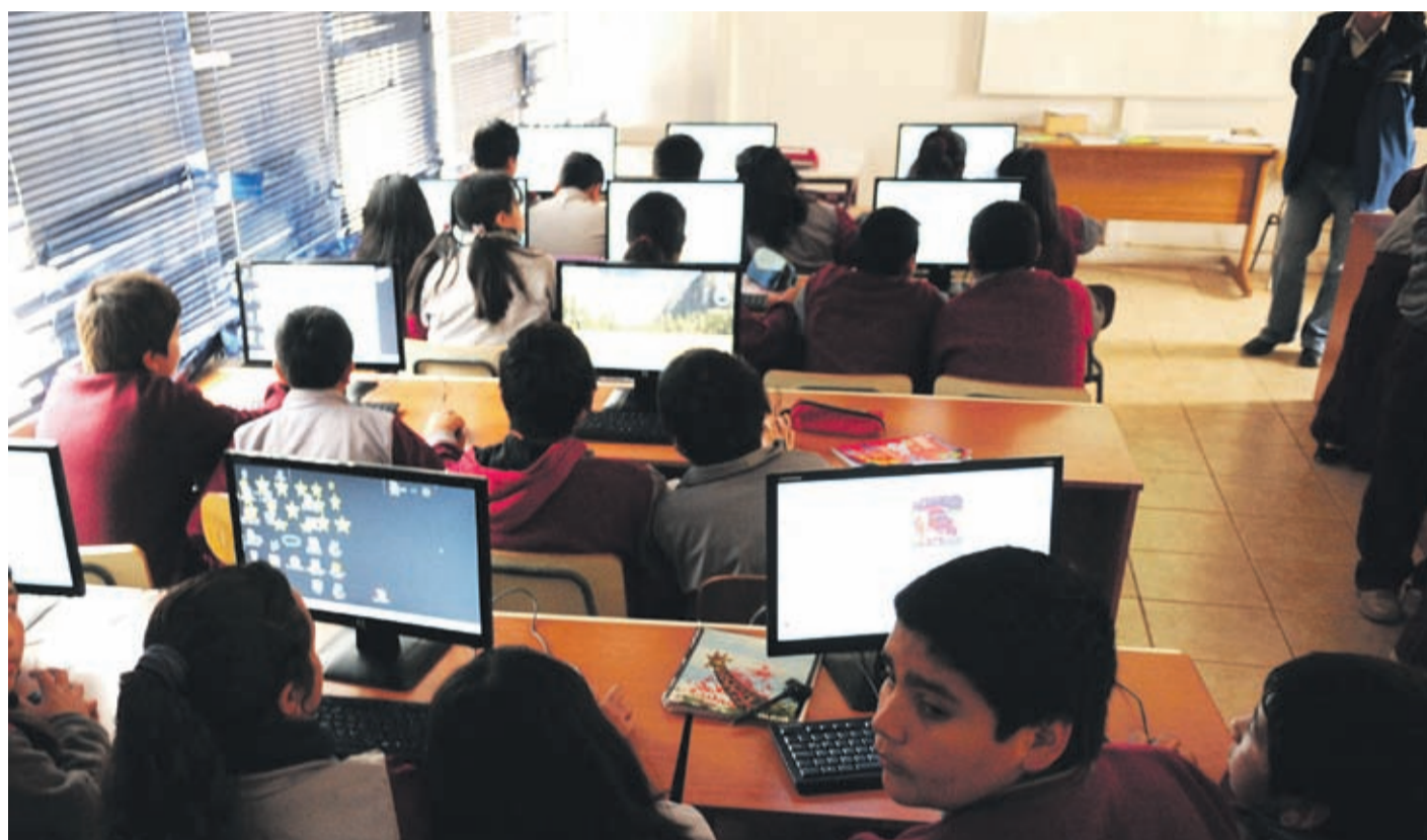
Los dirigentes del gremio de profesores insistieron ayer en que no retornarán a las aulas de clases por el Coronavirus.

En el documento que menciona el dirigente se señala una serie de incum-