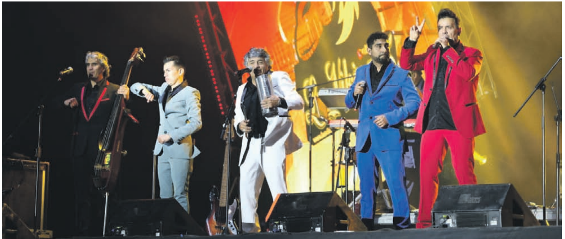
El conjunto de cumbia se ha mantenido conectado con sus seguidores a través de sus redes sociales, donde les informan las últimas novedades del grupo.