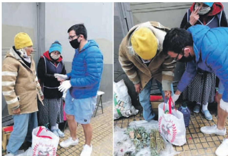
No pertenecen a ninguna agrupación y afirman que no hay “ningún interés político” detrás de la iniciativa.

Este lunes fueron a la casa de una abuelita que vive con su esposo no vidente. “Cocinaban a leña y viven de puras donaciones y las ayudas que les