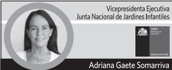
Vicepresidenta Ejecutiva Junta Nacional de Jardines Infantiles