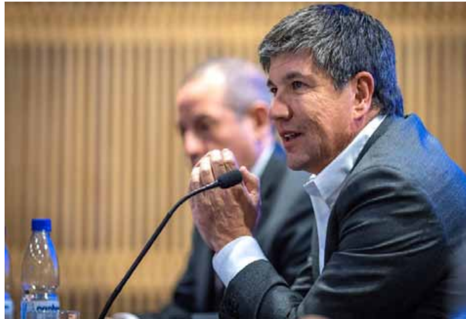
El subsecretario del Interior, Manuel Monsalve, anunció la llegada de refuerzo policial a la ciudad de Calama.

El subsecretario del Interior, Manuel Monsalve, anunció una serie de medidas pro seguridad para Calama, en la Región de Antofagasta. En ese sentido, informó la presencia de un escuadrón centauro de Carabineros, nuevos funcionarios de la Policía de Investigaciones (PDI), la designación de un fiscal preferente y fiscalización intensiva enfocada en materia de armas.