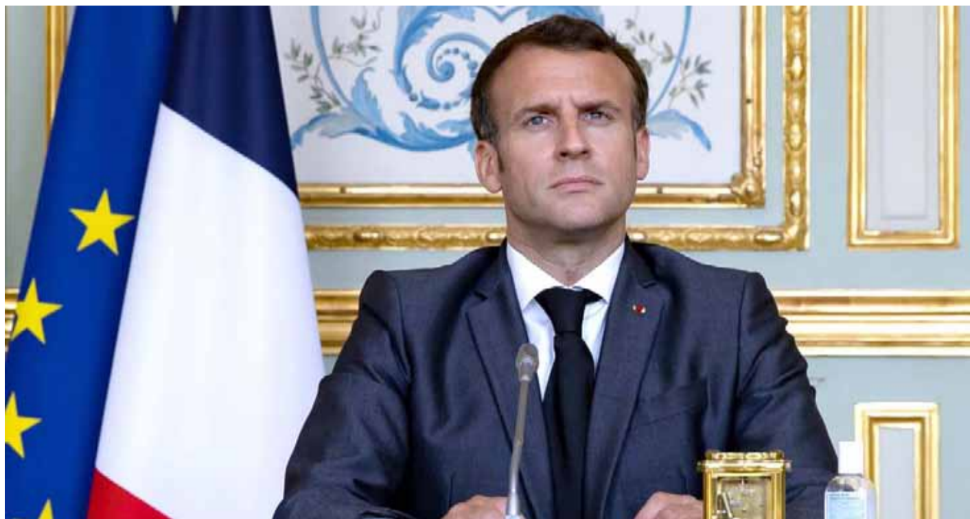
El presidente de Francia, Emmanuel Macron, lleva varias semanas enfrentando un cuadro de profundo descontento social y protestas en su país.

Durante la mañana de ayer, se prohibieron los “dispositivos sonoros portátiles” en la zona según orden del prefecto, por lo que los gendarmes confiscaron las ollas y cacerolas a los manifestantes, manteniéndolos a su vez alejados de la delegación presidencial, in-