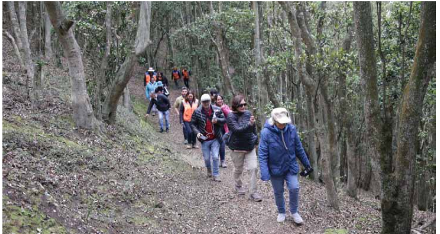
El Cerro Santa Inés tiene un alto valor ecológico, ambiental, paisajístico y de investigación.

“Desde 2018 que estamos implementando diversas medidas en el sector y ellas principalmente son para protegerlo. Esperamos que el próximo año se encuentre habilitado el centro de visitantes con las condiciones para que las personas puedan subir de modo seguro. Es un plus para el turismo de Pichidangui, y no sólo porque van a llegar a conocer el bosque, sino que también por cuanto tenemos interés