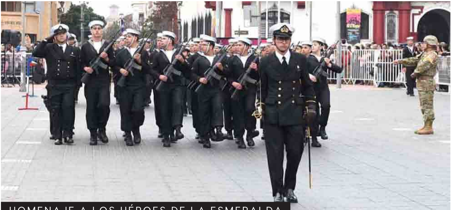
HOMENAJE A LOS HÉROES DE LA ESMERALDA