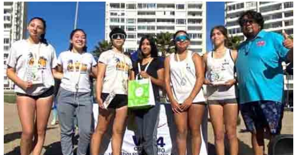
El vóleybol playa sigue convocando a gran cantidad de jóvenes y familias.