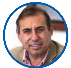
Sergio Gahona SENADOR UDI

“El caso de Ovalle viene a ratificar que se obró mal. La pensión de gracia es un beneficio que otorga exclusivamente el Presidente de la República para casos graves”