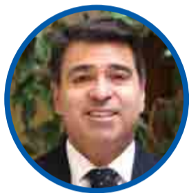
Marco Sulantay DIPUTADO UDI

“Se hace urgente tramitar el proyecto de ley que está en la Cámara para derogar la facultad discrecional del Presidente de la República para otorgar pensiones de gracia”