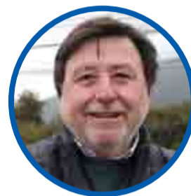
Ricardo Cifuentes DIPUTADO DC

“Hemos oficiado al Ministerio del Interior para que se le suspenda la pensión de gracia a aquellos delincuentes que siguen lucrando con el dinero de los chilenos”