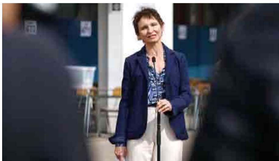
La ministra del Interior, Carolina Tohá, aseguró que existe un total respaldo del gobierno a esta iniciativa.