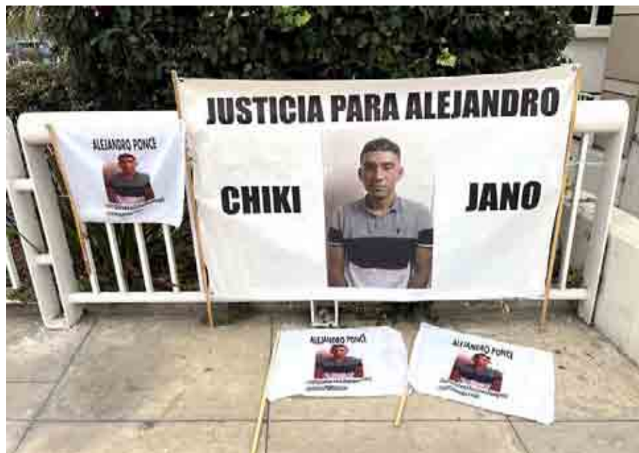
9 son los imputados por el secuestro y homicidio de Alejandro Ponce.

Necesitando el dinero, sin embargo, al día siguiente se dirigieron a la casa de J.M.O., para cerrar la venta del aparato. Sin embargo, éste les habría confesado que “el Chiki” - Alejandro