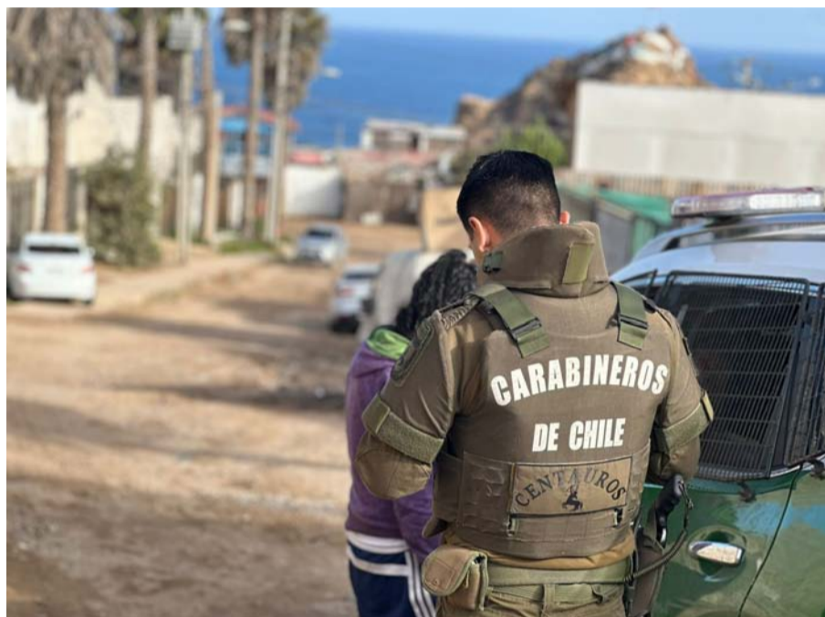
En la imagen, uno de los operativos del equipo especializado de Carabineros.

En la Prefectura de Coquimbo, la unidad está compuesta por 14 funcionarios que actúan siempre conectados, en una especie de enjambre en los territorios más vulnerables ante la delincuencia. Hoy son reconocidos por vecinos y también por los delincuentes que saben de su actuar temerario y sus exitosos procedimientos.