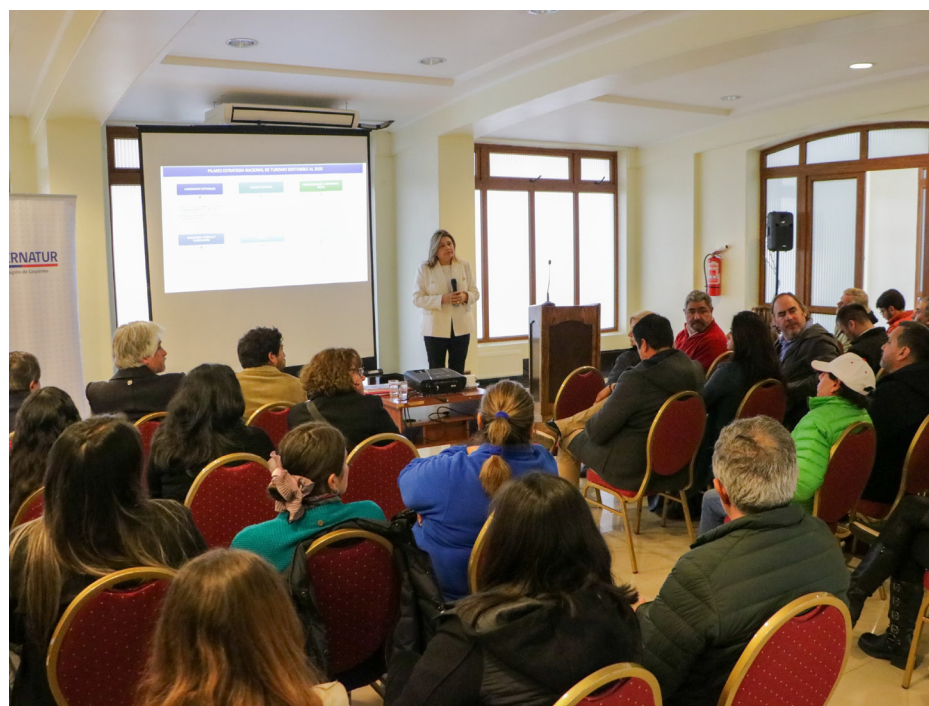
La estrategia propone que la gobernanza sea liderada por el Gobierno Regional, con temáticas específicas locales.