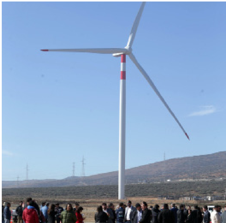
La empresa tiene dos meses para aplicar las acciones solicitadas.