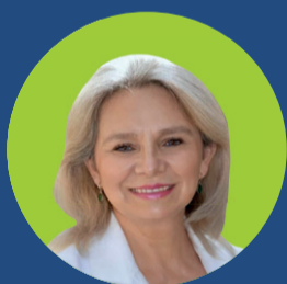
TATIANA CASTILLO (Partido Social Cristiano)