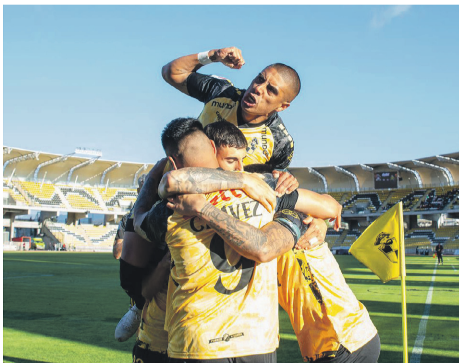
El próximo partido de los "piratas" será de local ante Unión La Calera.

Los "piratas" vencieron por 2 a 0 a Cobresal y llegaron a 41 puntos en el séptimo lugar, lo que le permitiría clasificar a Copa Sudamericana.