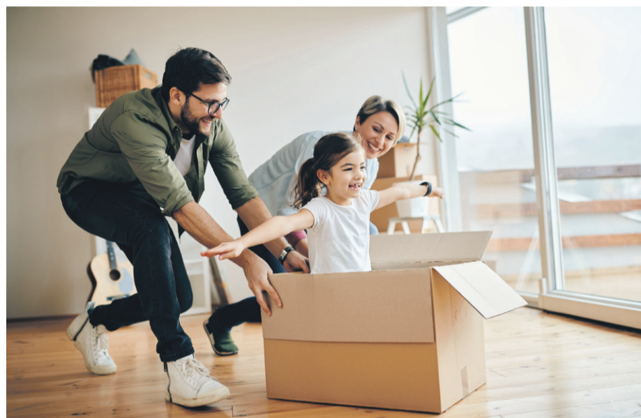
Familia jugando con cajas.

“La disciplina auténtica, es decir, la capacidad de controlarse a uno mismo y