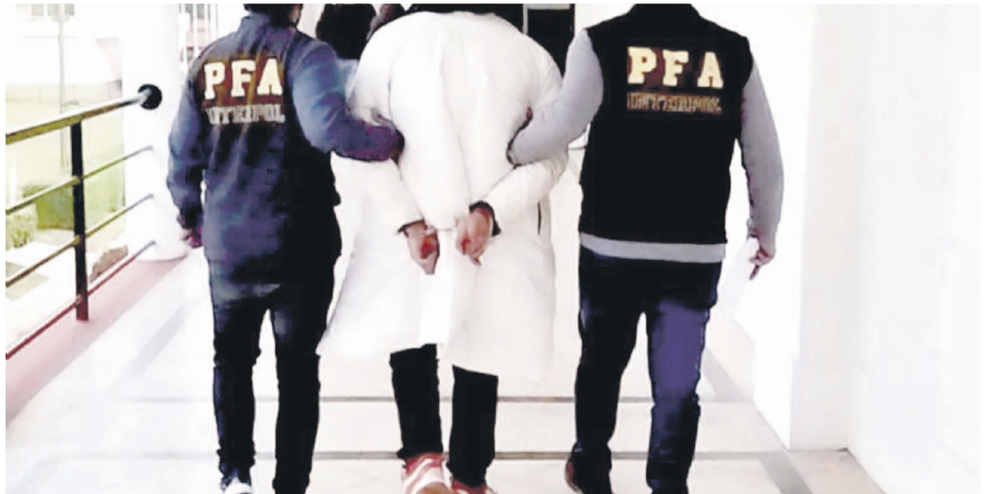
El imputado por el doble homicidio, apodado como "el Chuma" se encuentra en prisión preventiva, tras ser extraditado desde Argentina.

Este miércoles se llevó a cabo la audiencia de preparación de juicio oral, por el caso del doble homicidio de un padre y su hija en Ovalle. La defensa del imputado, en tanto, espera comprobar la inocencia de su representado, asegurando que no se encontraba en el lugar en donde se produjo el crimen.