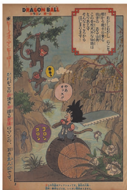
20 de noviembre de 1984 Primera publicación

519 capítulos individuales publicados entre 1984 y 1995 42 volúmenes del manga