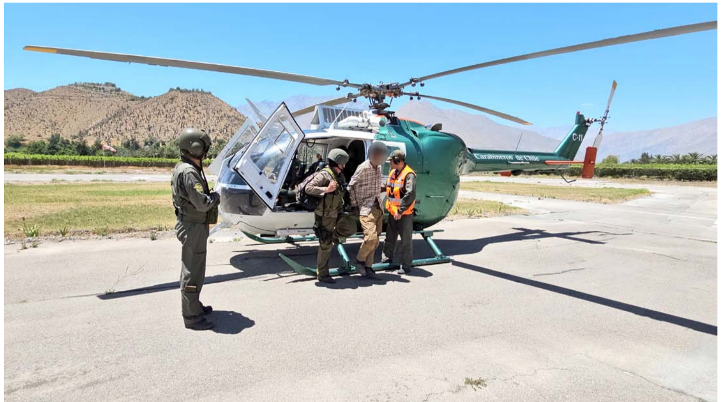
Tanto la investigación en terreno como el despliegue aéreo de Carabineros resultó fundamental para el éxito de ambas operaciones.

Precisamente por eso, toma especial importancia la inversión de más de 9 mil millones de dólares realizada por el gobierno regional en un nuevo helicóptero policial, que debiera llegar a la zona durante los últimos meses del próximo año. “Se trata de un Airbus H135, un helicóptero bimotor con capacidad para hasta siete personas, y que llega para renovar la aeronave hoy existente, que ya cumplió su vida útil. Con ello, la Región de Coquimbo asegura un elemento fundamental para inves-