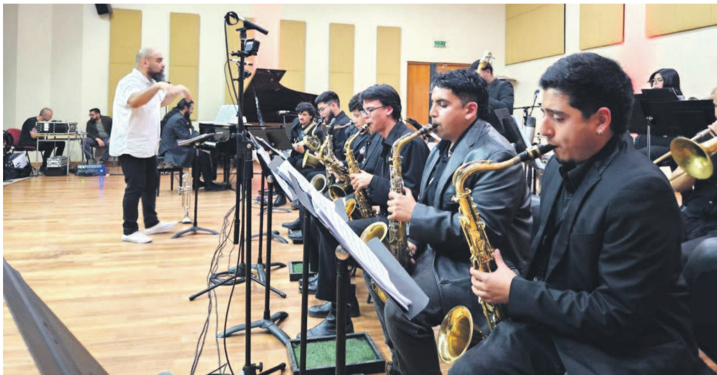
Los músicos agradecieron la buena respuesta del público y esperan continuar con sus presentaciones durante los próximos meses.

Con más de 20 músicos en escena, el concierto "Los Reyes del Mambo Jazz" que ofreció la orquesta universitaria fue todo un éxito, cautivando al público con una mezcla de géneros hispanos y un ambiente vibrante.