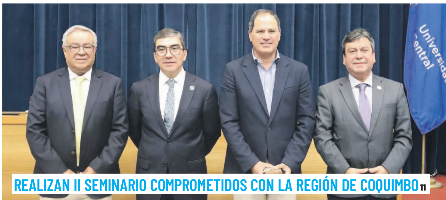
REALIZAN II SEMINARIO COMPROMETIDOS CON LA REGIÓN DE COQUIMBO 11

El Servicio de Salud Coquimbo busca evitar la suspensión de cirugías, procedimientos o intervenciones en los recintos debido a problemas de financiamiento. 7