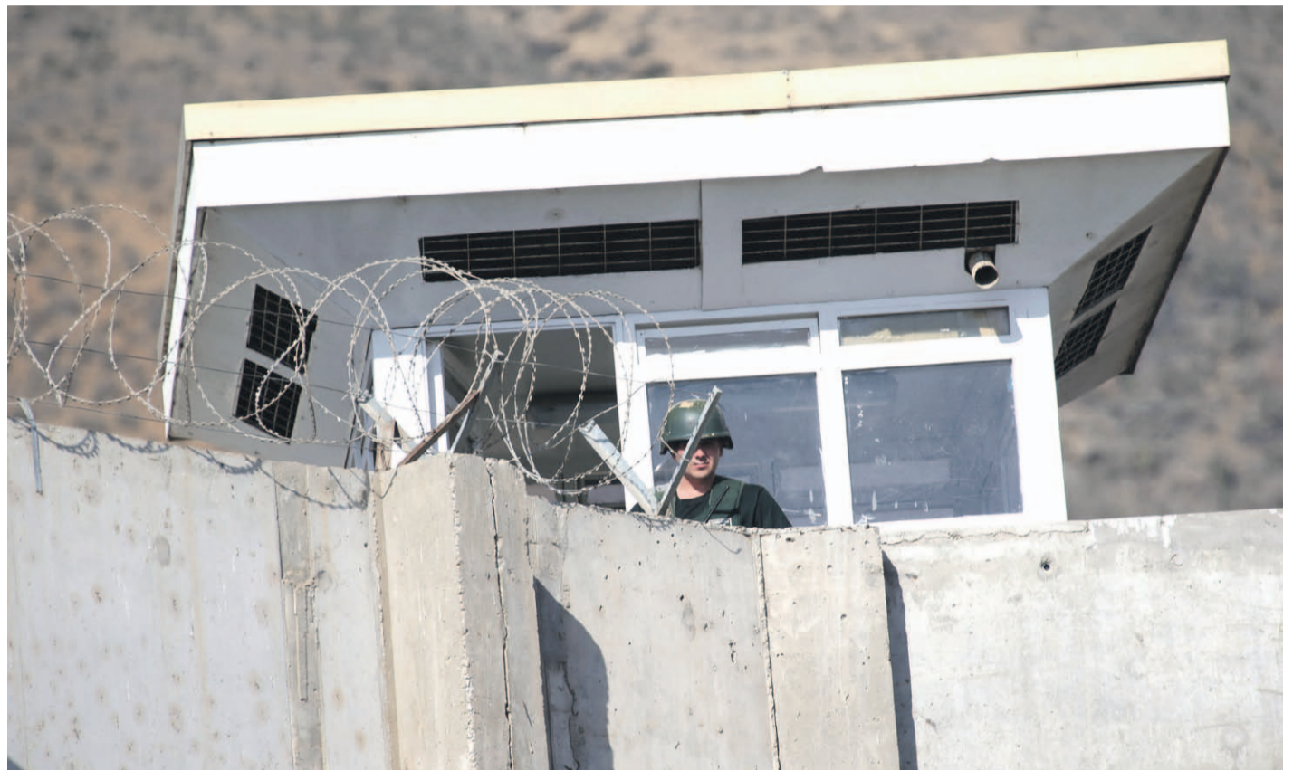
Los funcionarios de Gendarmería en la región se encuentran movilizados a la espera de la respuesta a sus demandas a nivel nacional.

"No se realizó ningún tipo de traslado a audiencia, ni tampoco a cualquier