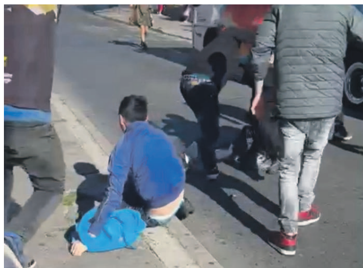
El violento asalto que sufrió el estudiante de 17 años quedó grabado en video.