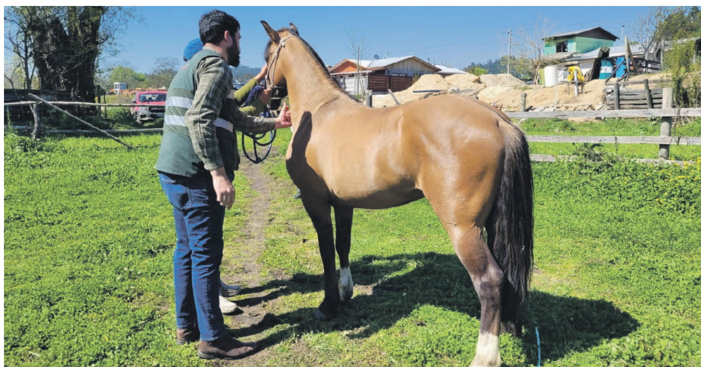
El SAG llamó a extremar medidas de bioseguridad en la región para evitar nuevos contagios de anemia infecciosa equina.

En un comunicado oficial, el SAG informó que, tras estos primeros casos en la región, se activó la cuarentena total de los predios involucrados, lo que implica la prohibición absoluta de ingreso o salida de caballos. La entidad también reforzó el llamado