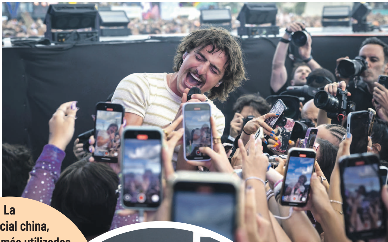
El cantante estadounidense Benson Boone debe gran parte de su éxito a Tiktok.

El caso de Benson Boone y el exitoso "Beautiful Things" también demuestra que solo hace falta que un fragmento de un tema se vuelva viral en TikTok para alcanzar el éxito. Artistas como Lil Nas X, con "Old Town Road", y Lola Young, con "Messy", también han