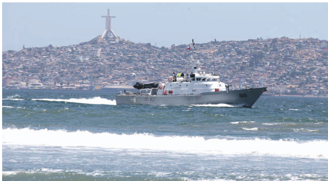
Las lanchas Coquimbo y Arcángel son parte de todo el aparataje técnico y humano desplegado en la zona más turística de La Serena: la Avenida del Mar.

Para la búsqueda, la Armada de Chile ha dispuesto dos patrulleras, la Lancha Coquimbo, de servicio general y la Arcángel. También un robot submarino y un bote de goma de la Gobernación Marítima.