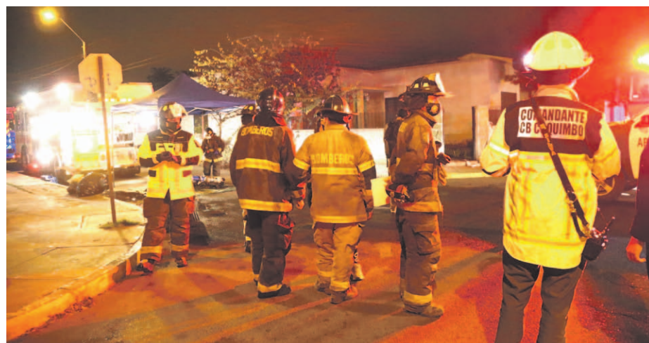
La institución reveló que el aporte estatal solo cubre entre el 40% y 50% de su presupuesto operativo, obligándolos a una constante autogestión para cubrir el resto.

El superintendente de Coquimbo explicó que con menos ingresos disponibles deberán postergar la mantención de los carros bomba y la compra de elementos de protección, en un año en el que se proyectan realizar hasta 1.400 intervenciones.