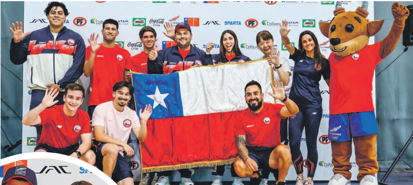
La designación de Flores como abanderado en Perú resalta el crecimiento que ha tenido el tirador deportivo. Será el líder de una misión que integrarán 297 representantes en 31 deportes.

Con esta dupla de abanderados – una figura olímpica y un representante de élite formado en regiones – el Team Chile inicia un proceso que no solo apunta a resultados deportivos, sino también a fortalecer identidades locales y el desarrollo equitativo del alto rendimiento en todo el país.