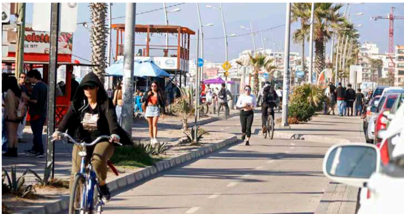
Ya se comienzan a observar los primeros turistas en la Región de Coquimbo.

La conurbación siempre ha sido uno de los lugares predilectos para conocer, tanto para niños como para adultos. Es así como no sólo se puede realizar un entretenido paseo por la Avenida del Mar, sino también, estar en la playa, aprovechar su rica gastronomía, ir al casino o disfrutar de la vida nocturna.