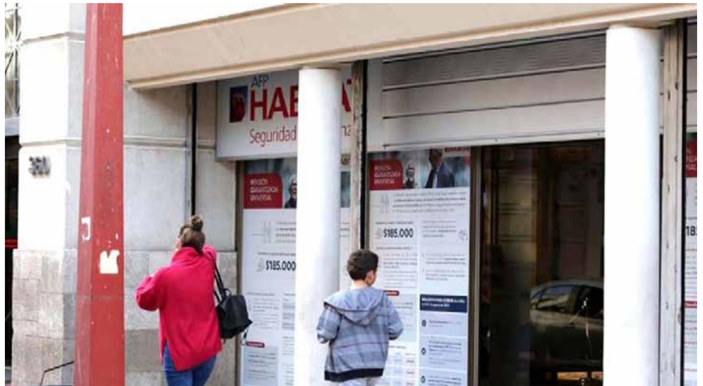
Lejos de lograr acuerdos, la reforma previsional sigue estancada en la discusión parlamentaria.

Pero el aspecto solidario de la propuesta sigue generando descontento