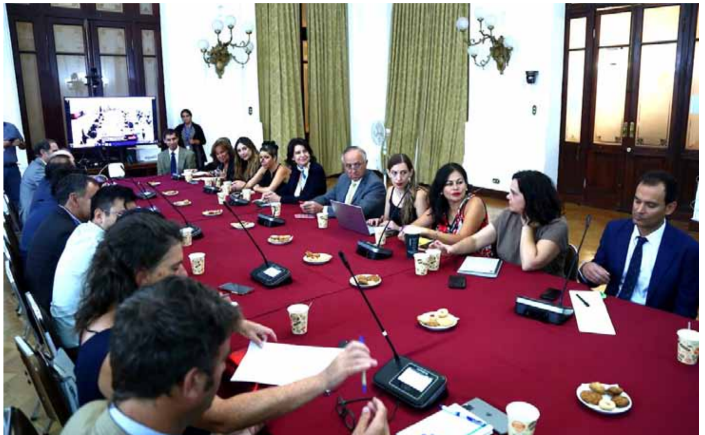
La reciente propuesta de nueva Constitución fue rechazada por más de un 55% del electorado.