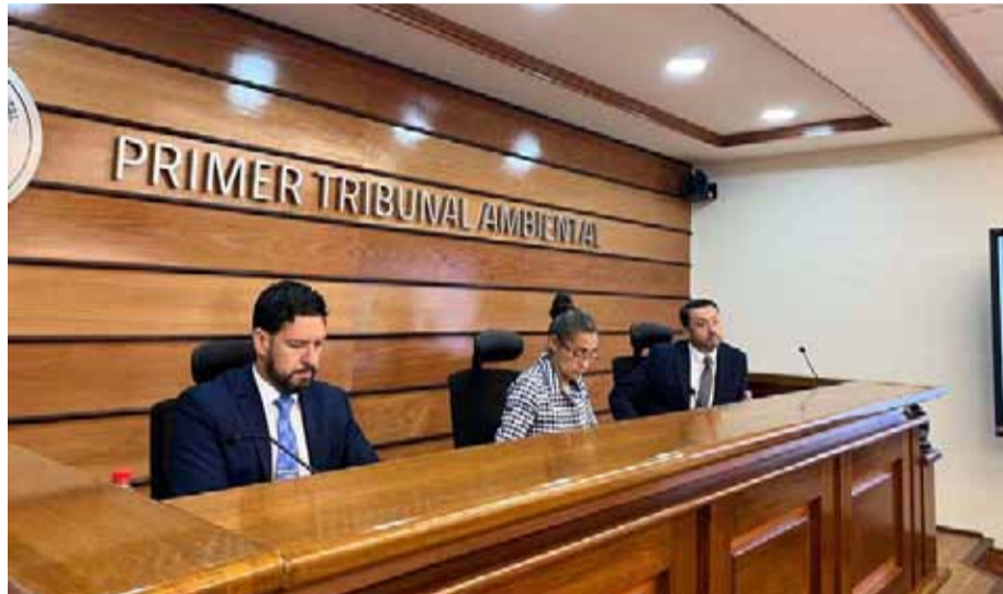
Tal como ocurrió hace algunos años, el Tribunal Ambiental de Antofagasta escuchó los alegatos de todas las partes en medio de la revisión del proyecto Dominga.

Durante este miércoles, el Primer Tribunal Ambiental escuchó a las distintas partes involucradas en torno a la iniciativa a cargo de Andes Iron por cerca de 8 horas. Tras esta etapa, los ministros de la corte especializada podrían solicitar más diligencias o bien comenzar a redactar el fallo, el que podría ser apelado en la Suprema.