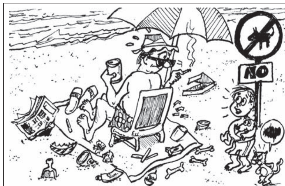
VACACIONES ECOLÓGICAS Tío... ¿Seguro que son las mascotas las que ensucian la playa.