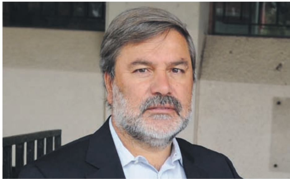
El presidente de la Comisión de Ordenamiento Territorial, Planificación e Infraestructura, Marcelo Castagneto.