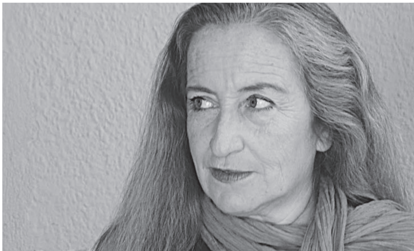
La destacada autora se presentará el 5 de febrero a las 20 horas en la Feria del Libro de La Serena.

“Creo que Las Tesis son un regalo para la humanidad. Han permitido la posibilidad de que miles de mujeres alrededor del mundo puedan gritar el abuso y algo que las rascaba por dentro. Las Tesis son un regalo para