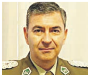
COMANDANTE CARLOS ROJAS

“Vamos a reunirnos todos los lunes en una reunión técnica con los municipios, va a estar PDI invitada y Carabineros para poder ver como se actúa en materia de seguridad en la conurbación”.